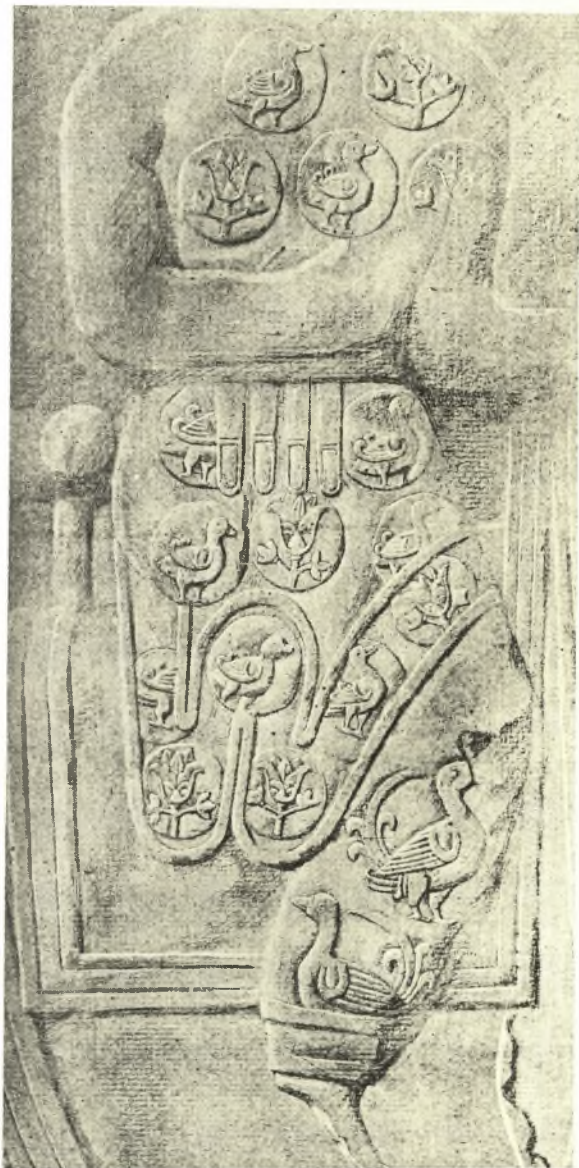
Εἰκ. 3. Ἐκ τῶν γλυπτῶν τοῦ σπηλαίου τοῦ Χοσρόου ἐν Τάκ-ι-Βοστάν (O. v. FALKE Kunstgeschichte der Seidenweberei (1921) εἰκ. 60).

Χαρακτηριστικός είναι και ο διάκοσμος του χιτώνος. Ἡ ἐκ τοῦ ἀριστεροῦ ὤμου φερομένη λοξῶς ἐπὶ τοῦ στήθους ἐρυθρὰ παρυφή μετὰ διπλῆς σειρᾶς ἐφαπτομένων