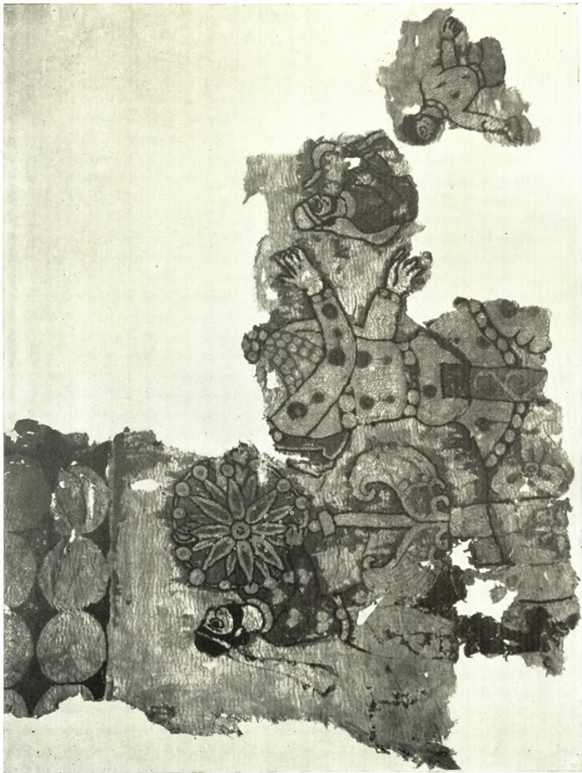
Μεθυστική πομπή επί θρόνου, Αίγυπτος.