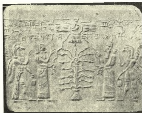
Εἰκ. 13. Ἀσσυριακὸς κύλινδρος ἐκ Moushesh-Nin-Ourta ἐν τῷ Βρετανικῷ Μουσείῳ.

γνωστὸν τὰ θέματα τῶν κυλίνδρων εἶναι συμβολικά, παριστῶντα ὡς ἐπὶ τὸ πλεῖστον μυθικὰς σκηνάς, μαγικοὺς τύπους, λατρείαν θεοῦ τινος ἢ παρουσίαν προσκυνητῶν (ἡγεμόνων) πρὸ τοῦ θεοῦ καὶ τὰ τοιαῦτα. Πάντα τὰ ἀνωτέρω διετηρήθησαν ὑπὸ διαφόρους τύπους ἢ παραλλαγὰς μεταξὺ τῶν ἀνατολικῶν λαῶν. Ἡ διατήρησις δὲ τῶν συμβολισμῶν παρὰ τοῖς Σασσανίδαις καὶ ἐν γένει παρὰ τοῖς Ἀσιατικοῖς λαοῖς εἶναι πανθομολογουμένη 3 .