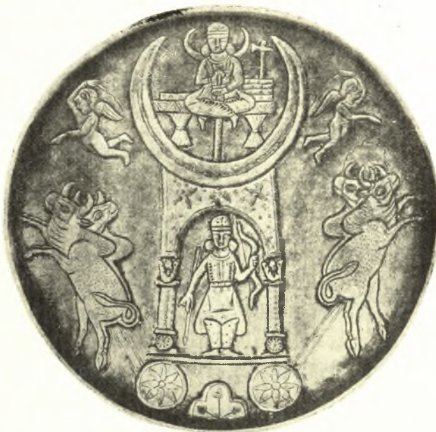
Εἰκ. 4. Φιάλη ἀργυρᾶ ἐκ Klimova ἐν Ermitage (CHRISTENSEN L'Iran σ. 177 εἰκ. 8).