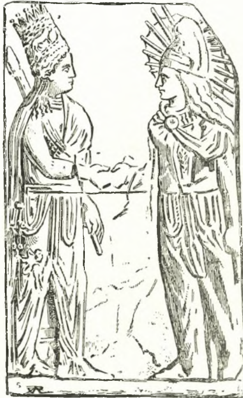
Εἰκ. 15. Ἀνάγλυφον τοῦ Nimroud Dagh (HUART La Perse antique).

Ὁ Μίθρας, ὁ Sol invictus τῶν Μιθραϊστῶν εἰκονίζεται εἰς τὰ ἐλθόντα εἰς φῶς μνημεῖα ἀνθρωπόμορφος ὑπὸ διαφόρους τύπους, συνήθως ταυροκτόνος 1 , τύπος δημιουργηθεὶς κατὰ τὸν 2 ον π.Χ. αἰ. κατ' ἀπομίμησιν τοῦ Ἡρακλέους συλλαμβάνοντος τὴν Κερυνίτιν ἔλαφον 2 , πιθανῶς ἔλκων τὴν καταγωγὴν ἐκ προτύπου τινὸς τῆς Περσῆς 3 .