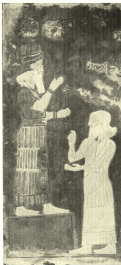
Εἰκ. 10. Παράστασις ἐκ σμάλτου ἐπὶ ὀπτοπλίνθου ἐξ Ἀσσοῦρ ἐν Βερολίῳ.

Ὡς σύμβολον τῆς θείας δυνάμεως φέρουσαι τὰς πτέρυγας ἐπὶ εἰκονικῶν μνημείων τῆς Μεσοποταμίας θεοὶ καὶ δαίμονες 5 καὶ συμβολικὰ φανταστικά ζῶα 6 . Σὺν τῷ χρόνῳ αἱ πτέρυγες παρελήφθησαν καὶ ὑπὸ ἄλλων λαῶν πρὸς δῆλωσιν συναφοῦς ἐννοίας, ἀποδοθεῖσαι ὁμῶς συμφώνως πρὸς τὰς δοξασίας καὶ τὰς καλλιτεχνικὰς ἀντιλήψεις ἐκάστου τούτων.