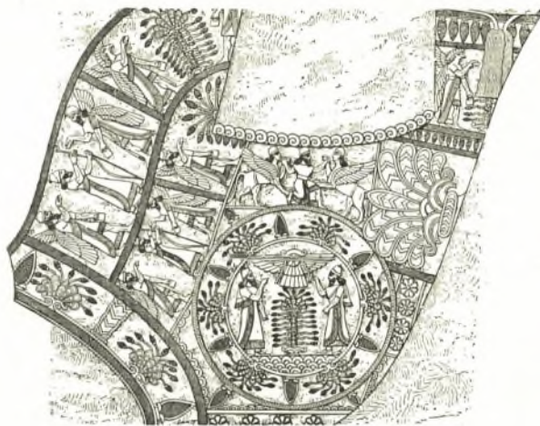
Εἰκ. 17. Διάκοσμος ἐπὶ βασιλικῷ ἐπιστηθαίῳ.

Τὰ βασιλικά ἐνδύματα πλὴν τοῦ πολυτελεστάτου διακόσμου ἐκ μαργαριτῶν καὶ πολυτίμων λίθων ἔφερον καὶ διάφορα διακοσμητικὰ θέματα κεντημένα ἢ ὑφαντὰ (τετράφυλλα, κλαδίσκους ἐντὸς κύκλου — ἱερὸν δένδρον; — νήσας, ἱποκάμπους κλπ.) 1 . Πρὸς τούτοις παρίσταντο καὶ σύμβολα τῆς βασιλικῆς ἀρχῆς καὶ ἡ εἰκὼν τοῦ βασιλέως, ὡς ἀνωτέρω. Πιθανῶς ἐκ Περσικῆς ἐπίδρασεως εἰκονίζοντο ἐπὶ τῶν ἐνδυμάτων τῶν αὐτοκρατόρων τοῦ Βυζαντίου καὶ αἱ εἰκόνες τούτων 2 .