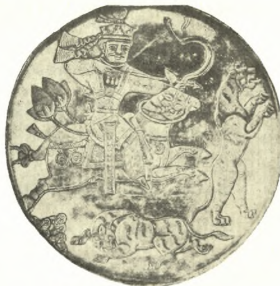
Εἰκ. 5. Ἀργυρᾶ Σασσανιδικὴ φιάλη ἐν Λένινγκραδ (FALKE εἰκ. 22)

λευκῶν κύκλων εἶχεν ἀντίστοιχον, ὡς μαρτυρεῖται ἐκ τῶν εἰκονικῶν μνημείων 1 , καὶ ἐπὶ