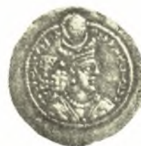
Εἰκ. 2. Νόμισμα τοῦ Vahram E' (Συλλογὴ τοῦ συγγραφέως CHRISTENSEN L'Iran sous les Sassanides σ. 276 εἰκ. 31).

Πρὸς Μεσοποταμιακὰ μνημεῖα συνάπτεται καὶ τὸ διπλοῦν κάλυμμα τῆς κεφαλῆς, ὁ ἡμισφαιρικός σκοῦφος καὶ ἡ περὶ τὴν βᾶσιν του ἐλισσομένη καὶ καταπίπτουσα εἰς τὰ νῶτα τῶν ἀνδρῶν ταινία 4 . Τὸ κάλυμμα τοῦτο ἔφερον κατὰ διαφόρους τρόπους οἱ Πέρσαι καὶ ἐν γένει οἱ λαοὶ τῆς Ἀσίας, ἀλλ' ἐποίκιλλε κατὰ τὸ σχῆμα, τὰς διαστάσεις καὶ τὸν τρόπον τοῦ φορεῖσθαι κατὰ χώρας καὶ ἐποχὰς συμφώνως πρὸς τὴν κοινωνικὴν θέσιν καὶ τὸ ὑπόργημα τοῦ φοροῦντος 5 .