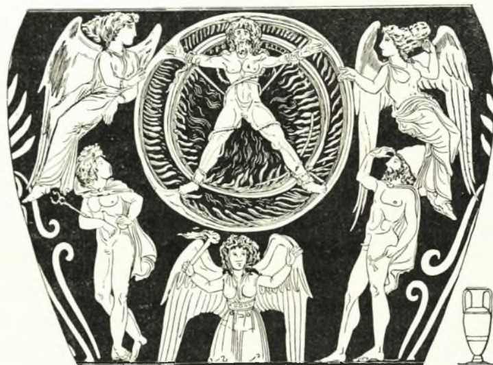
Εἰκ. 16. Καμπανικὸς ἀμφορεὺς ἐκ Κύμης Παράστασις τοῦ Ἰξίονος. Βερολίνον 3023.

Ὁ κύκλος «ὁ περιστρεφόμενος ἐν τοῖς τῶν θεῶν τεμένεσιν εἰλκυσμένος παρ' Αἰγυπτίων» τὸν ὁποῖον ἀναφέρει Κλήμης ὁ Ἀλεξανδρεὺς (Στρομ. 5 σ. 242) εἶναι ἀσφαλῶς ἐκ τῶν συμβολισμῶν τῶν συνδεομένων πρὸς τὴν περιστροφικὴν κίνησιν διατυποῦσαν