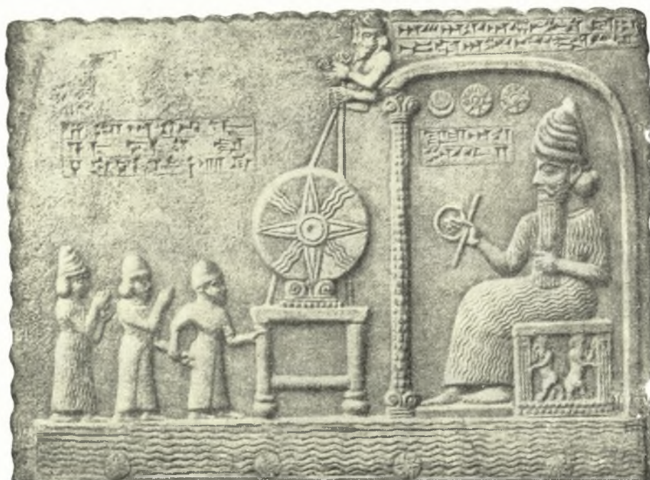
Εἰκ. 6. Ἄνω μέρος ἀναγλύφου τοῦ Βαβυλωνίου Nabu-apal-iddin ἐξ Abu-Habba-Sippar ἐν τῷ Βρετανικῷ Μουσεῖῳ.

Ἐκ τῶν ἡλιακῶν συμβόλων, καὶ εἶναι ταῦτα πολλά 2 , παραστατικώτερον καὶ συνηθέστερον ἦτο ὁ κύκλος 3 , δίσκος ἢ τροχός 4 , συμβολίζων τὴν ἀτέρμονα περιστροφικὴν