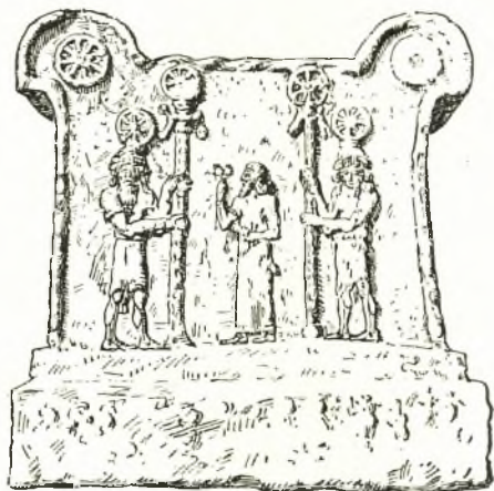
Εἰκ. 12. Βωμὸς μετ' ἀναγλύφων ἐξ Assour. Μουσεῖον Κωνσταντινουπόλεως.

Αἱ δύο σκηναὶ καὶ ἂν ἀκόμη σχετίζονται πως, ἐφ' ὅσον οἱ Mitanni ἦσαν ἱρανικὸς λαός, ὅπως καὶ οἱ Σασσανίδαι, χωρίζονται ἀπὸ πολλὰς ἑκατονταετηρίδας. Ἄλλ' ὥς