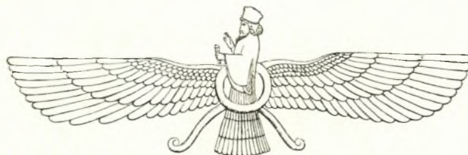
Εἰκ. 8. Ὁ θεὸς Ἥλιος τῶν Ἀσσυρίων (COOK Zeus I σ. 208, εἰκ. 153).

Κιονίσκος . Ὁ ἀπλοῦς ἢ ἀκτινωτὸς δίσκος εἰκονίζεται ἐν τούτοις καὶ ἐπὶ κιονίσκου 7 ( προβ. καὶ εἰκ. 9 ) (ὅπως περίπου τὰ ἑξαπτέρυγα τῆς ἡμετέρας ἐκκλησίας ἐπὶ τῆς Ἁγ.