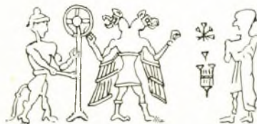
Εἰκ. 14. Πινακίς ἐκ Kerkouk ἐν Λούβρω.

Προφανῶς ἐκπροσωπεῖ ἀνώτερόν τι ἀξίωμα Μάγου-ιερέως; 2 , καὶ κατὰ πᾶσαν