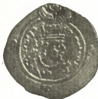
Εἰκ. 11. Νόμισμα τοῦ Χοσρόου τοῦ II. Συλλ. Christensen (CHRISTENSEN σ. 446, εἰκ. 42).

Εἰς τὰ εἰκονικὰ μνημεῖα τῆς ἀρχαίας Μεσοποταμίας ἱερεῖς ἢ προσκυνηταὶ τοῦ συμβόλου ἴστανται μετὰ σεβασμοῦ καὶ τῆς ἰδιαζούσης εἰς τὰ μνημεῖα τῆς Μεσοποταμίας χειρονομίας τῆς λατρείας εἰς ἀπόστασιν τινα ἀπὸ τούτου 3 , ὁσάκις δὲ ἔρχονται εἰς συνάφειάν τινα μετὰ τοῦ ἡλιακοῦ συμβόλου ἢ κρατοῦσι τὸν στηριζόμενον ἐπὶ τῆς γῆς ἡλιοφόρον κίονα 4 (εἰκ. 12) ἢ τὸ ἄκρον τῶν κατερχομένων ἐκ τοῦ δίσκου ἀκτίνων ἐν