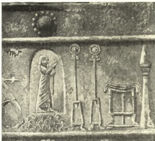
Εἰκ. 9. Πύλαι τοῦ Balawat. Τεμάχιον ἐν τῷ Βρετανικῷ Μουσείῳ.

Ἐξ ἐπιδράσεως ἐκπορευθείσης ἐκ τῆς Μεσοποταμίας ὁ ἥλιακὸς δίσκος ἐδράζεται ἐπὶ κίονος καὶ εἰς Ἴνδικὰ μνημεῖα 1 . Ἐπὶ κίονος στηρίζεται καὶ ὁ δίστομος πέλεκυς ἱερώτατον σύμβολον τῆς Μινωϊκῆς θρησκείας, σύμβολον τοῦ κεραυνοῦ καὶ τοῦ ἡλίου 2 .