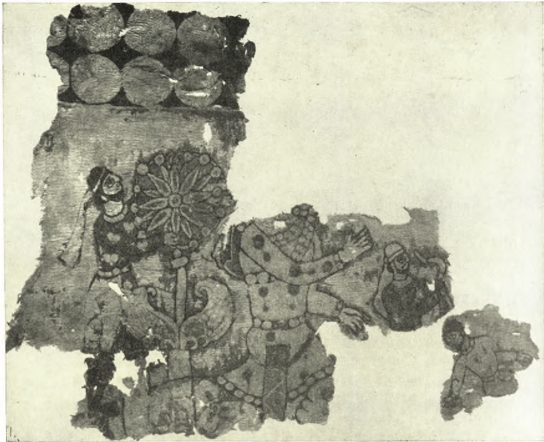
Εἰκ. 1. Μιθραϊκὴ πομπὴ ἐπὶ ὑφάσματος ἐξ Αἰγύπτου.