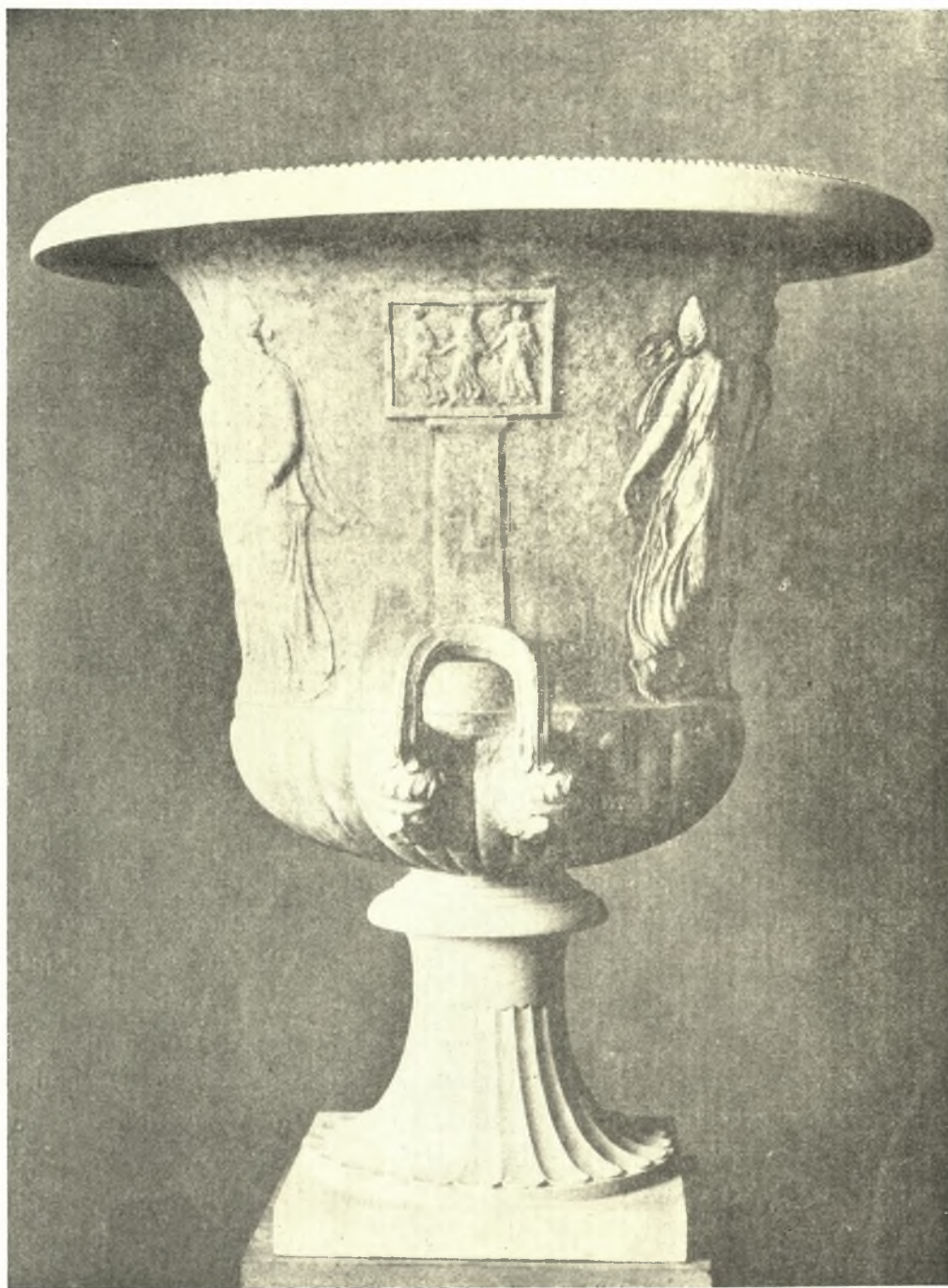
Εἰκ. 8. Νεοαττικὸς κρατὴρ ἐν τῷ Μητροπολιτικῷ Μουσείῳ τῆς Τέχνης τῆς Ν. Ὑόρκης (JHS 45 πίν. VIII).