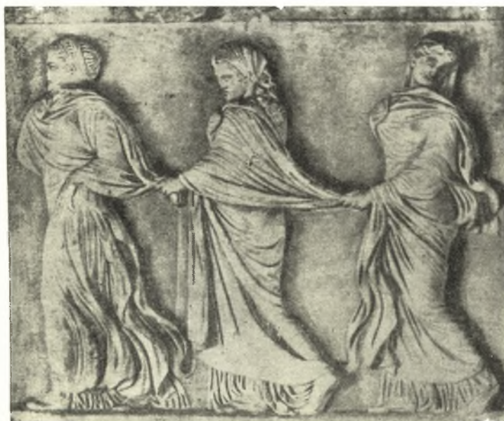
Εἰκ. 7. Τὸ ἐκ Τριπόλεως τῆς Ἀφρικῆς ἀνάγλυφον τῶν Νυμφῶν (BSA III 1896-1897 πίν. XVI).

Αἱ μεμονωμένως ἀποδοθεῖσαι ἐπ' αὐτοῦ Νύμφαι ἀποτελοῦσι πιστότατον ἀντίγρα-