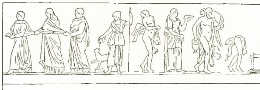
Εἰκ. 6. Ὁ στρογγύλος βωμὸς τῆς Βερῶνης (REINACH R.R. III, 436,1).

ματος καὶ πλέον ἀνεπτυγμένον καὶ τοῦ τῆς δευτέρας μορφῆς, ἧς πάλιν ἡ ἄκρα δεξιὰ χεὶρ εἶναι γυμνὴ καὶ οὐχὶ κάτωθεν τοῦ ἱματίου.