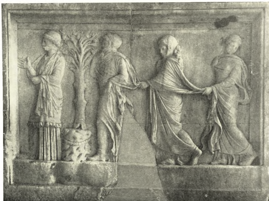
Εἰκ. 1. Ἀνάγλυφον τῶν Νυμφῶν ἐκ τοῦ λιμένος τοῦ Πειραιῶς.

Μεταξὺ τῶν διαφόρων ἄλλων ἀρχαίων, ἅτινα μετὰ τῶν σχετικῶν πρὸς τὴν ἐπὶ τῆς ἀσπίδος τῆς Φειδιακῆς Παρθένου ἀπεικονισθεῖσαν Ἀμαζονομαχίαν πινάκων (Φ. ΣΤΑΥΡΟΠΟΥΛΛΟΥ Ἡ ἀσπίς τῆς Ἀθηνᾶς Παρθένου τοῦ Φειδίου) ἀνειλκυσθήσαν πρὸ εἰκο-