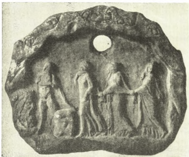
Εἰκ. 4. Τὸ τῆς Ἐλευσίνος ἀνάγλυφον τῶν Νυμφῶν (BCH 1881 πίν. 7).

Οὐδεὶς δύνатаι νὰ ἀρνηθῇ ὅτι αἱ Νύμφαι π.χ. τοῦ ἀναγλύφου τῆς Σπάρτης (ΣΒΟΡΩΝΟΥ Ἔθν. Ἀρχ. Μουσείον ἀριθ. 1449 πίν. LXXVI), αἱ ἀντιστρόφως κινού-