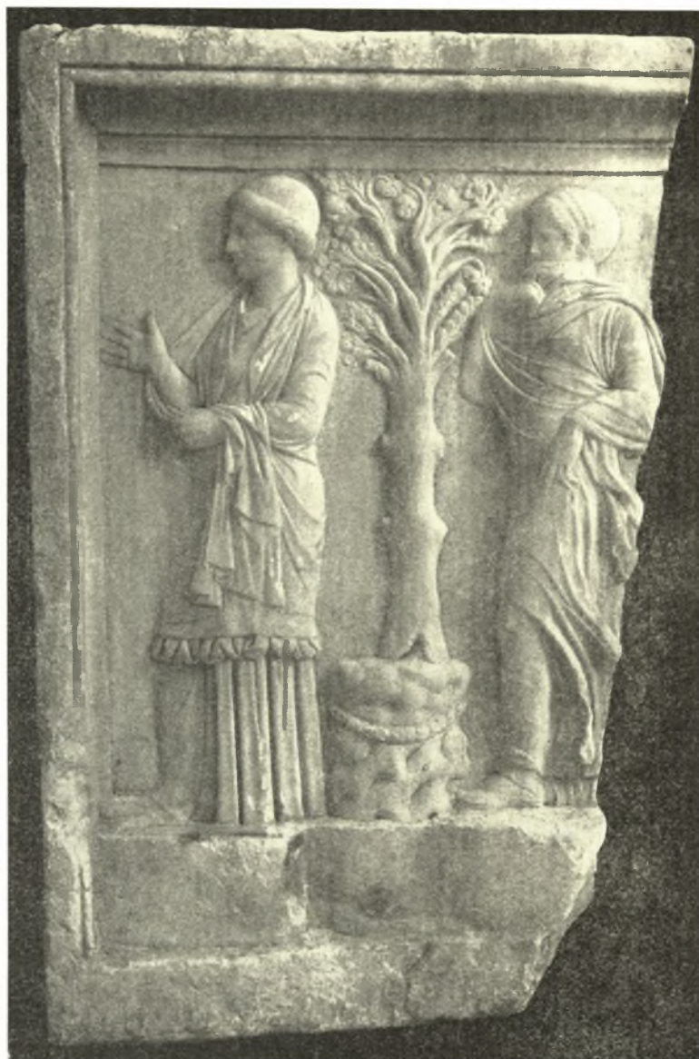
Εἰκ. 1α. Τὸ δεξιὸν ἥμισυ τοῦ ἀναγλύφου εἰκ. 1.

Πρόκειται περὶ ὀρθογωνίου πλακὸς ἐκ πεντελησίου μαρμάρου οὐχὶ καλῆς ποιότητος, προερχομένου δὲ ἐκ τοῦ λατομείου τῆς «Σπηλιᾶς», συγκεκολλημένης ἐκ δύο