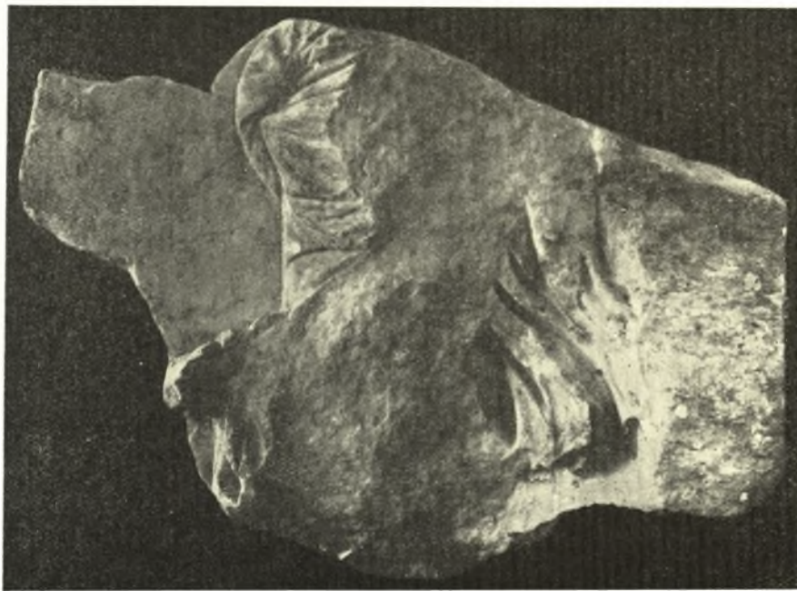
Εἰκ. 2. Τεμάχιον ἀναγλύφου τῶν Νυμφῶν ἐκ τοῦ λιμένος τοῦ Πειραιῶς.

Διὰ τὴν παρατηρουμένην καμπύλην ἐπὶ τοῦ κάτω πλατέος πλαισίου φρονοῦμεν