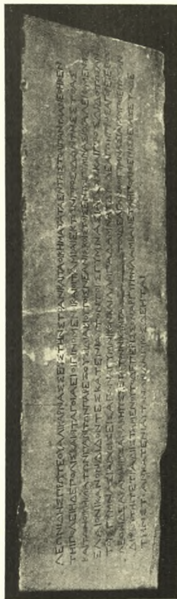
Εἰκ. 2 Ἐπιγραφή ἐκ Φαρσάλων ἀναθηματικὴ στοᾶς καὶ ἀγώνων. (Μουσεῖον Ἀλμυρῶν).

ΛΕΩΝΙΔΗΣ ΠΡΩΤΕΥΑΛΙΚΑΡΝΑΣΣΕΥΣ ΤΗΣ ΤΟΑΝΚΑΙ ΤΑ ΟΙΚΗΜΑΤΑ ΤΑ ΕΝ ΤΗΣ ΤΟΑΙ ΓΑΝΤΑΝΕΘΗΚΕΝ ΤΗ ΓΟΛΕΙ Η ΔΕ ΓΟΛΙΣ ΚΑΙ ΟΙ ΤΑ ΓΟΙ ΑΕΙ ΟΙ ΓΙΝΟΜΕΝΟΙ ΚΑΙ ΟΙ ΤΑ ΜΙΑΙ ΕΚ ΤΩΝ ΓΡΟΣΟΔΩΝ ΤΗΣ ΣΤΟΑΣ ΚΑΙ ΤΩΝ ΟΙΚΗΜΑΤΩΝ ΓΑΝΤΩΝ ΓΑΡ ΕΞΟΥΣΙ ΔΙΑΒΙΟΥΤΟΙ ΣΕΝΕΑΝΙΣ ΚΟΙΣ ΤΟΙΣ ΕΝ ΤΩ ΓΥΜΝΑΣΙΩ ΙΑΛΕΙΦΟΜΕΝΟΙΣ ΕΛΛΙΟΝΙΚΑΝ ΟΝ ΔΙΔΟΝΤΕΣ ΚΑΤΕΝΙΑΥΤΟΝ ΤΟΙΣ ΓΥΜΝΑΣΙΑΡΧΟΙΣ ΚΑΙ ΓΡΟΣ ΔΙΔΟΤΩΣ ΑΝ 5 ΤΟΙΣ ΓΥΜΝΑΣΙΑΡΧΟΙΣ ΕΙΣ ΑΓΩΝΑ ΓΥΜΝΙΚΟΝ ΚΑΙ ΛΑΜΠΑΔΑ ΜΝΑΣ ΔΥΟ ΟΔΕ ΑΓΩΝ ΓΡΟΣ ΑΓΟΡΕΥΕΣΘΩ ΛΕΩΝΙΔΕΙΑ ΚΑΙ ΟΚΗΡΥΞΑΝ ΚΗΡΥΣΣΕΤΩ ΤΟΝ ΝΙΚΩΝΤΑ [ ] ΤΟΝ ΔΕ ΑΓΩΝΑ ΟΙ ΓΥΜΝΑΣΙΑΡΧΟΙ ΟΙ ΕΙΤΩΣΑΝ ΔΙΨΙΟΥ ΤΗ ΤΕ ΤΡΑΔΙΙΣ ΤΑ ΜΕΝΟΥΤΟ ΔΕ ΠΕΡΙΣΣΟΝ ΑΡΓΥΡΙΟΝ ΛΑΜΒΑΝΕΤΩ Η ΠΟΛΙΣ ΕΠΙΣΚΕΥΑΙ ΕΤΩ ΔΕ ΤΗΣ ΤΟΑΝΚΑΤΕΝΙΑΥΤΟΝ ΩΝΑΝ ΓΡΟΣ ΔΕ ΗΤΑΙ