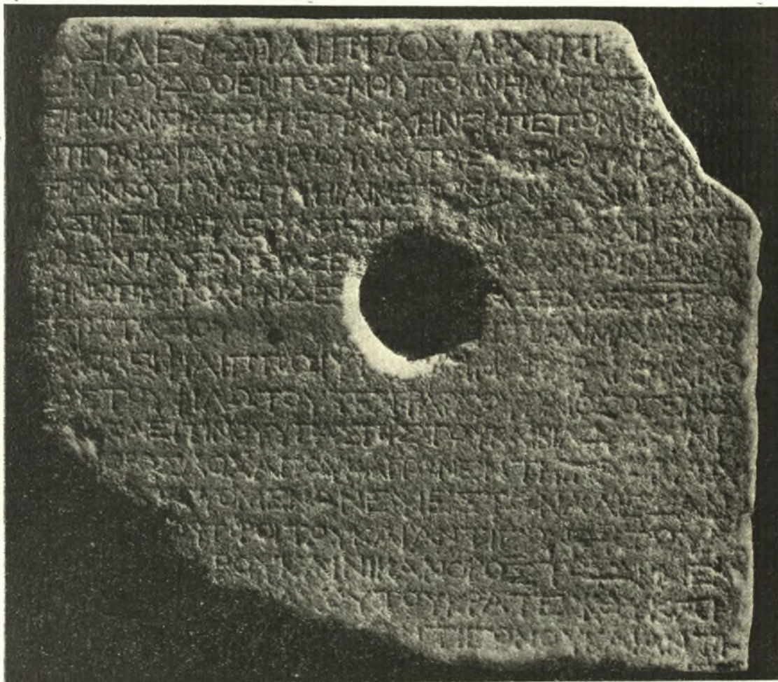
Εἰκ. 1. Ἐπιστολή Φιλίππου τοῦ Ε΄ πρὸς [ἐπιστάτην] Ἄρχιππον.

1. Τὸ ἐν τῇ εἰκ. 1 δημοσιευόμενον τμήμα στήλης ἐνεπιγράφου ἀνευρέθη τὸ ἔτος 1931 κατὰ τὸ χωρίον Κοιλάδα (πρῶην Ἰσκιουπλέρ), κείμενον πρὸς τοὺς βορείους πρόποδας τοῦ