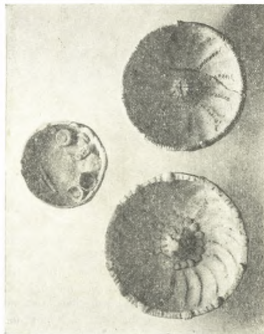
Εἰκ. 21. Ἄγγεῖα λατρευτικοῦ χαρακτήρος. Δεξιὰ φιάλαι, ἀριστερὰ δίσκος, ἐντὸς τοῦ ὁποίου παρίστανται φιάλαι καὶ «πόπανα».

Ὁ τάφος ἐγένετο γνωστός ἐκ καταπτώσεως τῆς κορυφῆς τοῦ θαλάμου του. Ὅπως οἱ λοιποὶ ἐν τῇ προκειμένῃ θέσει, ἦτο καὶ ὁ παρὼν λαξευμένος ἐντὸς τοῦ μαλακοῦ βράχου, εἶχε δὲ τὴν εἴσοδόν του πρὸς Ν. Ὁ δρόμος εἶχε μῆκος 11.80 μ. καὶ πλάτος 0.80 μ. πρὸς τὴν ἔξοδον καὶ