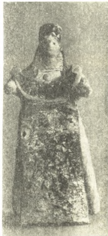
Εἰκ. 19. Ἀρχαῖον πήλινον εἰδώλιον καθημένης θεότητος.

πλευρὰν ἦσαν τελείως συλημένοι. Εἰς τὸν εὐρισκόμενον εἰς τὴν ἀνατολικὴν πλευρὰν διετηροῦντο τέσσαρες κατὰ σειρὰν σκελετοί, ἀλλ' ἄνευ οὐδενὸς κτερίσματος. Ὁ τέταρτος τάφος, ὅστις ἔκειτο κατὰ τὴν δυτικὴν πλευρὰν καὶ τοῦ ὁποίου τὴν εἴσοδον ἐσχημάτιζε μικρὸν φρεατόσχημον στόμιον πρὸς Α., διετῆρει δύο σκελετοὺς ἐντὸς λα-