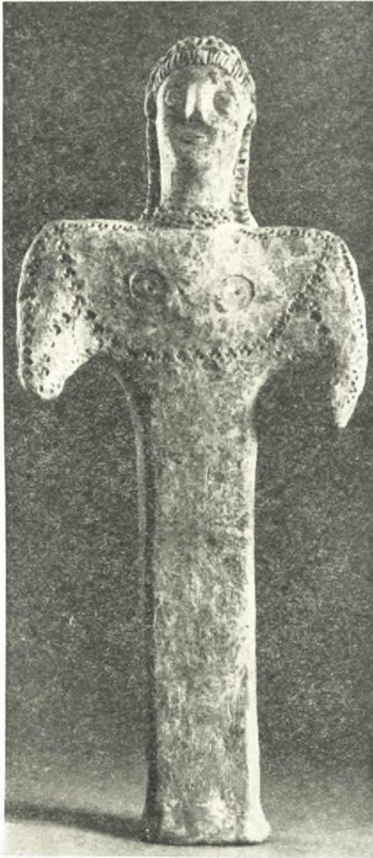
Εἰκ. 17. Πήλινον εἰδώλιον θεᾶς, πιθανώτατα Ἥρας, τῶν ἀρχῶν τοῦ 7 ου π.Χ. αἰῶνος.

μικρὸς τετράγωνος παιδικὸς τάφος (0.40×0.40μ.) ἐπενδεδυμένος δι' ὀρθίων πλακῶν. Ἐντὸς τοῦ