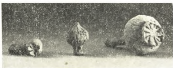
Εἰκ. 20. Διάφορα ἀφιερώματα προσιδιάζοντα εἰς τὴν λατρείαν τῆς Ἑρας.

ποίων διετηροῦντο οἱ σκελετοὶ τῶν νεκρῶν ἄνευ κτερισμάτων. Οἱ νεκροὶ ἦσαν τοποθετημένοι κάτωθεν ὀρθογωνίου κόγχης λαξευμένης κατὰ μῆκος μιᾶς τῶν μακρῶν πλευρῶν τοῦ τάφου (εἶδος ἄρκοσολίων) καὶ ἔβλεπον πρὸς Α. Ἡ τοιαύτη μορφή αὐτῶν καὶ ἡ θέσις τῶν νεκρῶν ὀδηγοῦσι μᾶλλον εἰς τοὺς πρώτους χριστιανικοὺς χρόνους.