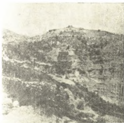
Εἰκ. 22. Ἡ ἀκρόπολις τῆς Αἰγείρας. Ἐμπροσθεν ἡ θέσις τῆς ἀνασκαφῆς.

Ὁ θάλαμος εἶχε σχῆμα ἑλλειψοειδές: μέγιστον μήκος αὐτοῦ 3.10 μ., μέγιστον πλάτος 3.80 μ. Εἰς τὸ μέσον αὐτοῦ εὐρίσκετο στενομῆκης λάκκος, ὅστις περιεῖχεν ὀλίγα ἀγγεῖα τῆς ΥΕ II περιόδου καὶ ἐλάχιστα ὀστᾶ ἀνθρωπίνου σκελετοῦ. Ἄλλα ἀνθρώπινα ὀστᾶ ἔκριντο ἐν ἀταξίᾳ παρὰ τὰ τοιχώματα τοῦ θαλάμου, οὐδεὶς ὁμως κανονικὸς σκελετὸς εὐρέθη ἐν αὐτῷ. Φαίνεται ἐπομένως ὅτι μετὰ τὸν τελευταῖον παραμερισμὸν τῶν παλαιότερων νεκρῶν ἐγκατελείφθη