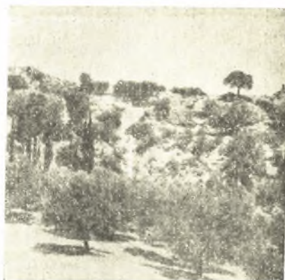
Εἰκ. 23. Ἡ χαράδρα, παρὰ τὸ χεῖλος τῆς ὁποίας (εἰς ὁ σημεῖον ἴστανται οἱ ἐργάται) ἔκριντο οἱ δύο ἀποκαλυφθέντες τάφοι.

γώνου: μήκος 4.30 μ., πλάτος 4.08 μ. πρὸς τὸ στόμιον καὶ 2.70 μ. εἰς τὸ βάθος. Ἐντὸς τοῦ δαπέδου καὶ εἰς τὰς σχηματιζομένας πρὸς τὰ τοιχώματα ὑπὸ τύπον θρανίων προεξοχὰς ἦσαν λαξευμένοι 14 ἐν εἴδει θηκῶν τάφοι, δύο δὲ ἄλλοι ὅμοιοι εὐρίσκοντο εἰς τὸν δρόμον παρ' ἐκατέραν τῶν πλευρῶν αὐτοῦ (εἰκ. 24).