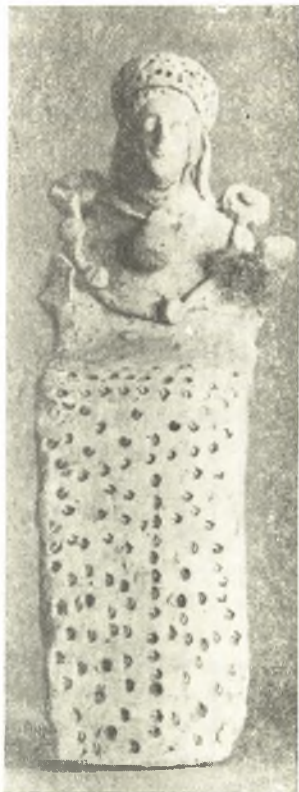
Εἰκ. 18. Ἀρχαῖον πήλινον εἰδώλιον καθημένης θεότητος.

Ὁ χρησιμεύσας ὡς τόπος ἀποθέσεως τῶν ἀφιερωμάτων τοῦ ἱεροῦ ἀπετέλει τὸν θάλαμον μικροῦ μυκηναϊκοῦ τάφου, τοῦ ὁποίου τὸ στό-