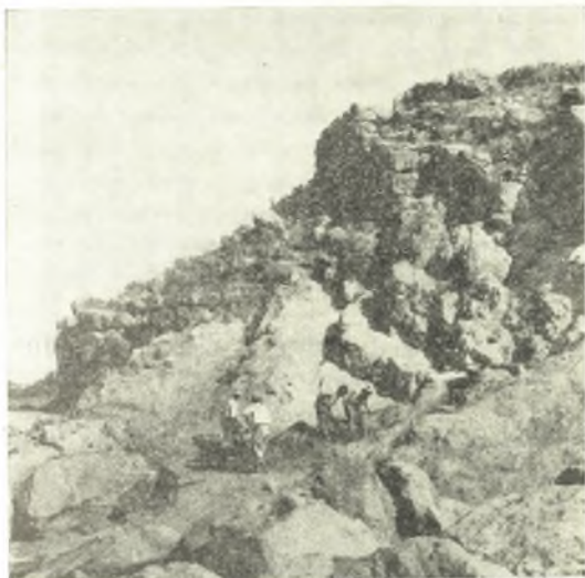
Εἰκ. 7. Ἡ δυτικὴ πυλὶς τῆς ἀκροπόλεως καὶ δεξιὰ αὐτῆς ἡ θέσις τῆς ἀνασκαφῆς.

Τὴν ἀνασκαφὴν προεκάλεσεν ἡ ὑπὸ τῆς Διευ- θύνσεως Ἀναστηλώσεως τοῦ Ὑπουργείου Παι- δείας ἐνεργουμένη ἐκκαθάρισις μέχρι τοῦ φυ- σικοῦ βράχου τῶν πρὸ τοῦ τείχους ἐπιχώσεως,