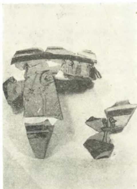
Εἰκ. 11. Ἡ ὀπισθία ὄψις τοῦ κρατῆρος τῆς εἰκ. 10.

περίπου ὅσον καὶ τὸ προηγούμενον, συνίστατο ἐκ τεφρομελαίνης γῆς, τὰ ἐν αὐτῷ δὲ εὐρήματα ἦσαν ὅμοια καὶ σύγχρονα πρὸς τὰ τοῦ προηγούμενου. Ὁ σχηματισμὸς τοῦ προκειμένου στρώματος ὀφείλεται πιθανώτατα εἰς προηγηθεῖσαν μερικὴν καταστροφὴν ἐκ τυχαίας πυρκαϊᾶς ὀλίγον ἐνωρίτερον τῆς ἐκ τῆς ἐχθρικής