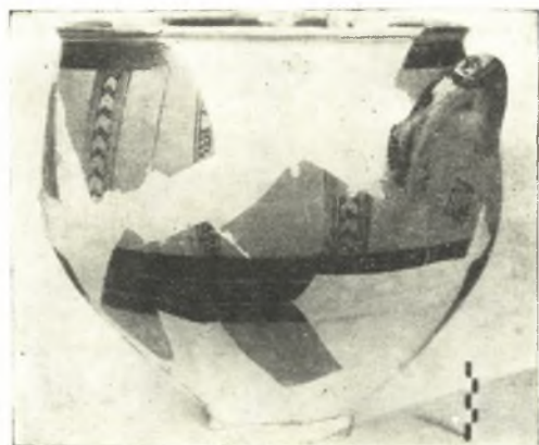
Εἰκ. 9. Εὐμεγέθης μυκηναϊκὸς κρατῆρ.

Τὸ ἀκολουθοῦν στρώμα ἐκ κιτρινωπῆς γῆς, πάχους 0.40 μ. περίπου, περιείχεν ὡσαύτως πολλὰ θραύσματα ἀγγείων καὶ τεμάχια τοιχογραφιῶν