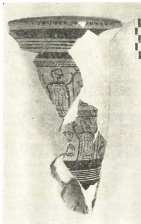
Εἰκ. 12. Τμήμα ρυτοῦ.

προσβολῆς ἐπελθούσης ὀριστικῆς κατὰ τὸ τέλος τοῦ 13ου αἰ.