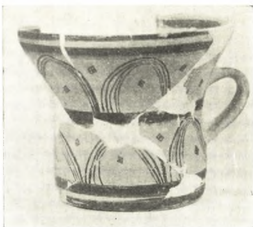
Εἰκ. 15. Ποτήριον.

τοῦ ἐποίκιλθεν ἀναλόγως τῆς διαμορφώσεως τοῦ