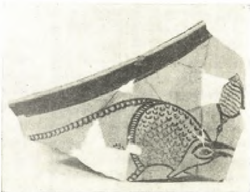
Εἰκ. 14. Μικρὸν τμήμα κρατήρος.

τὸ δεύτερον, ἐκ κιτρινωπῆς γῆς. Τὸ πάχος αὐ-