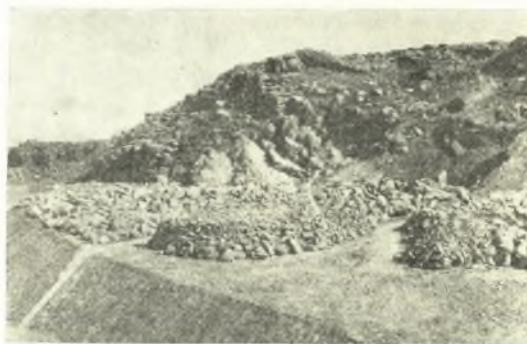
Εἰκ. 8. Τὰ ὑπερθεν τοῦ σημείου τῆς ἀνασκαφῆς ἴχνη πυρπολημένων κτισμάτων. Δεξιὰ ἡ ἐπίχωσις ἐκ τῶν ἀπορριμμάτων τῆς ἀνασκαφῆς τοῦ Schliemann.

Τὸ ὑψηλότερον στρώμα, πάχους 0.80 μ., συν- ίστατο ἐξ ἰσχυρῶς κεκαυμένης γῆς, τῆς ὁποίας τὸ βαθὺ μέλαν χρῶμα ἐπέτεινε ἡ συνύπαρξις μεγάλων τεμαχίων ἀπηνθρακωμένων ξυλίνων δοκῶν. Ἡ ἄμεσος ἐπαφὴ τῶν τελευταίων πρὸς