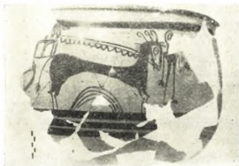
Εἰκ. 10. Τμήμα μυκηναϊκοῦ κρατῆρος.

περίπου ὅσον καὶ τὸ προηγούμενον, συνίστατο ἐκ τεφρομελαίνης γῆς, τὰ ἐν αὐτῷ δὲ εὐρήματα ἦσαν ὅμοια καὶ σύγχρονα πρὸς τὰ τοῦ προηγούμενου. Ὁ σχηματισμὸς τοῦ προκειμένου στρώματος ὀφείλεται πιθανώτατα εἰς προηγηθεῖσαν μερικὴν καταστροφὴν ἐκ τυχαίας πυρκαϊᾶς ὀλίγον ἐνωρίτερον τῆς ἐκ τῆς ἐχθρικής