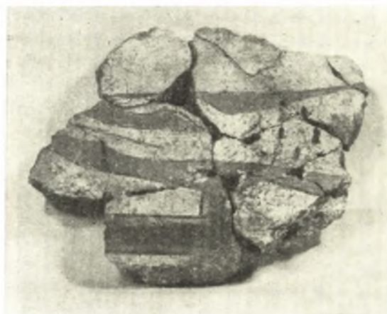
Εἰκ. 16. Τεμάχια τοιχογραφιῶν ἐκ τοῦ συγκεντρωθέντος μεγάλου ἀριθμοῦ ὁμοίων.

τινὰ τῶν ὁποίων ἐκ τῆς προχείρου ἐξετάσεώς των φαίνεται ὅτι ἀνέρχονται καὶ πέραν τῆς ΥΕ ΠΙΒ περιόδου.