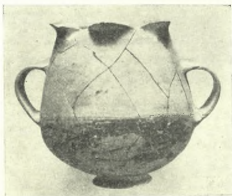
Εἰκ. 6. Ἐν ἐκ τῶν πολλῶν ἀγγείων, αἵτινα εὐρέθησαν μεταξὺ τῶν ἀποκαλυφθέντων γεωμετρικῶν τάφων. Τὸ ἀπεικονιζόμενον εὐρέθη εἰς τὸν τάφον XX καὶ ἀνήκει ἴσως εἰς παλαιότερους χρόνους.

Μεταξὺ τῶν τάφων εὐρέθησαν πρὸς τὸ βορειότερον τμήμα τοῦ ἀνασκαφέντος χώρου θεμέλια μυκηναϊκῶν οἰκιῶν. Ἡ πρώτη καταστροφή τούτων χρονολογεῖται, ἐπὶ τῇ βάσει τῶν συγκεντρωθέντων κεραμικῶν ὄστράκων, κατὰ τὸ τέ-