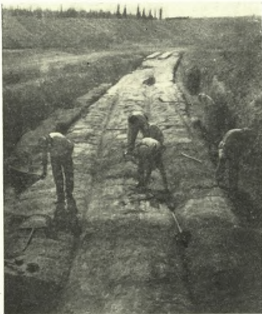
Εἰκ. 1. Τὸ ἀποκαλυφθὲν κατὰ τὴν ἀνασκαφὴν τοῦ 1956 τμήμα τοῦ δίορκου ἐντὸς τοῦ χώρου τῆς Σχολῆς Μηχανικοῦ ὁρώμενον ἐκ Δ.

Σχολῆς, σχηματίζει καὶ ἐνταῦθα ὁ δίορκος ἀπότομον στροφὴν. Ὅμοίαν στροφὴν ἐσχημάτιζε καὶ εἰς τὸ ἀποκοπὲν ὑπὸ τῆς διώρυγος τμήμα. Τοιαῦται στροφαί, αἵτινες ἦσαν ἀπαραίτητοι πρὸς ἐξουδετέρωσιν τῆς ὑψομετρικῆς διαφορᾶς τοῦ ἐδάφους, πρέπει ἀσφαλῶς νὰ ἐπαναλαμβάνονται καὶ περαιτέρω πρὸς Α. μέχρι τῆς εἰς τὸν Σαρωνικὸν καταλήξεώς του.