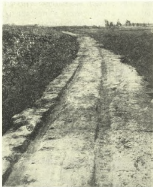
Εἰκ. 2. Τὸ σύνολον τοῦ ἀποκαλυφθέντος τμήματος τοῦ δίορκου ἐξ Α.

Τὰ ἀνωτέρω γράμματα, ὅπως καὶ τὰ σημειωθέντα πέρυσι παραπλευρῶς τῶν προσθέντων θεμελίων, ἐχρησίμευον ἀναμφιβόλως ὡς ὀδηγητικὰ σήματα, ἀνήκουσι δέ, ὅπως καὶ ἐκεῖνα, εἰς τὸ ἀρχαιότερον τοπικόν (κορινθιακοσικωνόν) ἀλφάβητον. Ἐπιβεβαιοῦται δὲ τοιουτοτρόπως καὶ ἐξ αὐτῶν ἡ καθορισθεῖσα