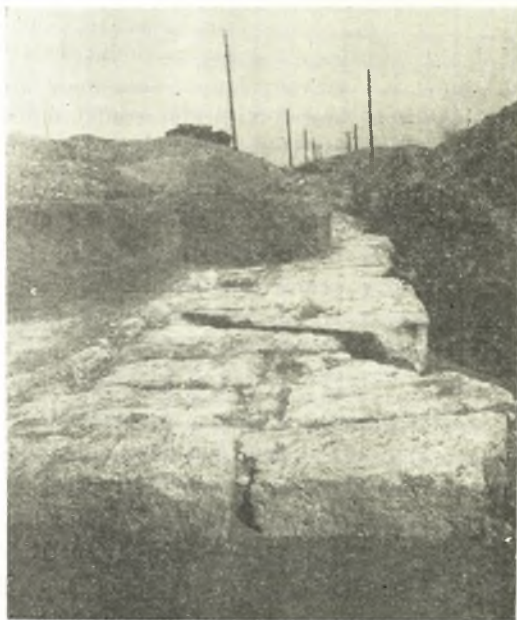
Εἰκ. 4. Τομὴ ἐπὶ τῆς πλευρᾶς τῆς Πελοποννήσου, δυτικῶς τῆς πρὸς τὸ πορθμεῖον ἀγοῦσης ὁδοῦ.

διόλκου ἔμπροσθεν τῆς θέσεως τοῦ σηματοῦρου οἱ ἐργάται τῆς ἰδίας ὡς ἄνω Ἑταιρείας εἶχον