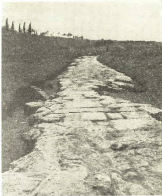
Εἰκ. 3. Τὸ ἄνευ αὐλακώσεων τμήμα τοῦ διόλκου, ἐπὶ τοῦ ὁποίου ἐξετείνοντο τὰ πρόσθετα ἐπὶ τοῦ πλακοστρώτου θεμέλια.

τοῦ ἐδάφους τμήμα τῆς δυτικῆς ἀφετηρίας τοῦ