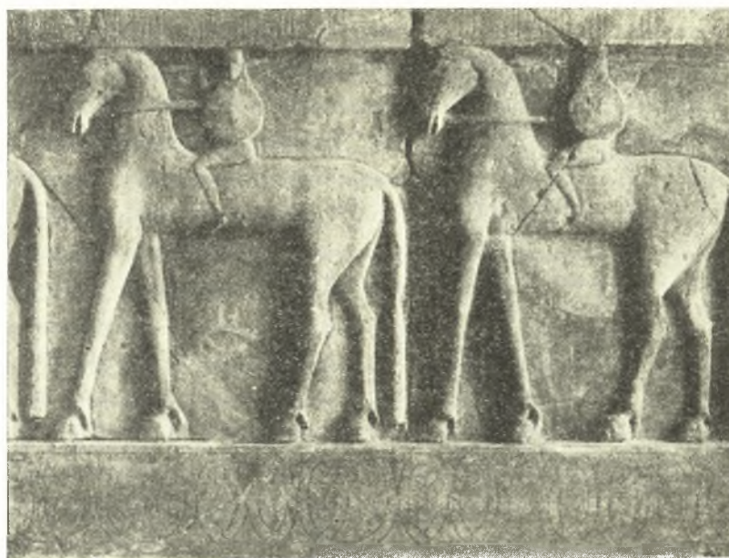
Εἰκ. 4. Τμήμα ζωφόρου ἐκ Πριναῖ Κρήτης.

Ἐπιδρομεῖς, εἰς ἐξυπακουομένην σειρὰν ἀρματοδρομοῦντων πολεμιστῶν, ἐπέρχονται δεξιόθεν καὶ ἀριστερόθεν τοῦ ναΐσκου, ἐν τῷ ὁποίῳ φυλάσσεται τὸ ἄγαλμα, ἐνῶ οἱ ὑπερασπισταὶ τοῦ ξοάνου ἀποκρούουσιν αὐτούς, βάλλοντες διὰ τόξου ἐναντίον τῶν ἐπερχομένων ἐχθρῶν. Ἡ παράστασις αὕτη ἀπαγωγῆς ἐπὶ ζωφόρου ναοῦ φανερώνει, βεβαίως, σχετικὸν μῦθον ἢ παράδοσιν ἱστορικοῦ γεγονότος περὶ τῆς λατρευομένης ἐν