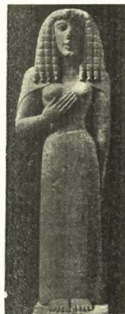
Εἰκ. 2. Ἡ Κόρη τῆς Auxerre.

1) Ἐπὶ τοῦ κρητικῆς τέχνης τῶν μέσων τοῦ ἐβδόμου π.χ. αἰῶνος ἀγάλματος τῆς Auxerre (ἐν τῷ μουσεῖῳ τοῦ Λούβρου) (εἰκ. 2), τὸ ὁποῖον, ἐκτὸς τῆς στρογγυλότητος τοῦ κάτω ἡμίσεος, ἔχει καὶ τὴν αὐτὴν ἀκριβῶς τοποθέτησιν τῶν χειρῶν, τὴν μὲν δεξιὰν ἐπὶ τοῦ στήθους, τὴν δὲ ἀριστερὰν καθειμένην κατὰ μῆκος τοῦ μηροῦ (BUSCHOR, Die Plastik d. Griechen , σ. 17).