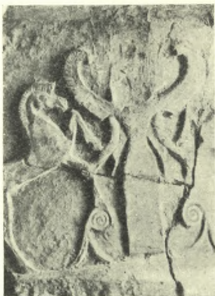
Εἰκ. 3. Πότνια θηρῶν ἐξ ἀναγλύφου πίθου τῆς Κρήτης

α) Ἐπὶ πίθου κεκοσμημένου δι' ἐκτύπου παραστάσεως δύο ἀντωπῶν ἵππων ἰσταμένων ἐκατέρωθεν ἀγάλματος πτερωτῆς θεᾶς (Ποτνιαίας θηρῶν ἢ Ἀρτέμιδος) (εἰκ. 3) ( Annuario I , 1914, σ. 69 εἰκ. 38).