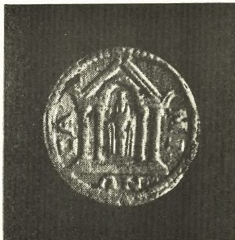
Εἰκ. 5. Νόμισμα τῆς Σάμου.

Ὑπὲρ τῆς ἀπόψεως ταύτης συνηγοροῦν ἡ ἀρχαικότης τῆς ζωφόρου — τῆς ὠρίμου ἀρχαϊκῆς ἐποχῆς, ἣτοι τοῦ τέλους τοῦ 6ου π. Χ. αἰῶνος, καθ' ἣν ἐποχὴν ἐγένετο καὶ ἡ ἐγκατάστασις τῶν Σαμίων ἐν Κυδωνία Κρήτης, — ἡ παράστασις τοῦ ξοανομόρφου ἀγάλματος μὲ τὸν πόλον, ὅπως ἦτο τὸ λατρευτικὸν ἄγαλμα τῆς Σαμίας Ἑρας, ἡ τοποθέτησις του ἐντὸς ναΐσκου (κατὰ τὴν μαρτυρίαν τῶν νομισμάτων τῶν αὐτοκρατορικῶν χρόνων, εἰς 5, ἐπὶ τῶν ὁποίων τὸ ξοανόμορφον ἄγαλμα παρίσταται ἰδρυμένον ἐντὸς ναΐσκου, ἡ δὲ θεὰ εἰκονίζεται ὀρθία ἰσταμένη μὲ κάλαθον ἐπὶ τῆς κεφαλῆς καὶ κρατοῦσα φιάλην εἰς τὰς χεῖράς της ἐξ ἑκατέρας τῶν ὁποίων κρέμανται ἱερὰ ταινία, ὅπως ὅταν τοῦτο ἐκοσμεῖτο κατὰ τὰς ἑορτὰς τῶν Τονέων), ἡ τοποθέτησις του ἐντὸς ναΐσκου καὶ ἐν Σάμῳ καὶ ἐπὶ τῆς ζωφόρου τῆς Κυδωνίας καί, τέλος, τὸ θέμα τῆς ἀπαγωγῆς ἐν τῇ ἐξεικονίσει τῆς ἑορτῆς τῶν Τοναίων.