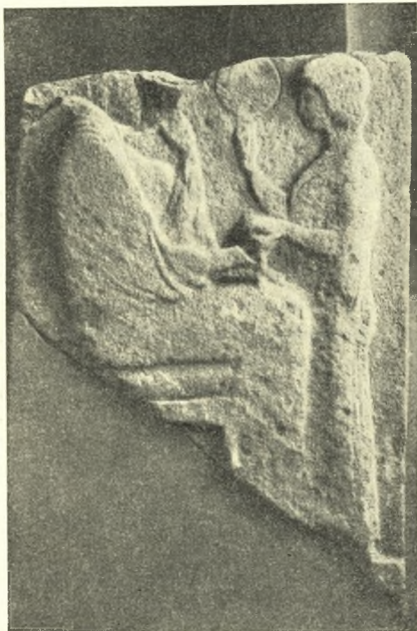
Εἰκ. 1. Ἐπιτυμβία στήλη ἐκ Θράκης.

ἀποτριβῆ ἢ διαβρωθῆ βαθέως, ὥστε οὐδαμοῦ σώζεται ἀνέπαφος ἢ ἀρχικὴ ἐπίδερμις τοῦ ἀναγλύφου (σαφῶς τοῦτο διακρίνεται εἰς τὴν φωτογραφίαν τῆς εἰκ. 2). Τὸ διατηρούμενον μέγιστον ὕψος τῆς στήλης μετρεῖ 0,61 μ., τὸ πλάτος ἄνω 0,452 μ., εἰς τὸ μέσον περίπου (τὸ κατώτατον δηλαδὴ σωζόμενον πλάτος) 0,455 μ., τὸ δὲ πάχος 0,11 μ. περίπου. Ἡ ὀπισθία ἐπιφάνεια τῆς στήλης ἔχει ἀφεθῆ ἀκατέργαστος καὶ ἐμφανίζεται τραχεῖα καὶ ἀνώμαλος.