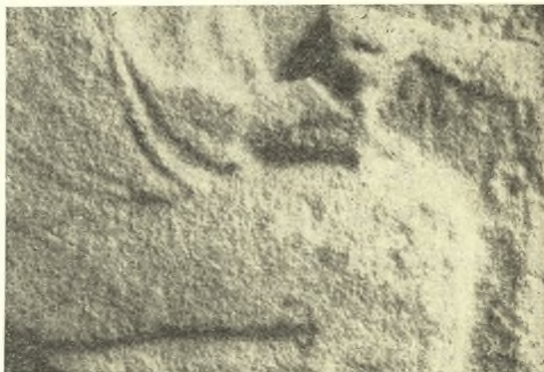
Εἰκ. 2. Λεπτομέρεια τῶν δύο χειρῶν.

Ἡ ὀρθία νέας φέρει χιτῶνα χειριδωτόν (εἰκ. 3). Ἡ κόμη τῆς, βραχεῖα σχετικῶς, πίπτει ἐπὶ τοῦ αὐχένος ὀλίγον ἄνω τῶν ὤμων. Εἰς τὸ ὕψος περίπου τοῦ ὠτὸς ἑλαφρὰ ἔσοχή τῆς κατερχομένης κόμης, ἔχουσα ἀντίστοιχον ἀσθενεστέραν ἐπὶ τῆς κορυφῆς τοῦ κρανίου καὶ εἰς σημεῖον κατὰ τὴν προέκτασιν τῆς καθέτου τῆς προσθίας γραμμῆς τοῦ λαιμοῦ, προκαλεῖται ἐκ ταινίας, ἡ ὁποία συνεκράτει τὴν κόμην, δηλουμένης ἄλλοτε πλαστικῶς ἢ γραπτῶς καὶ ἐξαλειφθείσης νῦν. Κάτω τῆς καμπύλης τοῦ γλουτοῦ καὶ ἀκριβῶς εἰς τὸ σημεῖον, ὅπου ἄρχεται ἡ κάθετος πτώσις τοῦ χιτῶνος, διακρίνεται ἀμυδρῶς ἀσθενῆς