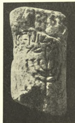
Εἰκ. 2. Ἡ ἐν IG II² 10949 ἐπιγραφή.