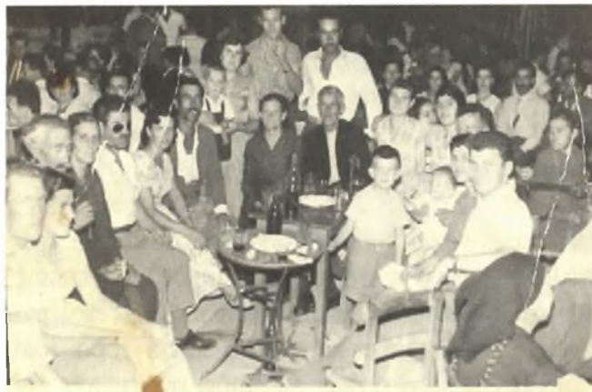
Οι καλεσμένοι στην πλατεία του χωριού