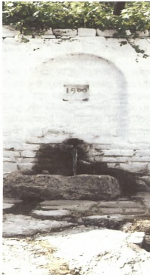
Βρύση στην πλατεία της Ιτιάς

Το όνομα της Ραψάνης πιθανότατα προέρχεται από τη λέξη <<Θραψάνια>>. Έτσι ονομάζονται τα σχιστολιθικά πετρώματα του εδάφους της στην τοπική διάλεκτο. Άλλη μια εκδοχή για την προέλευση του ονόματος είναι ότι προήλθε από τη λέξη <<Ραψιάν>>. Οι γεωργοί των πεδινών τόπων (Καραγκούνηδες), διακρίνουν ανάμεσα στα σιτηρά ένα είδος σίτου που το ονομάζουν <<Ραψιάν>> που ερμηνεύεται: πλατανότοπος επειδή στην περιοχή υπάρχουν πλήθος από πλατάνια σε όλη την εδαφική έκταση της Ραψάνης.