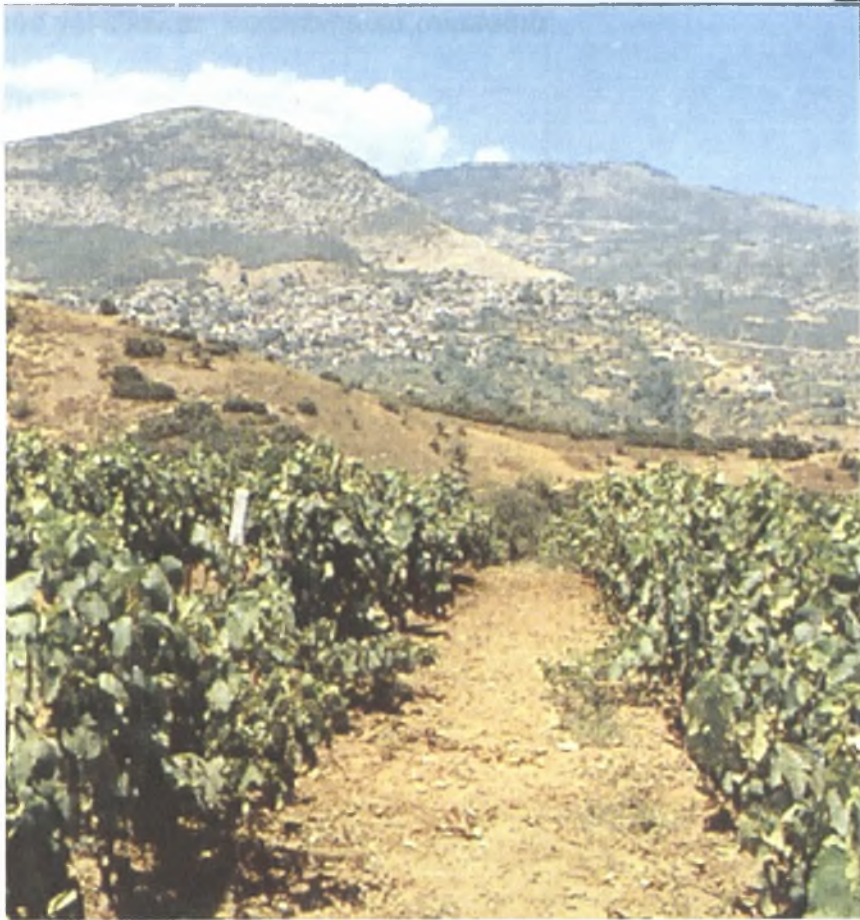
Αμπελώνας (περιοχή Ν.Α του χωριού)