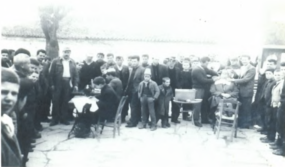
Ξύρισμα του γαμπρού (Εποχής 1950)

Στο σπίτι του γαμπρού μαζεύονταν τα μπρατίμια. Ένας συγγενείς του γαμπρού δίνει από ένα άσπρο μαντήλι στα μπρατίμια για να το βάλουν στη πλάτη. Οι συγγενείς που πήγαιναν στο σπίτι έφερναν μαζί τους και από ένα μπουκάλι κρασί. Όλο το κρασί που θα πιούν στο γάμο το φέρνουν οι καλεσμένοι.