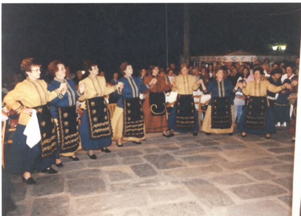
Σημερινή εκδήλωση του «Μορφωτικού Συλλόγου της Ραψάνης» ΓΙΟΡΤΗ ΚΡΑΣΙΟΥ 2003