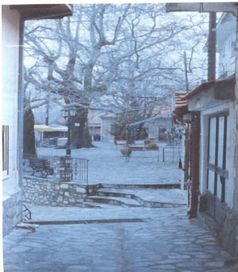
Κεντρική Πλατεία του χωριού Ραψάνη