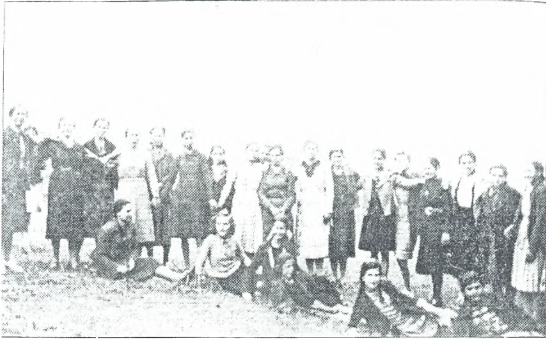
Το νυφοδιάλεγμα (Περιοχή Ίσιωμα)