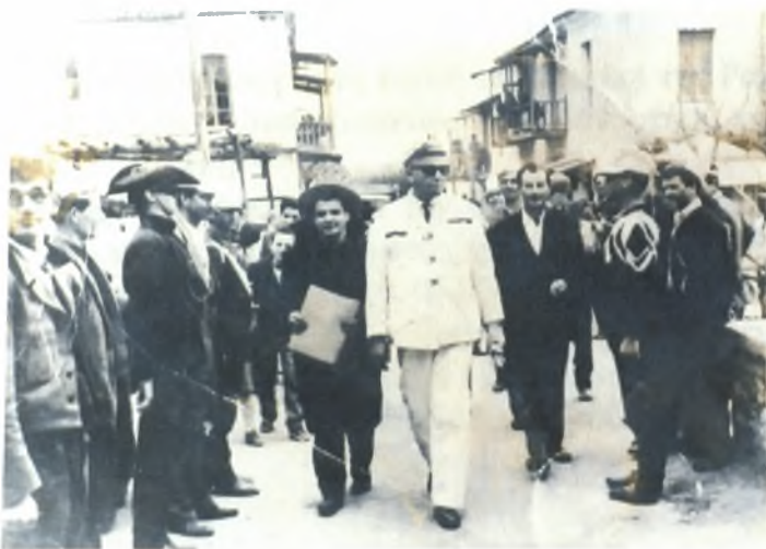
Παραδοσιακό έθιμο «ο βασιλιάς»