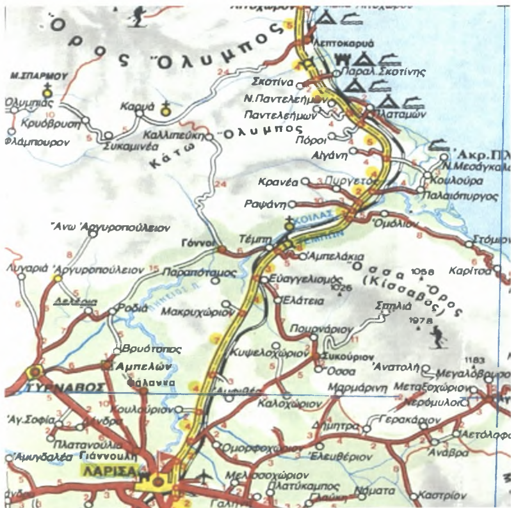
Πολιτικός χάρτης Νομού Λαρίσης (Περιοχή Έρευνας Ραψάνη)

Είναι χτισμένη στην Ν.Α. πλαγιά του Ολύμπου, σε υψόμετρο 500μ πάνω από τη θάλασσα στις πλαγιές του όρους Σαπωτού αγναντεύει το Αιγαίο πέλαγος σε απόσταση μιας ώρας περίπου. Απέναντι από τη Ραψάνη υψώνεται ο Κίσαβος και σε απόσταση μισής ώρας βρίσκεται η κοιλάδα των Τεμπών.