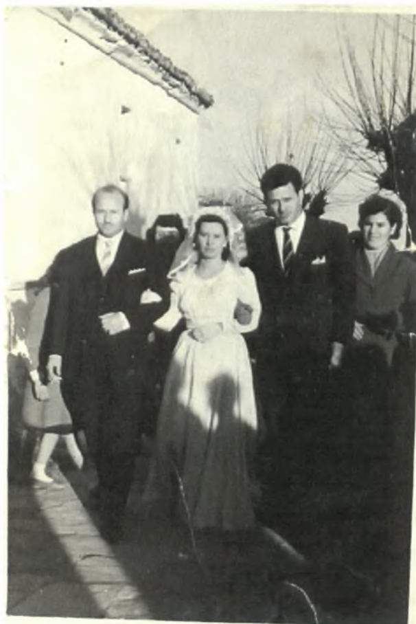
Η νύφη με τα αδέρφια της στην εκκλησία (Εποχής 1950)

Με τα τραγούδια φτάνουν στην εξώπορτα της εκκλησίας, εκεί η μάκου (γριά, γιαγιά) δίνει στη νύφη τρία μήλα που τα ρίχνει πίσω της. Τότε όλοι προσπαθούν να τα πιάσουν για να τους φέρει τύχη. Την ώρα που γίνονται αυτά ο γαμπρός και τα μπρατίμια δίνουν χρήματα στον καντηλανάφτη και ο πατέρας του γαμπρού κερνάει στους άντρες κρασί.