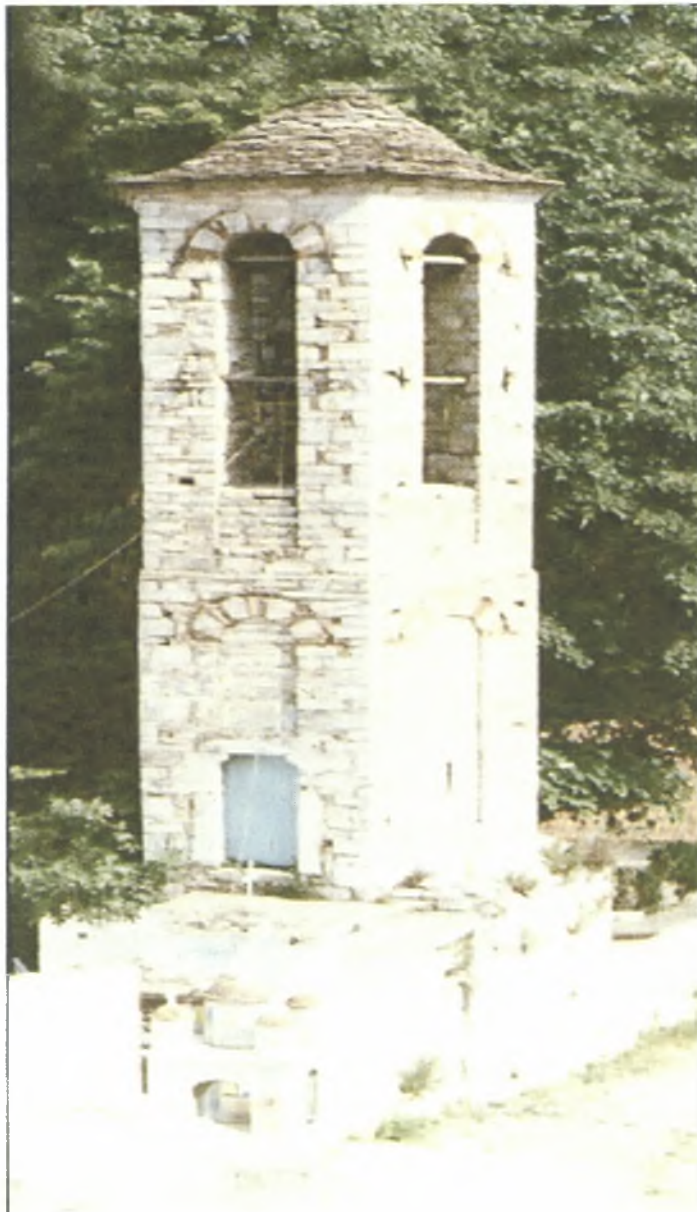
Η εκκλησία του Αγ. Γεωργίου