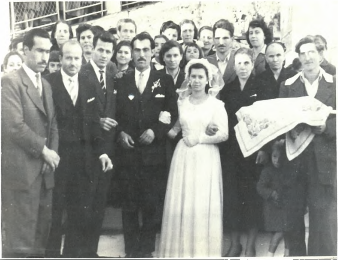
Γάμος στη Ρ Α Ψ Α Ν Η