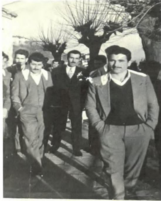
Ο γαμπρός με τα μπρατίμια στην εκκλησία

Μετά την τελετή, πηγαίνουν στην πλατεία όπου η νύφη χορεύει ένα χορό. Μαζεύεται όλο το χωριό όπου όλοι ήταν καλεσμένοι.