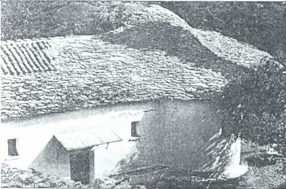
Το μοναστήρι των Αγ. Θεοδώρων το 1950

χορεύουν οι πρωτόγεροι κι οι πρωτοαφεντάδες. Σε άλλη δίπλα νέοι και νιές, οι νεοπαντρεμένοι Και σ' άλλον κύκλο οι λεβεντιές, όλα τα παλληκάρια. Όλες οι κόρες του χωριού κάμνουν χορό δικό τους. Τέλος στο γενικό χορό όλες οι γριές κι οι πεθερές Χορεύουν τον συγκαθιστό και πιο κοντά τον πηδητό. Σαν τελειώσει και αυτός σκορπά το πανηγύρι.