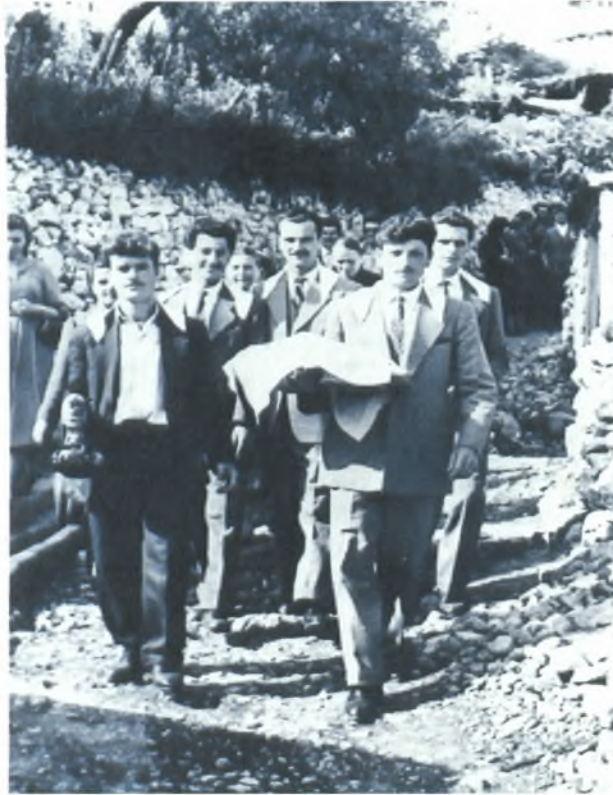
Τα μπρατίμια στο δρόμο για το σπίτι της νύφης (Εποχής 1950)

Αφού φτάσουν βάζουν το παπούτσι στη νύφη η οποία προσποιείται πως δεν χωράει για να πάρει όσα περισσότερα χρήματα μπορεί. Στη συνέχεια οι μπρατίμισες κερνούν στα μπρατίμια λουκούμι και τσίπουρο. Ακολουθεί ένας χορός και η νύφη χαιρετάει το σπίτι και τους γονείς της. Στη εξώπορτα του σπιτιού ο πατέρας γεμίζει τρεις φορές ένα ποτήρι με κρασί και το δίνει στη νύφη. Αυτή το χύνει μία φορά δεξιά, μια φορά αριστερά και την τρίτη μπροστά. Μετά πετάει το ποτήρι πίσω της και το σπάει.