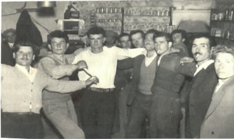
Το γλέντι του γαμπρού (Εποχής 1950)

Όταν έφτανε περίπου μεσάνυχτα ο γαμπρός με τα μπρατίμια πήγαινε στο σπίτι της νύφης και συνέχιζαν το γλέντι εκεί όλοι μαζί. Στο δρόμο τραγουδούσαν: