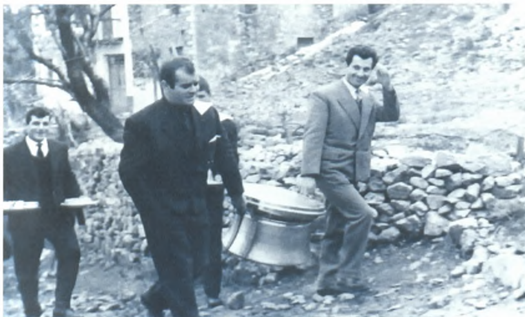
Τα μπακούρια (Εποχής 1935)

Την Παρασκευή τα μπρατίμια φόρτωναν την προίκα στα μουλάρια, τα οποία είχαν στο δεξιό λουρί από το χαλινάρι δεμένο ένα άσπρο μαντήλι. Στο ένα μουλάρι είχαν συνήθως τα μπαούλα και στο άλλο χαλιά, φλοκάτες, προκόβες, υφαντά και κεντημένα μαξιλάρια τα οποία τα καρφίτσωναν με παραμάνες πάνω-πάνω για να φαίνονται και να παινεύουν τη νύφη. Στη συνέχεια έπαιρναν τα <<μπακούρια>> τα οποία ήταν κατσαρόλες, ταψιά και άλλα σκεύη της νύφης και τα χτυπούσαν στο δρόμο για να κάνουν φασαρία και να δημιουργήσουν εορταστική ατμόσφαιρα. Όλοι έβγαιναν στα μπαλκόνια για να θαυμάσουν την προίκα.