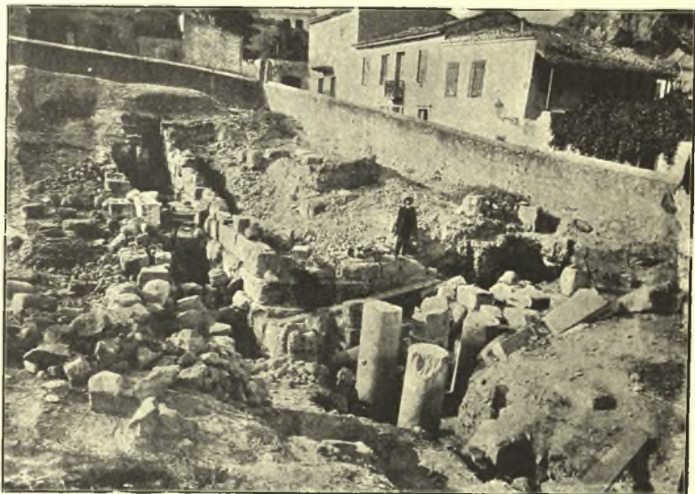
Εἰκ. 1. Ἀνασκαφὴ παρὰ τοὺς Ἁγίους Ἀποστόλους.

Ἡ ἀνασκαφὴ ἡμῶν γενομένη δι' ὑπηρεσιακοὺς λόγους, πρὸς ὑπεράσπισιν τῆς ἰδιοκτησίας τῆς Ἐταιρείας καὶ τοῦ δημοσίου, περιορίσθη κυρίως εἰς τὴν ἐκ νέου ἀποκάλυψιν