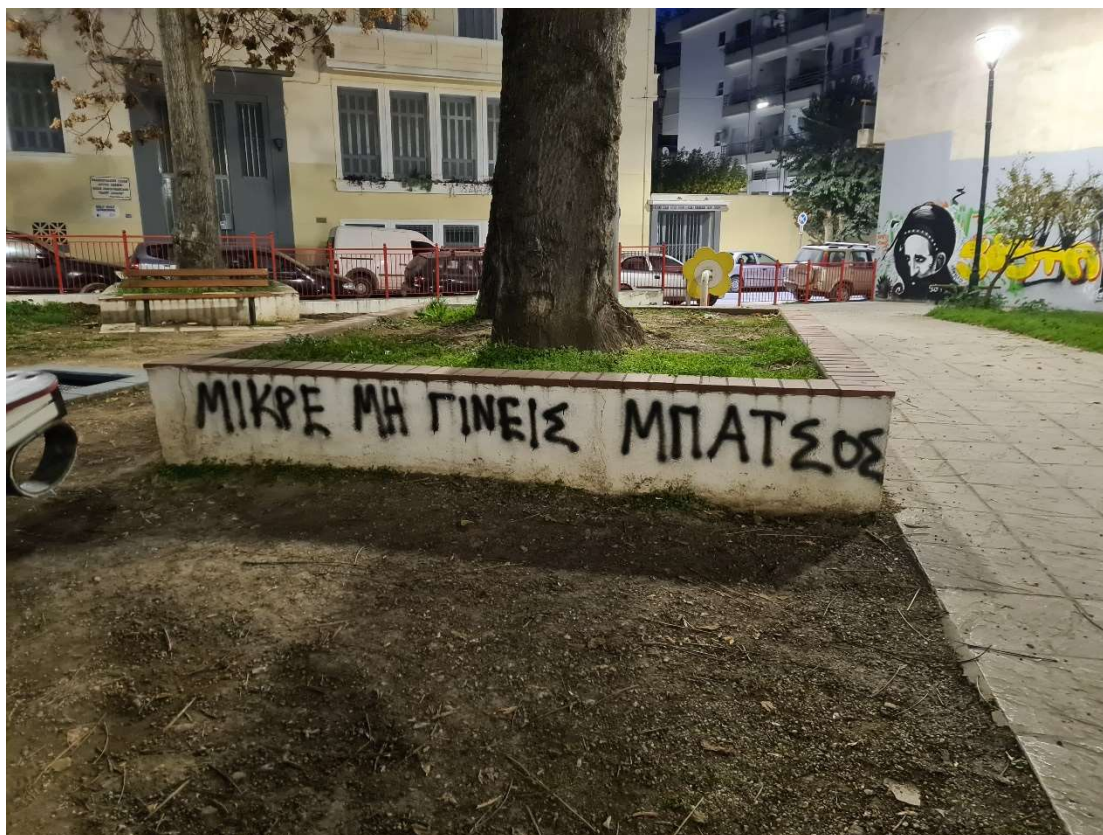
Εικόνα 17. Φωτογραφία από τη παιδική χαρά Ρ. Φερραίου "ΜΙΚΡΕ ΜΗ ΓΙΝΕΙΣ ΜΠΑΤΣΟΣ"