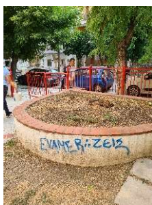
Εικόνα 14. Φωτογραφία απο την παιδική χαρά Ρ. Φερραίου "ΕΥΑΜΕΡ ΖΕΙΣ"