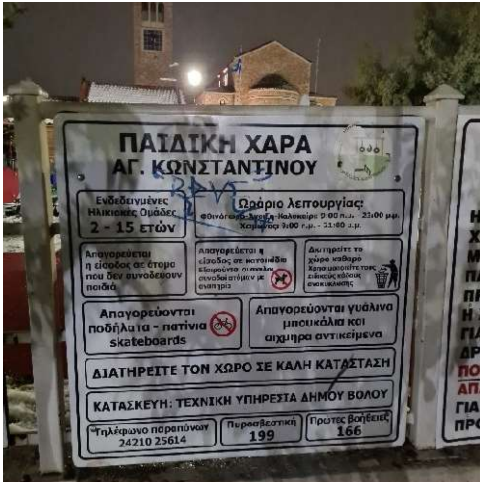
Εικόνα 4. Ρυθμιστική πινακίδα παιδικής χαράς "Αγ. Κωνσταντίνου" 08/02/2023