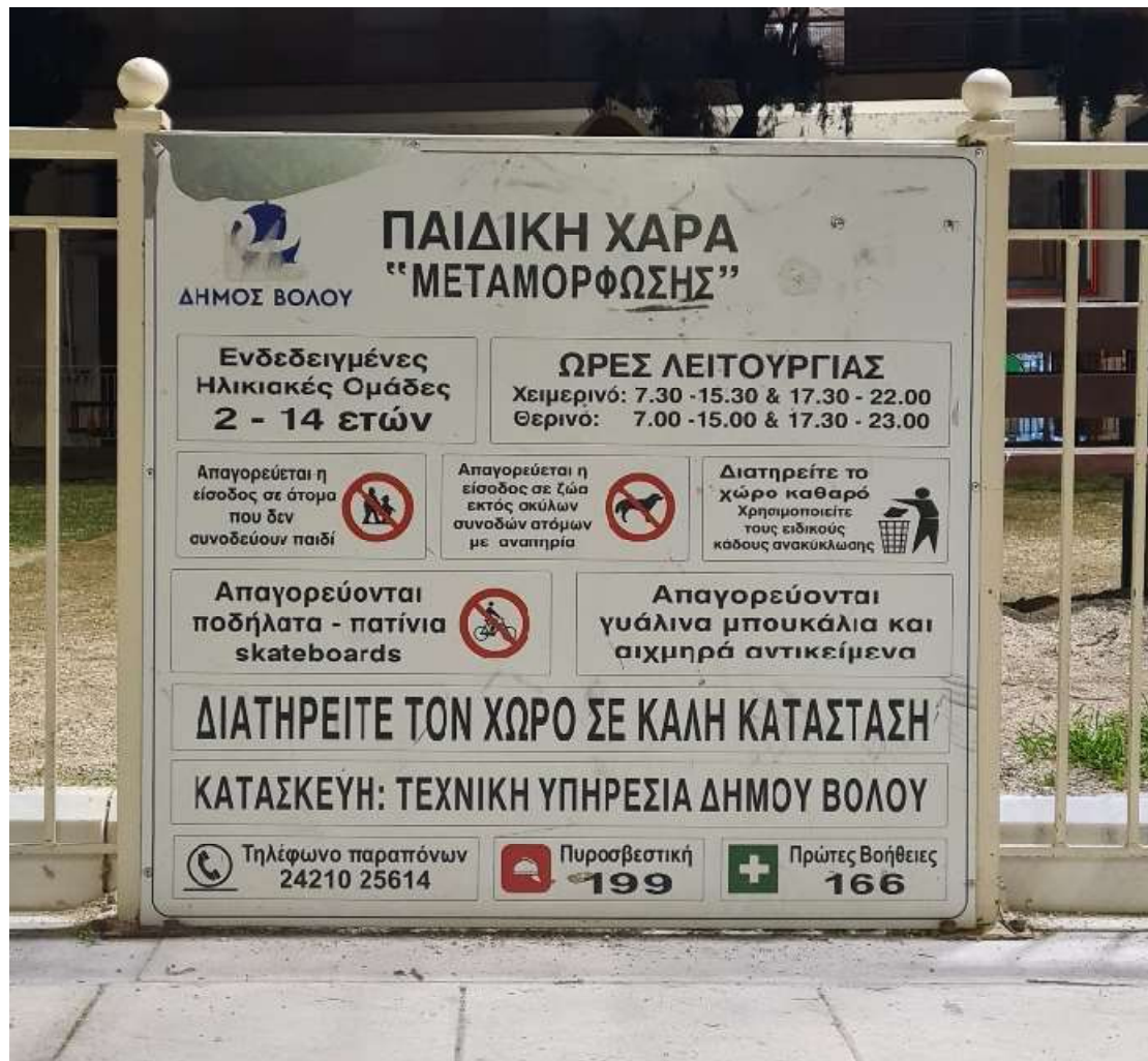
Εικόνα 1. Ρυθμιστική πινακίδα Παιδικής Χαράς "Μεταμόρφωσης" 09/01/2023

Όπως παρατηρούμε, στην πινακίδα υπάρχουν πληροφορίες, οι οποίες είναι γραμμένες όλες στα ελληνικά, προτάσεις για την λειτουργία της παιδικής χαράς και απαγορεύσεις. Έχει 12 πλαίσια από τα οποία τα 4 αναφέρονται σε απαγορεύσεις (το 1/3 της πινακίδας), στις ενδεδειγμένες ηλικιακές ομάδες που είναι 2 έως 14, το ωράριο λειτουργίας και την καθαριότητα του χώρου που συνοδεύεται με ένα pictogram στο οποίο απεικονίζεται ένα άτομο να ρίχνει κάτι στα σκουπίδια, ένα για τον υπεύθυνο φορέα κατασκευής (Δήμος Βόλου) και τα τελευταία τρία αναφέρονται σε τηλέφωνα ανάγκης. Το ωράριο λειτουργίας είναι πολύ συγκεκριμένο και συμφωνεί με τις ώρες κοινής ησυχίας των αντίστοιχων περιόδων. Τα πλαίσια των απαγορεύσεων συνοδεύονται από σήματα τα οποία υποδεικνύουν ποια είναι η απαγόρευση για παράδειγμα η απαγόρευση της εισόδου ζώων εκτός σκύλων συνοδών ατόμων με αναπηρία, η οποία συνοδεύεται με pictogram, ωστόσο στην απαγόρευση αιχμηρών αντικειμένων και γυάλινων μπουκαλιών δεν υπάρχει κάποια εικόνα/pictogram. Στην