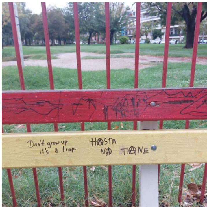
Εικόνα 19. Φωτογραφία από τη παιδική χαρά Λιμένα Βόλου "Don't grow up it's a trap"

Υπάρχει επίσης και το στοιχείο της διγλωσσίας όπως βλέπουμε στην εικόνα 15 όπου χρησιμοποιείται η αγγλική γλώσσα «Don't grow up it's a trap.»- «Μη μεγαλώσεις είναι παγίδα» (βλέπε εικόνα 19) Η φράση είναι γραμμένη με κεφαλαία και πεζά στην προστακτική και έχει αποτρεπτικό και προειδοποιητικό ύφος. Χρησιμοποιεί β' ενικό και προειδοποιεί τα παιδιά/άτομα να μην μεγαλώσουν καθώς το άτομο που το έγραψε θεωρεί την ενηλικίωση, παγίδα. Δηλώνει ότι υπάρχει η επιλογή του ατόμου να μην μεγαλώσει και να παραμείνει παιδί αποφεύγοντας την παγίδα της ενηλικίωσης.