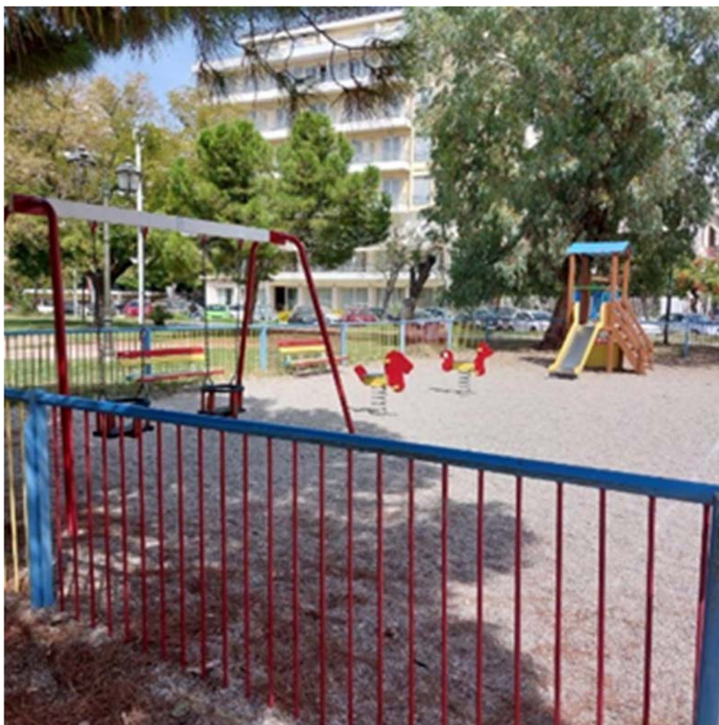
Εικόνα 10. Περιφραγή και παιχνίδια παιδικής χαράς "Οργανισμός Λιμένος Βόλου Α.Ε."

Η παιδική χαρά «Σπυρίδη & Ρ. Φερραίου» είναι περιφραγμένη με κόκκινα κάγκελα (βλέπε εικόνα 11) από τις δύο μεριές ενώ από τις άλλες δύο υπάρχουν κτήρια άρα η περιφραγή υπάρχει από τους τοίχους των κτηρίων και είναι η μοναδική από τα δεδομένα της έρευνας που βρίσκεται ακριβώς δίπλα σε δρόμο συχνής κυκλοφορίας αυτοκινήτων. Έχει δύο εισόδους και αποτελείται από δύο κούνιες με προστατευτικά, μία μονοθέσια τραμπάλα που απεικονίζει ένα ζώο, ένα πολυπαιχνίδι με δύο τσουλίθρες και παιχνίδι ισορροπίας και ένα τραμπολίνο το οποίο κατά τη διάρκεια της επιτόπιας παρατήρησης ήταν το παιχνίδι με την περισσότερη ζήτηση και σύμφωνα με τις σημειώσεις πεδίου χρησιμοποιείται αρκετά και από τους/τις συνοδούς των παιδιών, όπως φαίνεται και από το απόσπασμα 1.