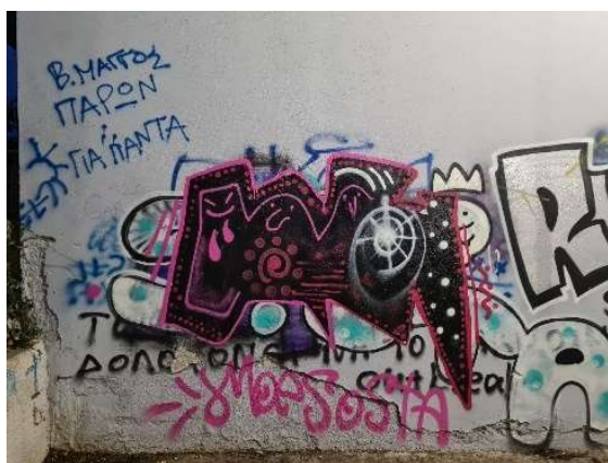
Εικόνα 13. Φωτογραφία απο την παιδική χαρά Ρ. Φεραίου "Β. ΜΑΓΓΟΣ ΠΑΡΩΝ ΓΙΑ ΠΑΝΤΑ"

Αρχικά υπάρχει ένα γκράφιτι που λέει «ΒΑΣΙΛΗΣ ΜΑΓΓΟΣ ΠΑΡΩΝ» (βλέπε εικόνα 15) το οποίο υπάρχει τρεις φορές μέσα στη παιδική χαρά. Αναφέρεται σε έναν φοιτητή του Βόλου που ξυλοκοπήθηκε και κατέληξε από έξι αστυνομικούς ( https://www.lifo.gr/tags/basilis-maggos ). Το ένα γκράφιτι είναι με μαύρα κεφαλαία γράμματα στο ίδιο ύψος με το «ΜΙΚΡΕ ΜΗ ΓΙΝΕΙΣ ΜΠΑΤΣΟΣ» (βλέπε εικόνα 17), το δεύτερο είναι σε ύψος άνω των δύο μέτρων με μπλε κεφαλαία γράμματα και με την προσθήκη του «ΓΙΑ ΠΑΝΤΑ» (βλέπε εικόνα 13) στο τέλος και το τρίτο «ΕVAMER ΖΕΙΣ» (βλέπε εικόνα 14) όπου το EVAMER είναι το καλλιτεχνικό του όνομα. Η αναφορά στον Βασίλη Μάγγο υπάρχει σε πολλά σημεία της πόλης και το συμβάν συνοδεύτηκε με πολλές διαδηλώσεις και πορείες στην πόλη. Το γκράφιτι αποτελεί μία δήλωση προς τους υπεύθυνους για τον θάνατο του ότι δε θα ξεχαστεί η πράξη τους, προς τους συγγενείς και φίλους του θανόντα πως δεν θα ξεχαστεί ο Βασίλης και προς το κοινό είναι ένας τρόπος να ενημερωθούν για το συμβάν. Αξίζει να αναφερθεί πως σε δύο από τα τρία γκράφιτι υπάρχουν τρεις τελείες όπου είναι το σύμβολο του σλογκαν «Μπάτσοι Γουρούνια Δολοφόνοι» σύμφωνα με αφηγήσεις φυλακισμένων.