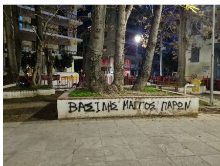
Εικόνα 15. Φωτογραφία απο την παιδική χαρά Ρ. Φερραίου "ΒΑΣΙΛΗΣ ΜΑΓΓΟΣ ΠΑΡΩΝ"

Τέλος έχουμε γκράφιτι πάνω στα παιχνίδια της παιδικής χαράς. Εξωτερικά του πολύπαιχνιδιού στην εξωτερική μεριά της τσουλίθρας υπάρχουν δύο γκράφιτι. «stop racism» με μία σβάστικα σε ένα κύκλο και ένα Χ επάνω διαγράφοντας έτσι τον ρατσισμό και τον ναζισμό λεκτικά αλλά και σημειωτικά. «Fuck homophobic people» με υπογράμμιση στη λέξη «people». (βλέπε εικόνα 16) Είναι ενδιαφέρουσα η επιλογή της γλώσσας καθώς είναι από τα λίγα δεδομένα που είναι στα αγγλικά. Όλα τα αντιρατσιστικά γκράφιτι είναι στα αγγλικά. Τα δύο αυτά γκράφιτι παροτρύνουν την/τον αναγνώστρια/η να σταματήσουν τον ρατσισμό, τον ναζισμό και την ομοφοβία και είναι γραμμένα στην προστακτική και χρησιμοποιούν υβριστικό λόγο.