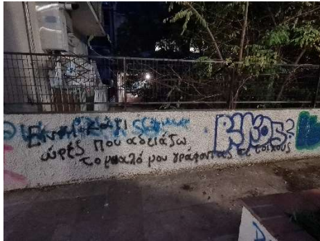
Εικόνα 20. Φωτογραφία από τη παιδική χαρά Ρ. Φερραίου "Είναι κάτι ώρες που αδειάζω το μυαλό μου γράφοντας σε τοίχους"

Έχουμε, επίσης, και την έκφραση απογοήτευσης από την κοινωνία με το γκράφιτι «ΑΠΟΤΥΧΗΜΕΝΗ ΚΟΙΝΩΝΙΑ» (βλέπε εικόνα 21) το οποίο έχει γραφτεί με ένα έντονο γαλάζιο χρώμα πάνω από ένα άλλο γκράφιτι με κεφαλαία γράμματα. Επίσης παρατηρήθηκε πως ακόμη κι αν υπάρχει ήδη κάτι γραμμένο σε ένα σημείο δεν σημαίνει ότι είναι απαγορευτικό να γραφτεί κάτι από πάνω καθώς μέσω της επιτόπιας παρατήρησης και της συλλογής δεδομένων είδα ότι πάνω στο γκράφιτι το οποίο σχολιάζουμε έχει δημιουργηθεί μία συνομιλία (βλέπε εικόνα 22) την οποία δυστυχώς δεν μπόρεσα να αποκωδικοποιήσω. Το άτομο που έγραψε πρώτο απέφυγε το «ΑΠΟΤΥΧΗΜΕΝΗ ΚΟΙΝΩΝΙΑ» και έγραψε με μικρά μαύρα γράμματα ωστόσο η απάντηση γράφτηκε με μεγάλα κόκκινα γράμματα πάνω στο γκράφιτι.