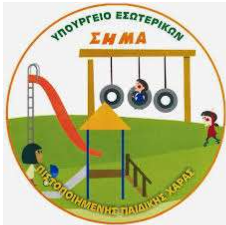
Εικόνα 7. Αυτοκόλλητο- Σήμα πιστοποιημένης παιδικής χαράς