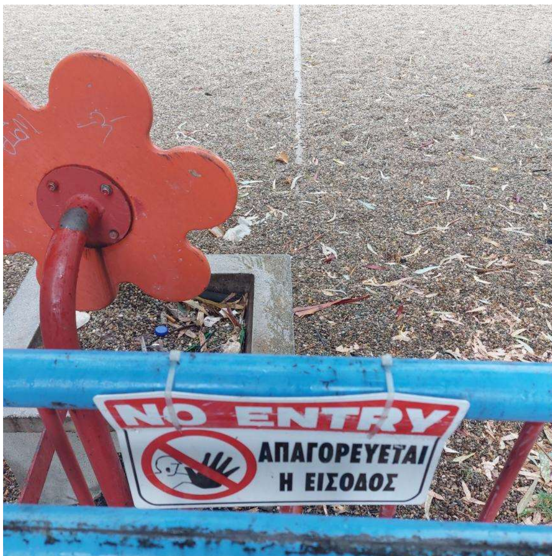
Εικόνα 3. Πινακίδα απαγόρευσης εισόδου στην παιδική χαρά "Οργανισμός Λιμένας Βόλου Α.Ε." 22/05/2023

Στην παιδική χαρά του Λιμένα Βόλου τοποθετήθηκε η πινακίδα «NO ENTRY ΑΠΑΓΟΡΕΥΕΤΑΙ Η ΕΙΣΟΔΟΣ» (βλέπε εικόνα 3) το διάστημα κατά το οποίο η παιδική χαρά ήταν κλειστή με κλειδαριές χωρίς αιτιολόγηση από τις αρχές και όταν άνοιξε δεν υπήρχαν ορατές αλλαγές. Στην πινακίδα αυτή η απαγόρευση της εισόδου γίνεται αρχικά με κεφαλαία λευκά γράμματα μέσα σε κόκκινο πλαίσιο με την χρήση της αγγλικής γλώσσας, έπειτα με το pictogram που απεικονίζει ένα άτομο με τεντωμένο χέρι και ανοιχτή παλάμη μέσα σε έναν κόκκινο κύκλο με μία κόκκινη γραμμή να τον διαπερνά κάνοντας έτσι ορατή την απαγόρευση και σημειωτικά, τέλος η απαγόρευση δίνεται και στα ελληνικά με κεφαλαία μαύρα γράμματα σε παθητική φωνή χωρίς να προσδιορίζεται το ποιος απαγορεύει την είσοδο αλλά αναφέρεται μόνο στην πράξη.