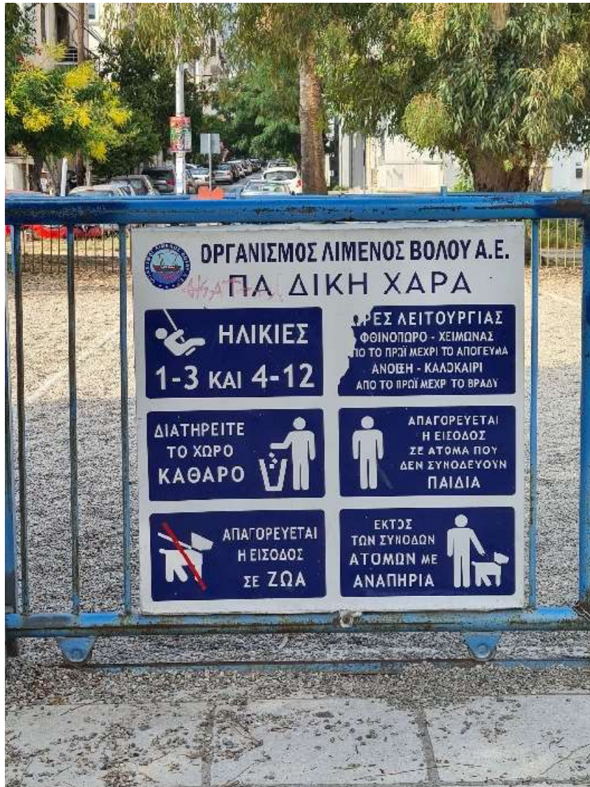
Εικόνα 2. Πινακίδα Παιδικής Χαράς "Οργανισμός Λιμένος Βόλου Α.Ε." 22/05/2023