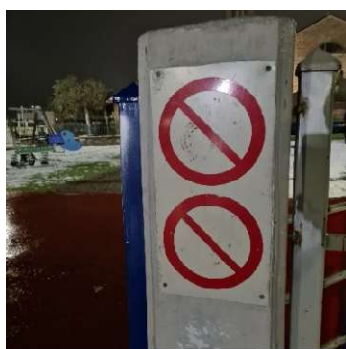
Εικόνα 6. Μη αναγνώσιμη πινακίδα παιδικής χαράς "Αγ. Κωνσταντίνου" 08/02/2023

Στην βασική πινακίδα (βλέπε εικόνα 4) υπάρχουν τα 12 πλαίσια από τα οποία τα 4 αναφέρονται σε απαγορεύσεις (το 1/3 της πινακίδας), 4 σε ενδείξεις για το ηλικιακό όριο, το ωράριο λειτουργίας και την καθαριότητα του χώρου, ένα για τον υπεύθυνο φορέα κατασκευής (Δήμος Βόλου) και τα τελευταία τρία αναφέρονται σε τηλέφωνα ανάγκης, πάνω δεξιά της πινακίδας υπάρχει φθαρμένο το επίσημο αυτοκόλλητο (βλέπε εικόνα 8) πιστοποίησης παιδικών χαρών από το υπουργείο εσωτερικών το οποίο θα έπρεπε να υπάρχει σε όλες τις παιδικές χαρές καθώς σύμφωνα με τον νόμο 28492 του 2009 οι παιδικές χαρές που δεν είναι πιστοποιημένες είναι παράνομες. Είναι η παιδική χαρά που βρίσκεται πιο κοντά στην εκκλησία του Αγίου Κωνσταντίνου. Μέσα στην παιδική χαρά υπάρχει χρωματιστός χλοοτάπητας. Είναι περιφραγμένη με κάγκελα και ξύλινα διαχωριστικά με χρώματα (κόκκινο, κίτρινο, άσπρο) ενώ δεν υπάρχουν παιχνίδια που προσομοιάζουν ζώα και είναι απλά χρωματιστά. Τα βράδια δεν έχει πολλά άτομα μέσα στη παιδική χαρά καθώς ενήλικοι και παιδιά παίζουν στο πάρκο του Αγίου Κωνσταντίνου και όχι στη παιδική χαρά.