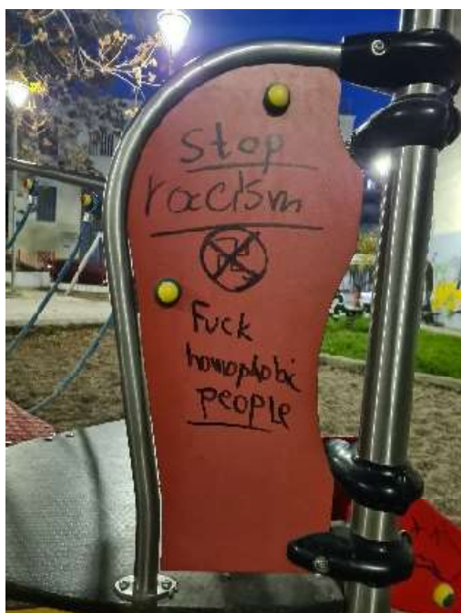
Εικόνα 16. Φωτογραφία απο την παιδική χαρά P. Φερραίου "stop racism" και "Fuck homophobic people"