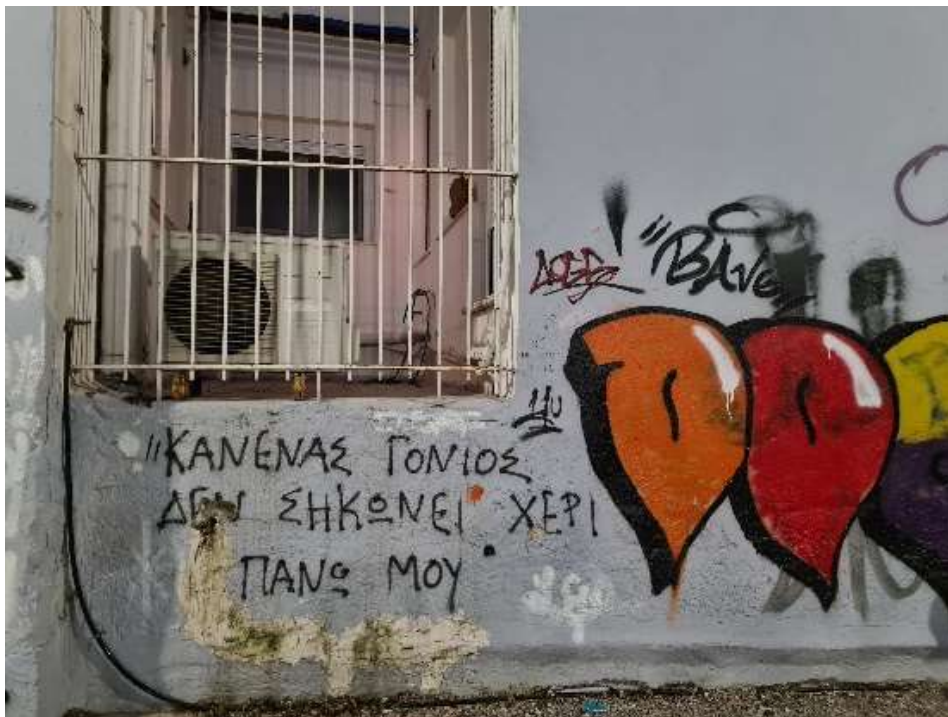
Εικόνα 18. Φωτογραφία από τη παιδική χαρά Ρ. Φερραίου "ΚΑΝΕΝΑΣ ΓΟΝΙΟΣ ΔΕΝ ΣΗΚΩΝΕΙ ΧΕΡΙ ΠΑΝΩ ΜΟΥ"

γραμματισμό της ανάγνωσης νέων ελληνικών. Είναι μία δήλωση που αναφέρεται στην ενδοοικογενειακή βία την οποία ουσιαστικά απαγορεύει το άτομο που έγραψε το γκράφιτι και στην δική του/της οικογένεια αλλά και δημοσίως, δηλώνει την κακοποίηση των γονέων κατά των παιδιών κάνοντας έτσι ορατή την λάθος διαπαιδαγώγηση και παροτρύνοντας τα υπόλοιπα παιδιά να μιλήσουν και να σταματήσουν να ανέχονται την βία. Ακόμη και ανώνυμα το γκράφιτι αυτό είναι τολμηρό καθώς τα παιδιά είναι λιγότερο πιθανό να μιλήσουν για την ενδοοικογενειακή βία. Συμπεραίνουμε επίσης, ότι ο/η δημιουργός του γκράφιτι έχει ενεργό ρόλο και μπαίνει ως υποκείμενο στην δήλωση του/της