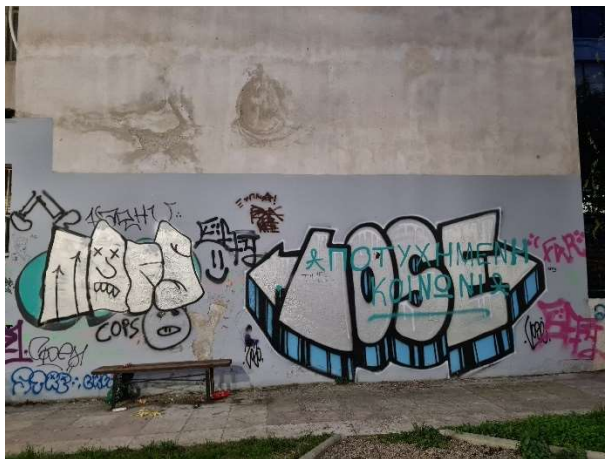
Εικόνα 21. Φωτογραφία από την παιδική χαρά Ρ. Φερραίου "Αποτυχημένη κοινωνία"

Έχουμε, επίσης, και την έκφραση απογοήτευσης από την κοινωνία με το γκράφιτι «ΑΠΟΤΥΧΗΜΕΝΗ ΚΟΙΝΩΝΙΑ» (βλέπε εικόνα 21) το οποίο έχει γραφτεί με ένα έντονο γαλάζιο χρώμα πάνω από ένα άλλο γκράφιτι με κεφαλαία γράμματα. Επίσης παρατηρήθηκε πως ακόμη κι αν υπάρχει ήδη κάτι γραμμένο σε ένα σημείο δεν σημαίνει ότι είναι απαγορευτικό να γραφτεί κάτι από πάνω καθώς μέσω της επιτόπιας παρατήρησης και της συλλογής δεδομένων είδα ότι πάνω στο γκράφιτι το οποίο σχολιάζουμε έχει δημιουργηθεί μία συνομιλία (βλέπε εικόνα 22) την οποία δυστυχώς δεν μπόρεσα να αποκωδικοποιήσω. Το άτομο που έγραψε πρώτο απέφυγε το «ΑΠΟΤΥΧΗΜΕΝΗ ΚΟΙΝΩΝΙΑ» και έγραψε με μικρά μαύρα γράμματα ωστόσο η απάντηση γράφτηκε με μεγάλα κόκκινα γράμματα πάνω στο γκράφιτι.