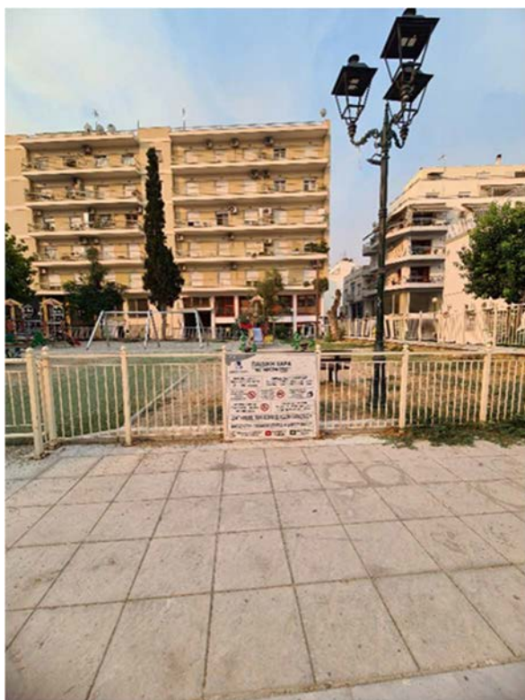
Εικόνα 9. Περιφραξη παιδική χαράς "Μεταμόρφωση"

Η παιδική χαρά «Οργανισμός Λιμένα Βόλου Α.Ε» είναι περιφραγμένη με κόκκινα, κίτρινα και μπλε κάγκελα (βλέπε εικόνα 10). Γενικά μέσα στην παιδική χαρά επικρατεί το κόκκινο σε συνδυασμό με τα άλλα βασικά χρώματα το μπλε το κίτρινο αλλά και το πράσινο. Τα ηλικιακά όρια φαίνεται να τηρούνται κατά την διάρκεια της λειτουργίας της παιδικής χαράς. Υπάρχει μία βρύση η οποία υπολειτουργεί και έχει δύο εισόδους αλλά μόνο από τη μία επιτρέπεται η είσοδος. Μέσα στη παιδική χαρά υπάρχουν δύο πολυπαιχνίδια το ένα με δύο τσουλίθρες που απεικονίζουν ζώα μία κούνια και μονόζυγο και το άλλο με μία τσουλίθρα και μία κούνια με προστατευτικά. Έχει επίσης δύο κούνιες με προστατευτικά και δύο κούνιες απλές, δύο μονοθέσιες τραμπάλες που απεικονίζουν ζώα και δύο τραμπάλες δύο ατόμων. Τα παγκάκια αυτής της παιδικής χαράς είναι τέσσερα σε σύνολο (δύο πίσω από τις μονοθέσιες τραμπάλες και δύο πίσω από τις διθέσιες) και είναι βαμμένα με κίτρινο, κόκκινο και μπλε χρώμα, ενώ δεν υπάρχει κανένας κάδος σε αυτή την παιδική χαρά. Το έδαφος αποτελείται από χαλίκι μόνο.