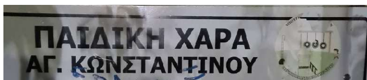
Εικόνα 8. Φθαρμένο αυτοκόλλητο- σήμα πιστοποίησης παιδικής χαράς "Αγ. Κωνσταντίνου" 08/02/2023