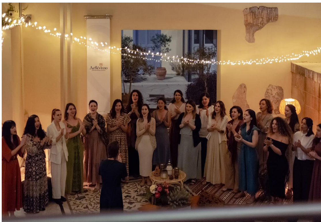
Φωτογραφία 1. «Amalgamation Choir», 2023 - Φωτογραφία από τον λογαριασμό της «Amalgamation Choir» στα κοινωνικά δίκτυα.

Παρά την απουσία όμως των χαμηλών φωνών και του οργάνου, η ίδια αναφέρει ότι βρίσκει μια γοητεία μέσα σε αυτό το ατελές».