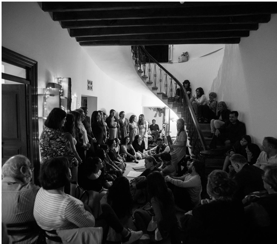
Φωτογραφία 5. «Amalgamation Choir», 2022

αυτό αποτελεί κι ένα πλεονέκτημα για την ατμόσφαιρα που μπορεί να δημιουργηθεί. Εκτός από αυτό, ο χώρος παίζει σημαντικό ρόλο, καθώς συμβάλλει στην έμπνευση και δημιουργία του αφηγήματος και για την χορωδία αυτή, αποτελεί ένα μέλος της».