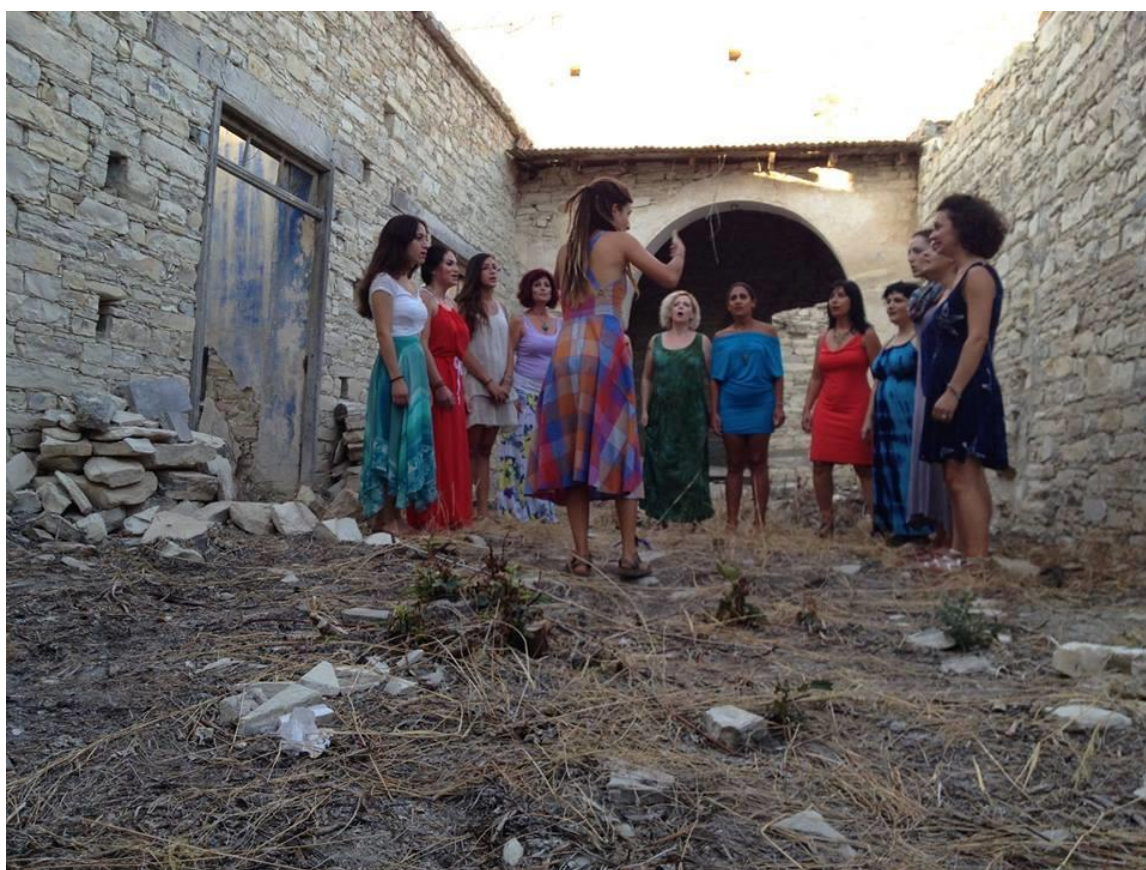
Φωτογραφία 3. «Amalgamation Choir», 2014

Συνεχίζοντας, η ενδυμασία αποτελεί ένα ακόμη στοιχείο «που αναδεικνύει την μοναδικότητα της «Amalgamation Choir» » σύμφωνα με την ΒΑ. Η αρχή του συνόλου σε όλα τα πράγματα είναι η μοναδικότητα του κάθε ανθρώπου. Επειδή η κάθε προσωπικότητα διαφέρει, εδώ δίνεται η δυνατότητα στην κάθε γυναίκα να φορέσει ότι θέλει. Διαλέγεται μια παλέτα χρωμάτων ή μπαίνει κάποιο βασικό στοιχείο που πρέπει να υπάρχει σε όλες τις κοπέλες και από κει και πέρα η καθεμία επιλέγει πως θα ντυθεί. Την ίδια τακτική χρησιμοποιούν και στις φωνές, όπου όταν κάποια δεν αισθάνεται άνετα να τραγουδήσει σε ψηλή ή χαμηλή φωνή γιατί κάτι της συμβαίνει, παραμένει εκεί που θέλει.