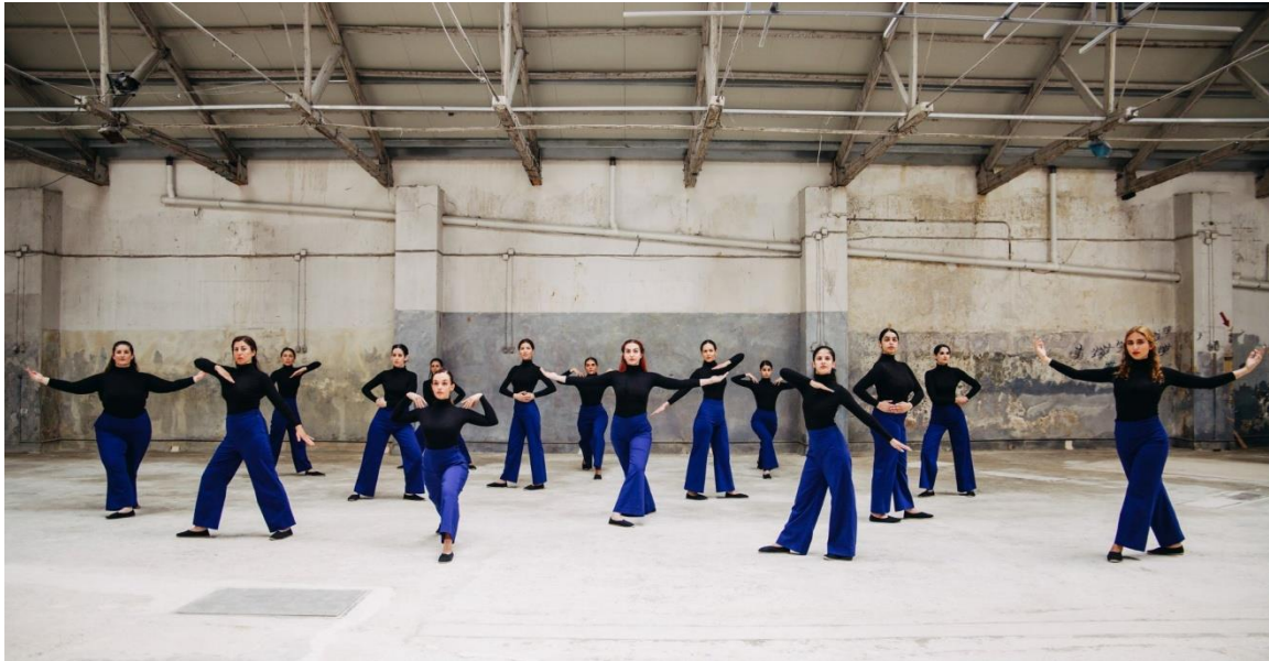
Φωτογραφία 2. «Chòres», 2022 - Φωτογραφία από τον λογαριασμό από τις «Chòres» στα κοινωνικά δίκτυα.

μικρό βαθμό, όταν χρειάζεται, από συναυλία σε συναυλία. Ακόμη, εξαρτάται από την εκάστοτε συνθήκη και προσαρμόζεται ανάλογα και με τον χώρο που υπάρχει σε κάθε παράσταση. Αν ο χώρος δεν επαρκεί, δεν υπάρχει και χορογραφία».