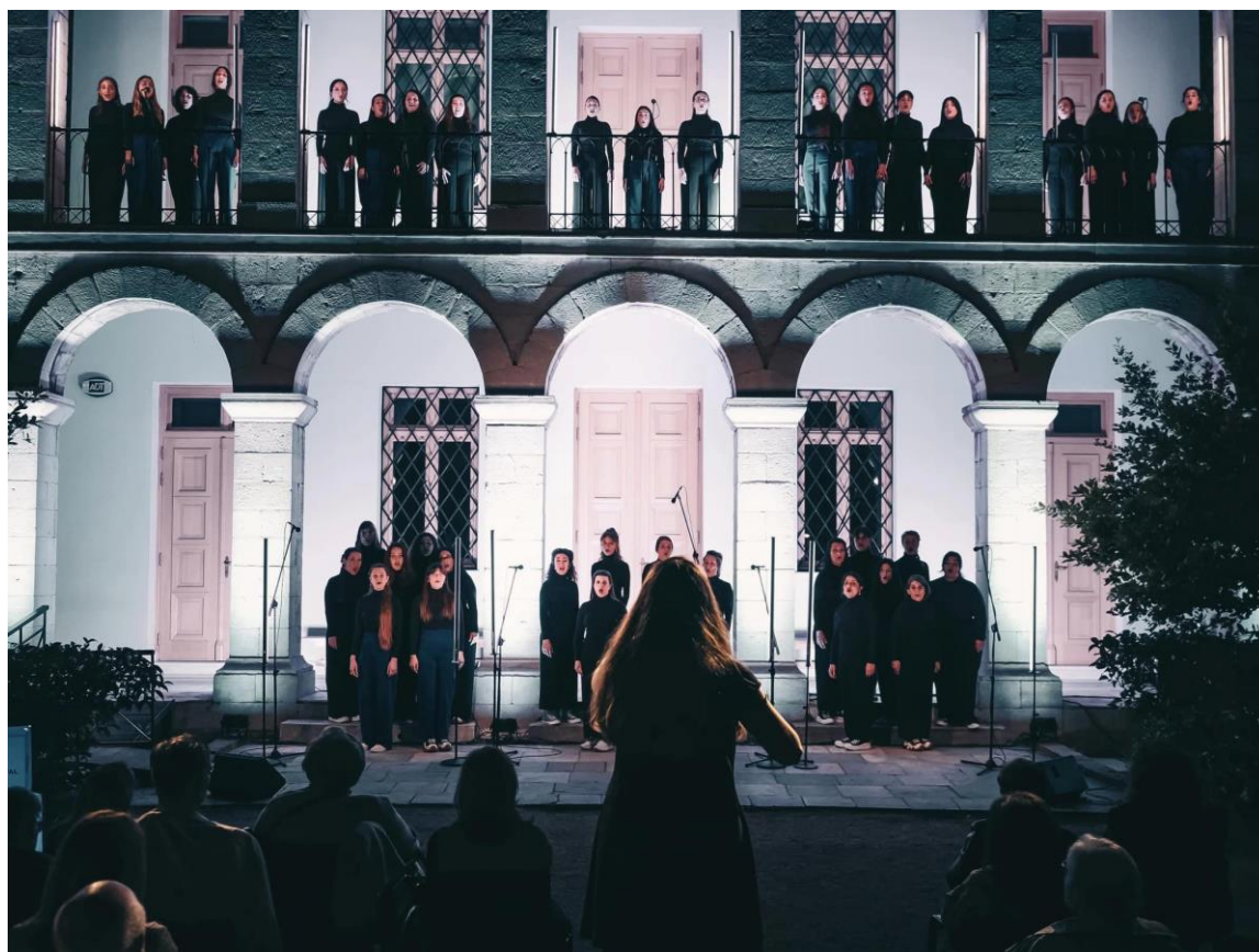
Φωτογραφία 6. «Chòres», 2023

Όσον αφορά την αρχιτεκτονική των κτιρίων και ο ΧΓ «λέει πως είναι σημαίνουσα ακόμη και αν δεν είναι αναγνωρίσιμη. Ο ίδιος αναφέρει ότι «υπάρχει κάτι πέραν της αισθητικής». Επειδή ο χώρος επιλέγεται σύμφωνα με το πλαίσιο μιας θεματικής που ορίζεται κάθε φορά, από την οποία εξαρτάται και η εμφάνιση του συνόλου και το ρεπερτόριο, συμβάλλει στο νόημα της επιτέλεσης. Έτσι, το νόημα αλλάζει σε κάθε χώρο και συνεπώς και η σημασιοδότηση του».