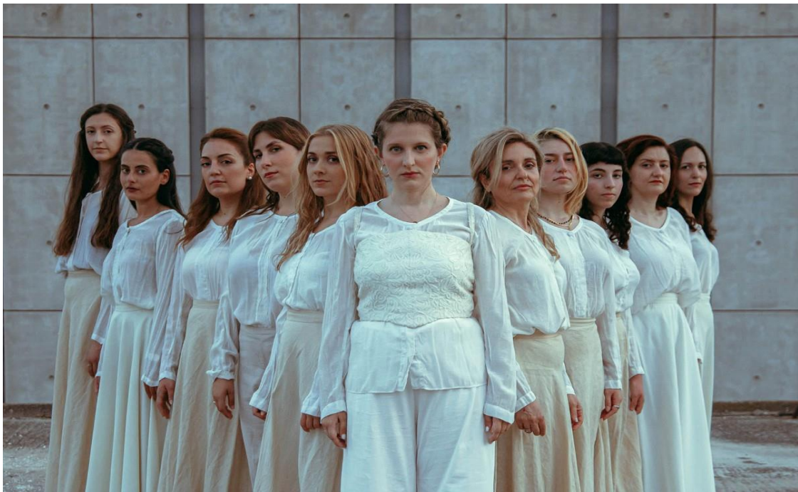
Φωτογραφία 4. «Chòres», 2022