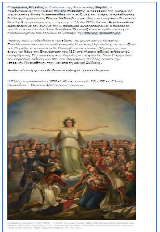
Εικόνα 2: Στιγμιότυπο από το άρθρο της εφημερίδας "Πρώτο Θέμα"