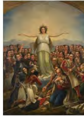
1. Η Ελλάς ευγυνωμούσα

Η Ελλάς ευγυνωμούσα (1858) αλληγορία στην οποία η ελευθερωμένη πλέον Ελλάδα, λυσίκωμη, δακνοστεφής, με μακρά λευκά αρχαιοπρεπές ένδυμα, ανυπόδητη, συνάγει υπό τη σκέπη της ανεξαρτήτως τα φυσικά και πνευματικά τέκνα της που προστάξιμασαν και υπηρέτησαν την Επανάσταση – από τον Κόραη, τον Ρήγα, τον Μιχαήλ Βόδα Σούτζα και τους Υψηλάντηδες έως την Μπουπουλίνα, τον Μιαούλη, τον Παπαφλέσσα, τον Καραϊσκάκη, τον Κολοκοτρώνη, τον Μαυροκορδάτο, τον Καποδίστρια και τον Λόρδο Byron. Γαλήνια και σαφάρη, η Ελλάδα κλίνει την κεφαλή, τανύζει τα χέρια και τους αποτίει την οφειλόμενη ευγνώμονα τιμή. Είναι αληθινό μνημείο εθνικής ομόνοιας. Συμπυκνώνει, ασφαλών, την έννοια της Παλιγγενεσίας, μία έννοια καθοριστική, με την πατρίδα να παριάνεται ως την αρχαία Ελλάδα που αναγεννάται ως νέα χώρα στην Επανάσταση του 1821 που τη λύτρωσε από τα μακραίωνα δεσμά.