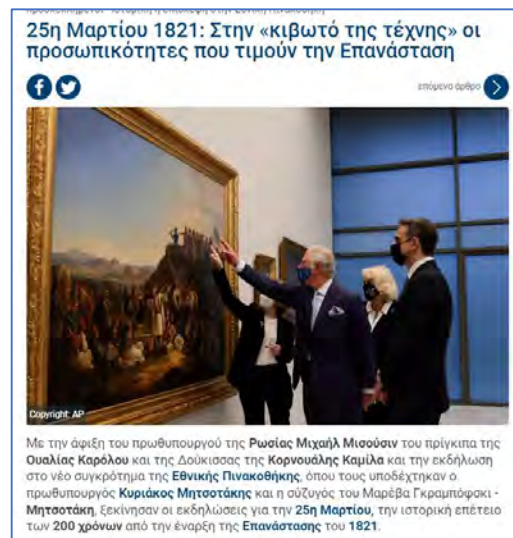
Εικόνα 4: Στιγμιότυπο από το άρθρο της εφημερίδας "ΕΘΝΟΣ"

Το καθένα από τα άρθρα εστιάζει ιδιαίτερα στην παρουσίαση ενός δημοσιογραφικού ενημερωτικού κειμένου, που σκοπό έχει να πληροφορήσει για την έναρξη λειτουργίας της Εθνικής Πινακοθήκης και δευτερευόντως για την περιοδική έκθεση για το 1821. Επίσης, δίδεται ιδιαίτερη βαρύτητα στις προσωπικότητες που επισκέφθηκαν την έκθεση