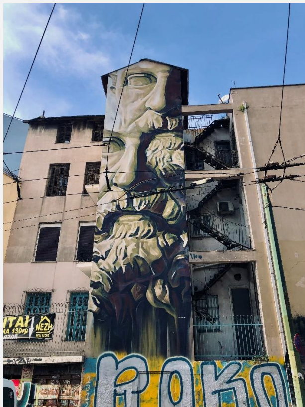
EIKONA 8 Street Art, Tag