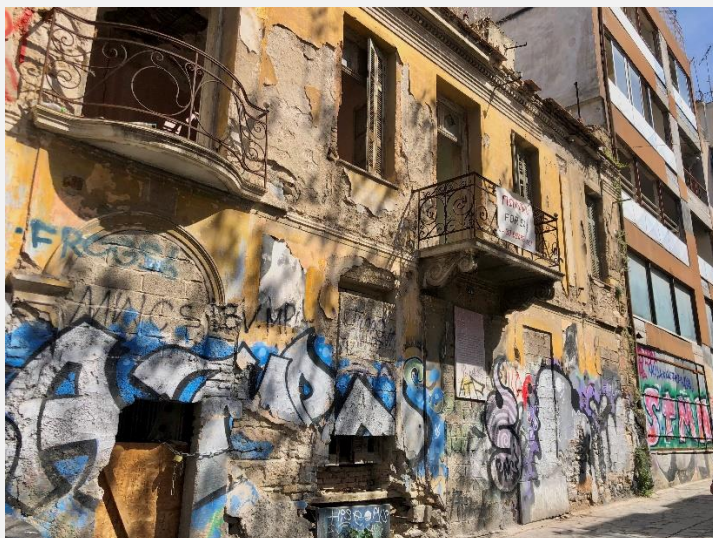
EIKONA 11 Tag