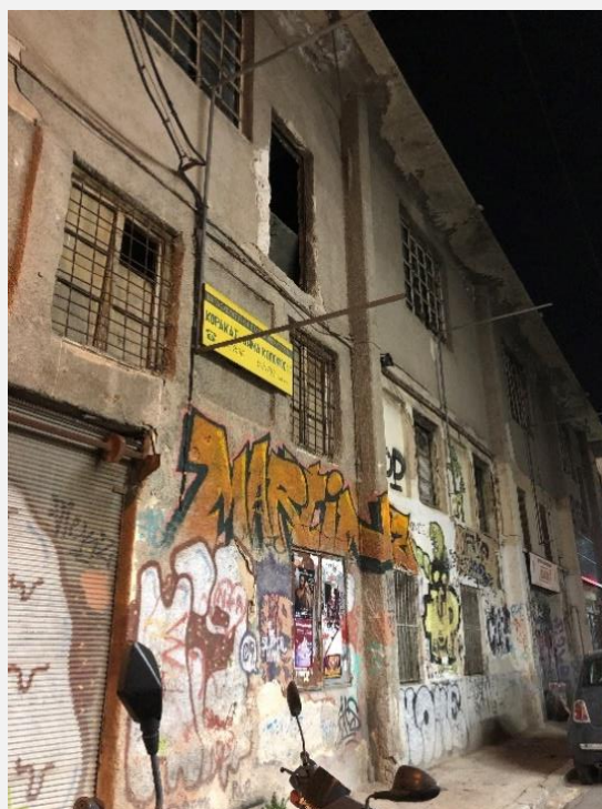
EIKONA 9 Tag