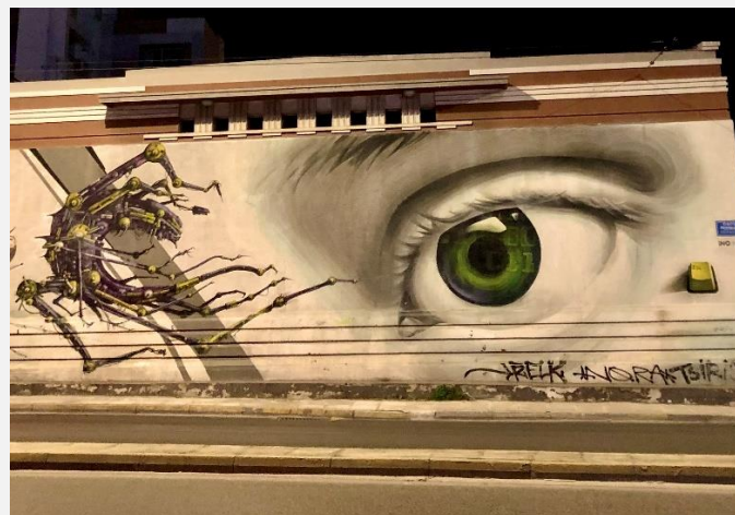
EIKONA 5 Street Art