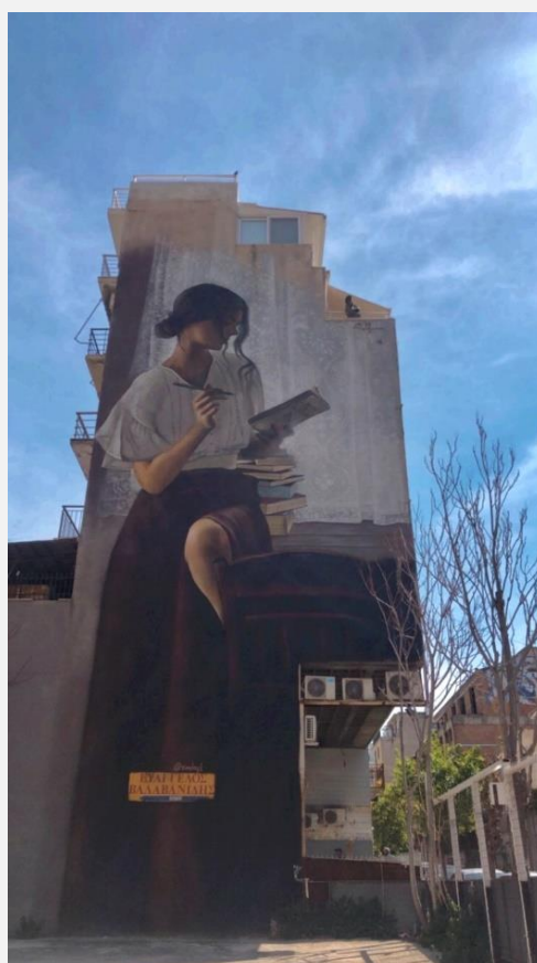
EIKONA 7 Street Art