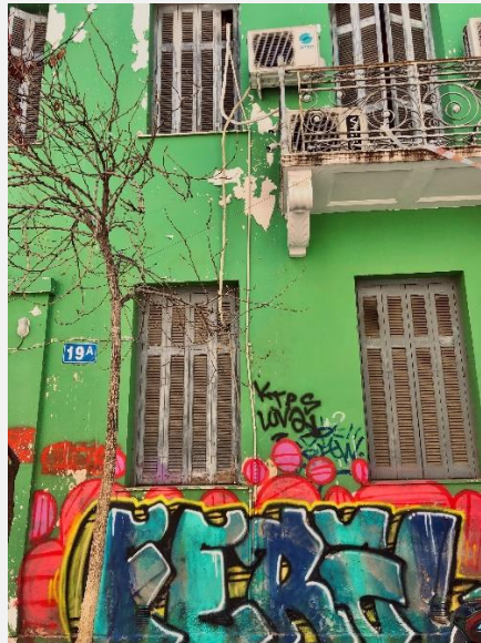
EIKONA 4 Tag