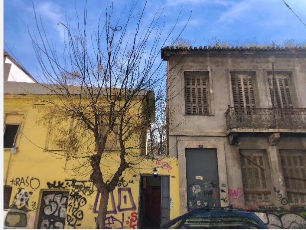
EIKONA 3 Tag