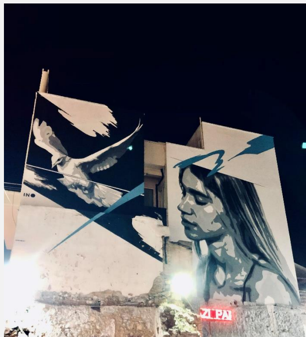
EIKONA 6 Street Art