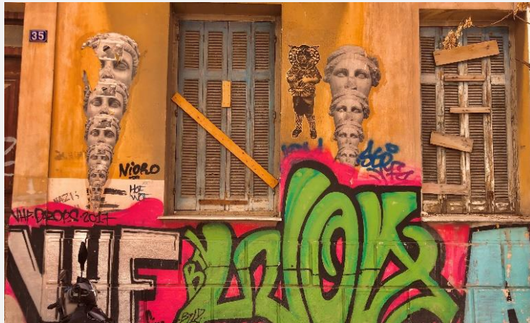
EIKONA 1 Stencil & Tag

ΟΙ ΦΩΤΟΓΡΑΦΙΕΣ ΕΙΝΑΙ ΤΗΣ ΣΥΝΤΑΚΤΡΙΑΣ ΤΗΣ ΠΤΥΧΙΑΚΗΣ