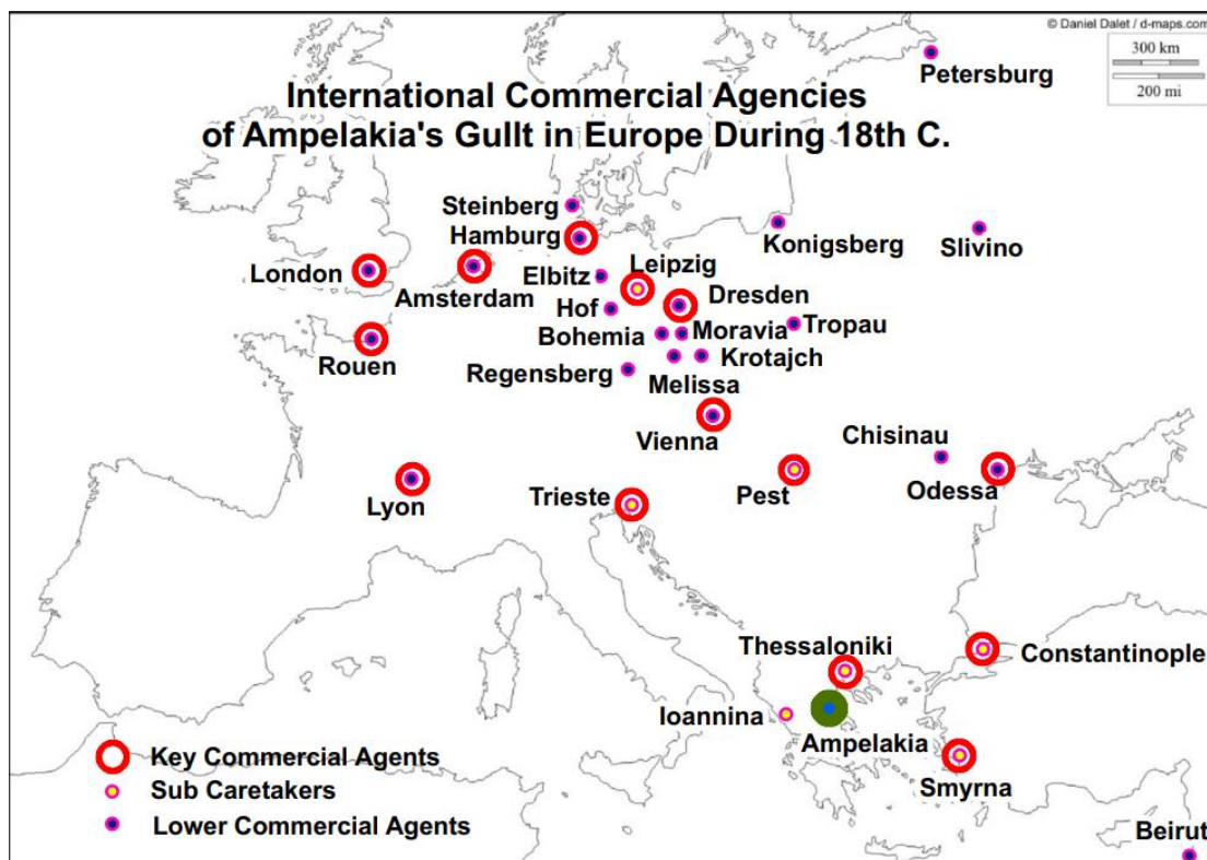
Χάρτης 1.1. Τα Αμπελάκια και οι εμπορικές τους αντιπροσωπείες στο εξωτερικό. 61

Τον πρώτο καιρό, η νέα αυτή ρύθμιση μάλλον έδρασε ικανοποιητικά ως προς τα αναμενόμενα μεγέθη και έδειξε να ξεπερνάει τις διχόνοιες του παρελθόντος παρόλες τις δυσαρέσκεις στο πρόσωπο του Σβάρτς κατά καιρούς. Μάλιστα ο ίδιος γράφει πως υπάρχει ανάγκη οι παρούσες συνθήκες να «δεθούν» για ακόμη τρία χρόνια με «νόμους καλούς» 62 , οι οποίοι θα διασφαλίζουν περαιτέρω την αποφυγή της κερδοσκοπίας των μελών. Οι συνθήκες, όμως, της διεθνούς αγοραστικής κίνησης δεν ευνόησαν για άλλη μια φορά τη συντροφία, η οποία τώρα είχε να ανταπεξέλθει τους καταστρεπτικούς Ναπολεόντειους πολέμους και τη συμμετοχή της Αυστρίας σε αυτούς. Το 1798 αναστέλλει τις δραστηριότητές της εκ νέου.