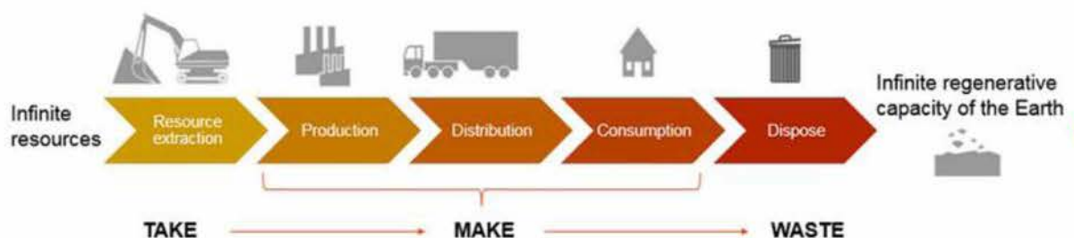
Εικόνα 2: Γραμμικό οικονομικό μοντέλο

Από το 1970 έως το 2017 τριπλασιάστηκε σε παγκόσμιο επίπεδο η ετήσια εξόρυξη υλικών, δεδομένο που προκαλεί παγκόσμιο κίνδυνο. Περίπου το μισό ποσοστό των αερίων του θερμοκηπίου και περισσότερο από το 90% της απώλειας βιοποικιλότητας και έλλειψης νερού οφείλεται στην εξόρυξη πόρων και στην επεξεργασία υλικών, καυσίμων και τροφίμων. Η ευρωπαϊκή βιομηχανία «ευθύνεται» για το 20% του συνολικού ποσοστού αερίων του θερμοκηπίου στην ΕΕ. Αυτό συμβαίνει διότι το μοντέλο που ακολουθεί είναι το «γραμμικό», εξαρτάται δηλαδή από την εξόρυξη των πόρων, την παραγωγή και διανομή των τελικών παραγόμενων προϊόντων τα οποία τελικά θα καταλήξουν ως απόβλητα (Εικόνα 2). Μόνο το 12% των υλικών που χρησιμοποιούνται προέρχονται από ανακύκλωση (European Green Deal).