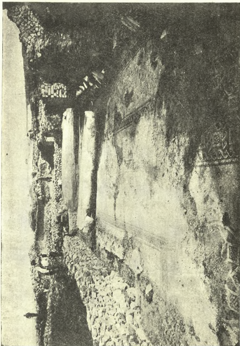
Εἰς 1. Ἡ μεσημβρινή πλευρά τοῦ περιστυλίου τοῦ προτογοριστιανικοῦ ἱδρύματος, τοῦ γνωστοῦ σήμερον ὑπὸ τὸ ὄνομα «Βασιλόσπιτο», ἐφ' οὗ ὑπῆρχε μέγα ψηφιδωτόν.