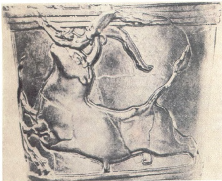
Μινωϊτης αθλητής της ταυροκαθαρσίας ανάμεσα στα κέρατα του ταύρου μετά από μια αποτυχημένη προσπάθεια.