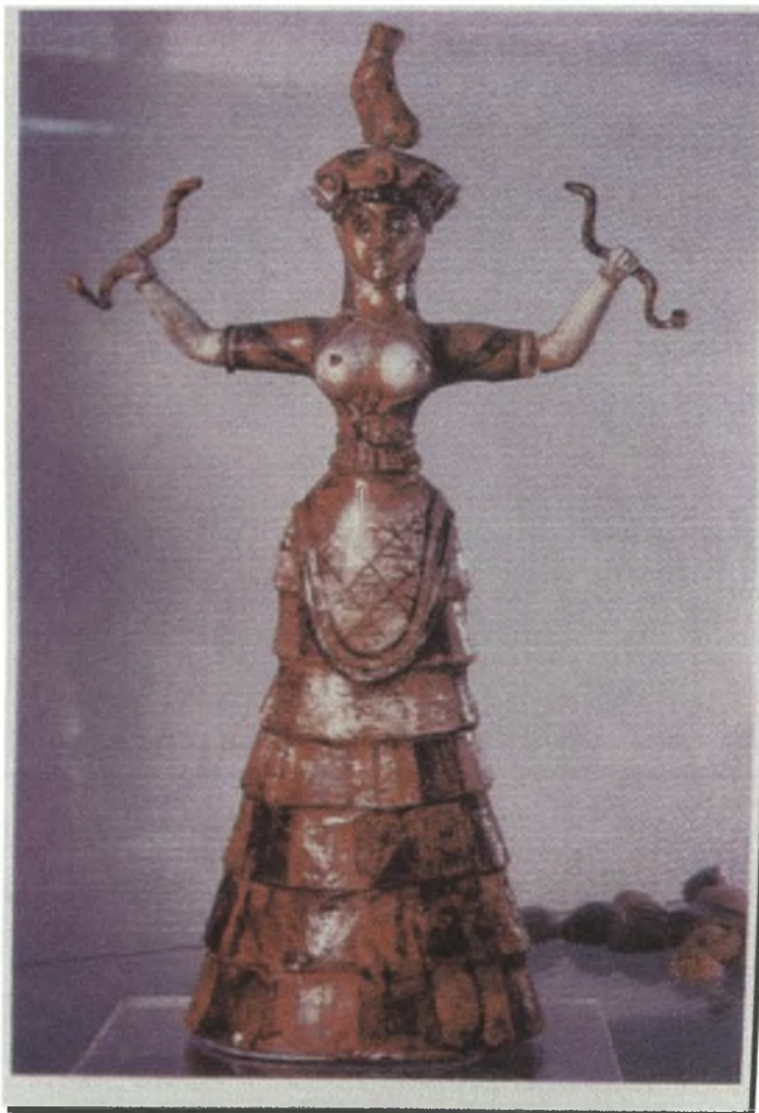
Η μεγάλη θεά της Μινωικής Κρήτης. Αγαματίδιο από φαγεντιανή.