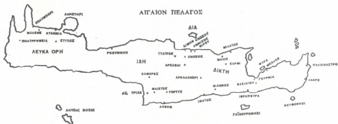
Χάρτης της Μινωικής Κρήτης (από το βιβλίο του Στουλ. Αλεξίου, Μινωικός πολιτισμός, πιν. ΔΔ')