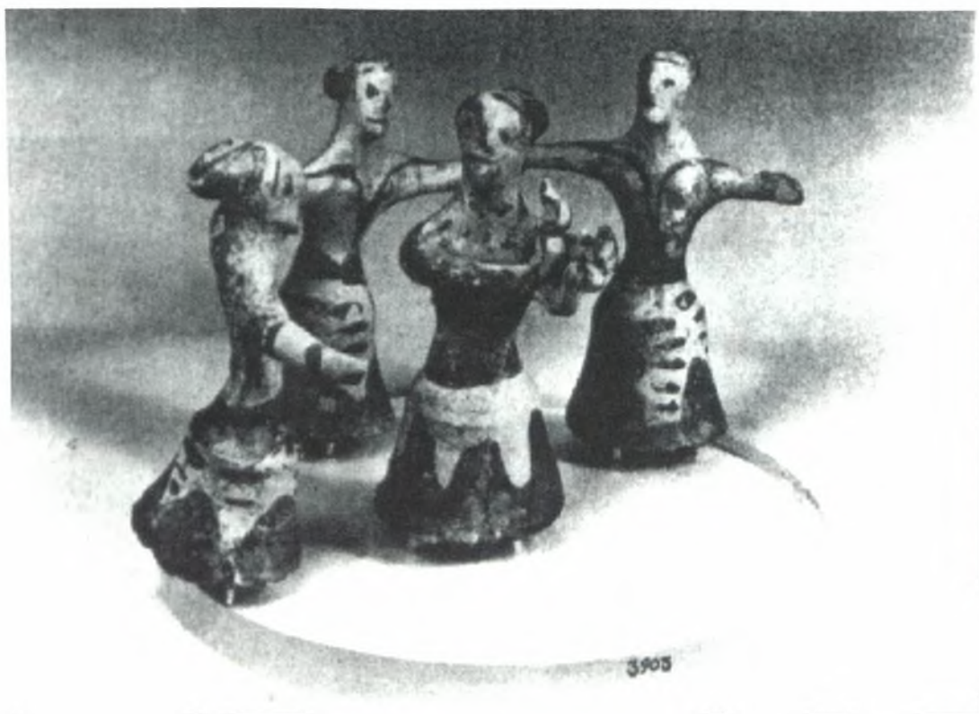
Σύμπλεγμα χορευτὸν , Μινωική Κρήτη