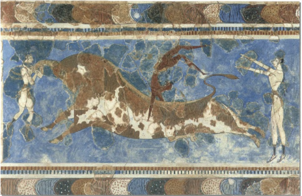
Ταυροπαιδιά. Τοιχογραφία από το ανάκτορο της Κνωσού 15 ου αιώνας π.Χ.