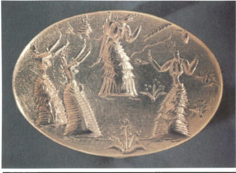
Εκστατικός χορός τεσσάρων γυναικών. Από χρυσό Μινωικό δαχτυλίδι.