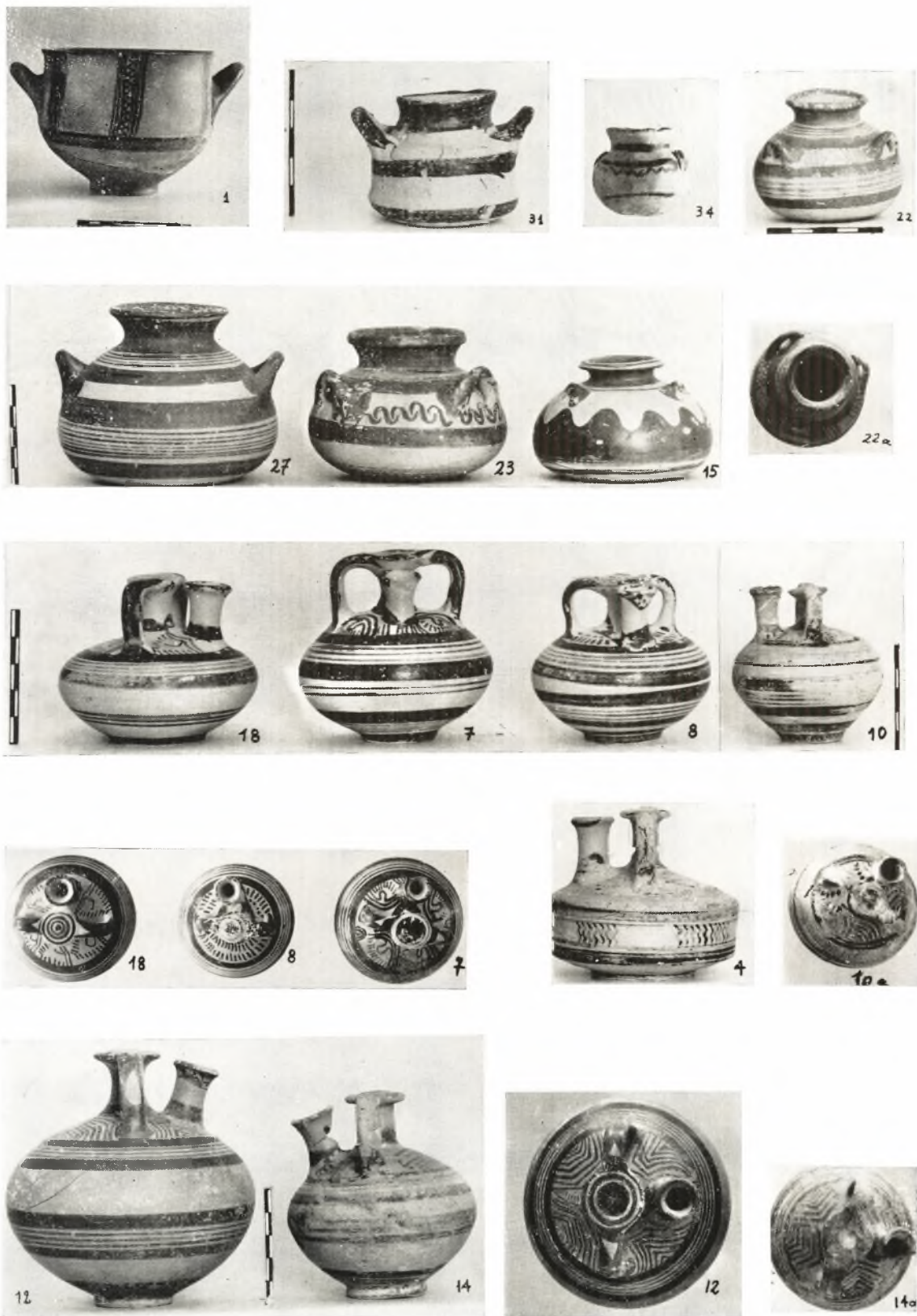
*Ηραϊον Ἀργούς : Ἀγγεῖα ἐκ τοῦ Μυκηναϊκοῦ τάφου.