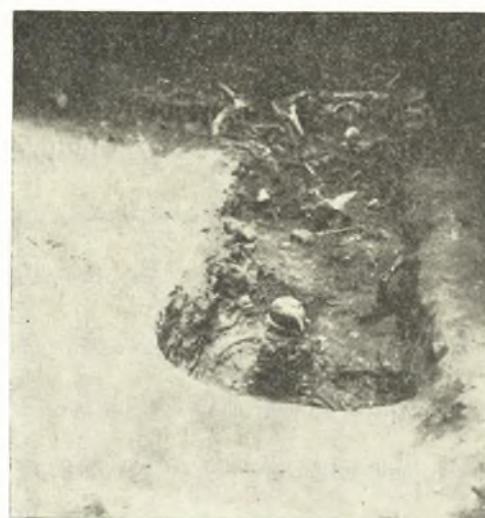
Εἰκ. 5. Ὁ λάκκος εἰς τὸ μέσον τοῦ θαλάμου.

δευον παιδικὰς ταφὰς· τὰ ἀνήκοντα εἰς τὰς ταφὰς ταύτας ὅστᾳ διελύθησαν εὐκόλως λόγῳ τῆς λεπτοφυοῦς συστάσεώς των.