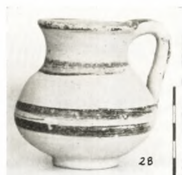
Ἡραϊὸν Ἀγγούς: Ἀγγεῖα ἐκ τοῦ Μυκηναϊκοῦ τάφου.