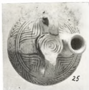
ΜΥΚΗΝΑΪΚΟΣ ΤΑΦΟΣ ΗΡΑΙΟΥ ΑΓΓΟΥΣ