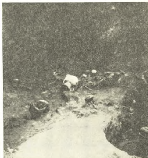
Εἰκ. 3. Ἀποψις τῆς ΒΑ. πλευρᾶς τοῦ θαλάμου.