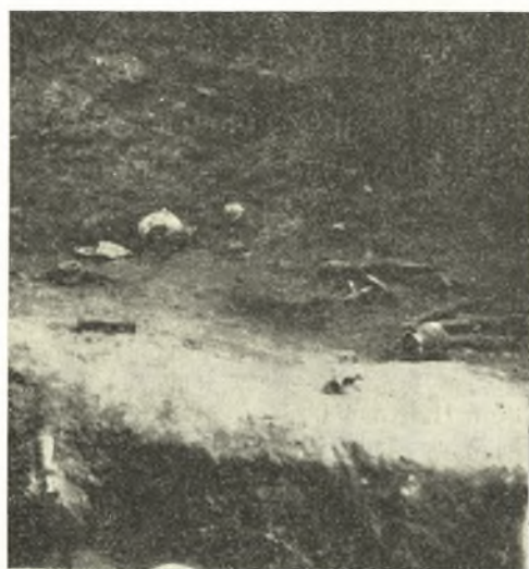
Εἰκ. 4. Ἀποψις τῆς ΒΑ. πλευρᾶς τοῦ θαλάμου