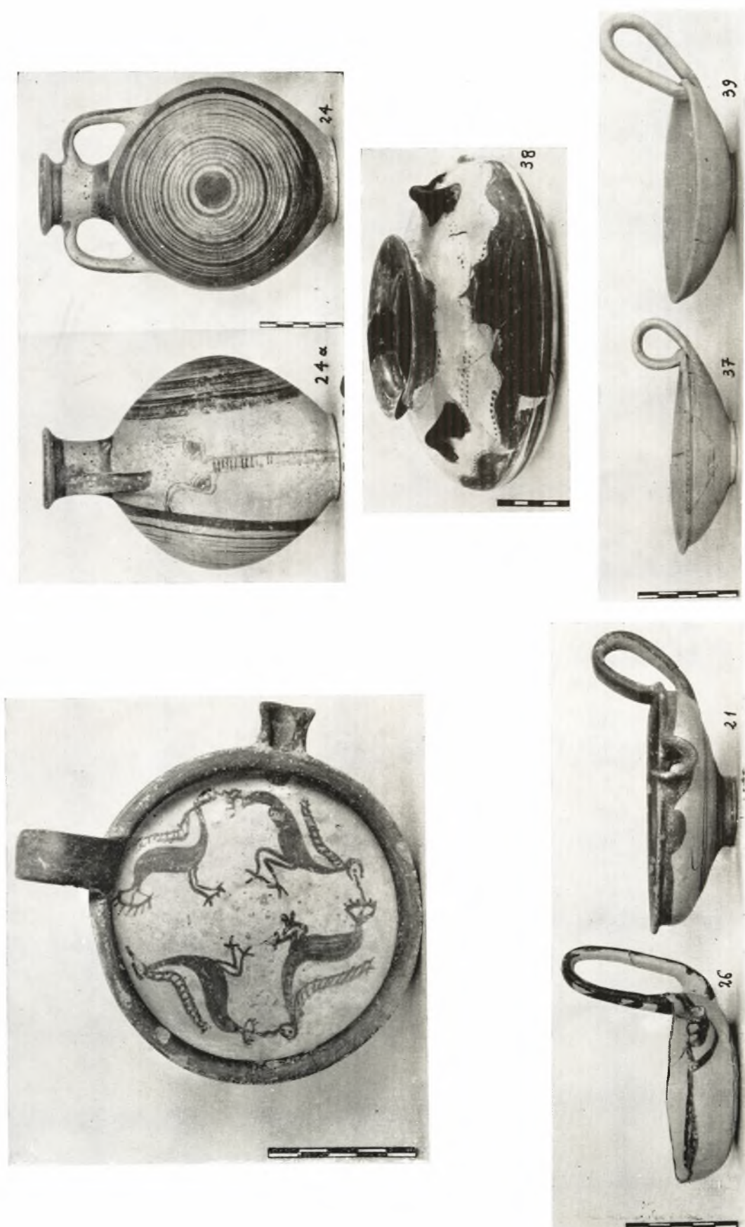
Ἡράκλειον Ἀργεῖος: Ἀγγεῖα ἐκ τοῦ Μυκηναϊκοῦ τάφου. (Ἄνω ἀριστερὰ τὸ ἐσωτερικὸν τῆς φιάλης ἀρ. 21.)