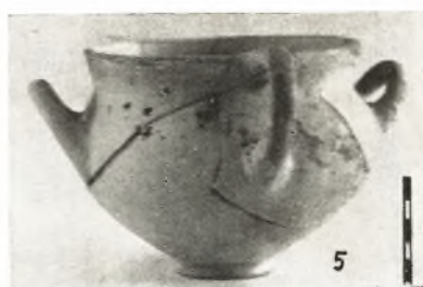
*Ηραϊον Ἀργους : Ἀγγεῖα ἐκ τοῦ Μυκηναϊκοῦ τάφου.