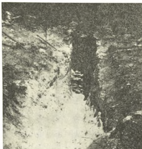
Εἰκ. 2. Ὁ δρόμος καὶ ἡ εἵσοδος τοῦ τάφου.

γνωστή ἢ ἀρχική των θέσις, τὰ λοιπὰ ἔκλειντο μεμονωμένα, μὴ παρατηρηθέντων ὁστων πλησίον αὐτῶν. Ἐκ τούτων τὰ α καὶ γ ἀσφαλῶς, πιθανῶς δὲ καὶ τὸ β ἀνήκον εἰς παιδικὴν ταφὴν 1 , δὲν νομίζω δὲ ἄτοπον τὴν εἰκασίαν ὅτι καὶ τὰ δ καὶ ε συνώ-