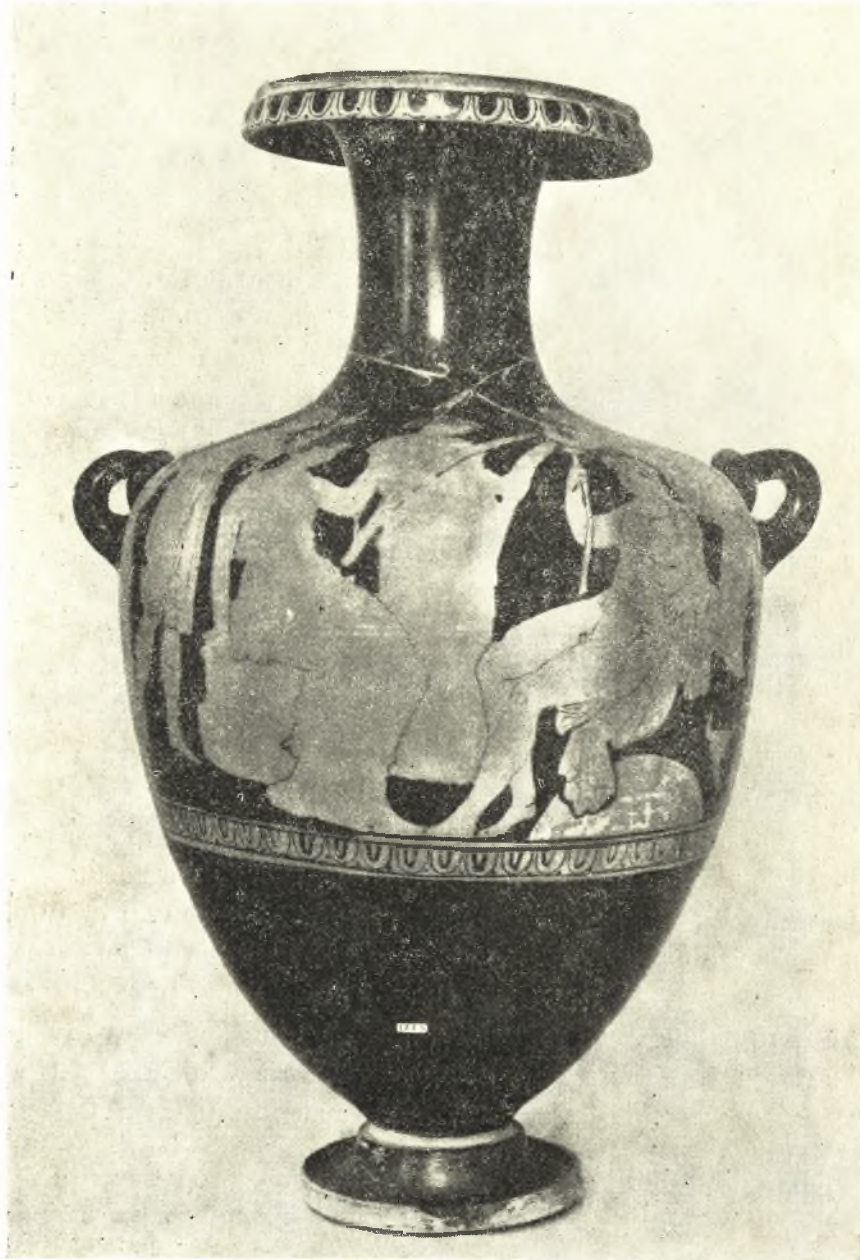
Εἰκ. 14α. Ὑδρία ἐκ Κρήτης.

Ἡ ἐπὶ τῆς ὑδρίας ταύτης παράστασις, δημοσιευθεῖσα τὸ πρῶτον ὑπὸ τοῦ ΣΒΟΡΩΝΟΥ, ἐπαναλαμβάνει τὰς γενικὰς γραμμὰς τῆς κεντρικῆς ομάδος τῶν θεῶν τῆς ὑδρίας τῆς Καπούης. Καὶ πάλιν ἔχομεν καθημένους τὴν Δήμητρα καὶ τὸν Διόνυσον