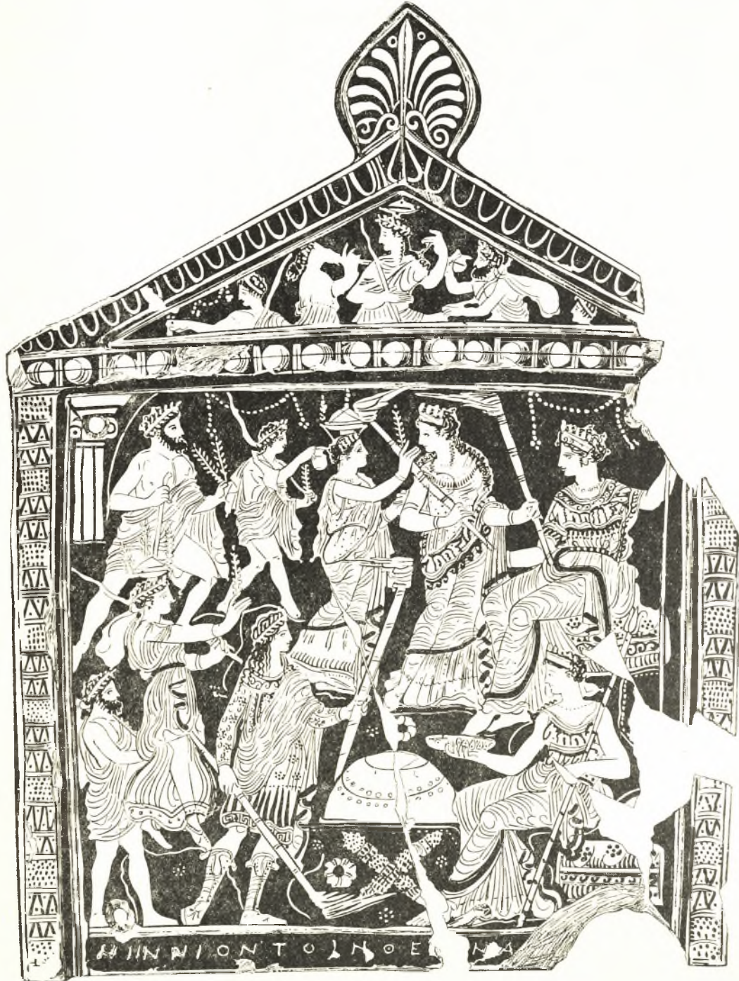
Εἰκ. 1. Πίναξ Νυννίου.

τὸν ΣΚΙΑΝ εἰς τὴν κυρίαν ὄψιν τοῦ πίνακος ἐγράφη μία καὶ μόνη ἐνιαία προᾶξις,