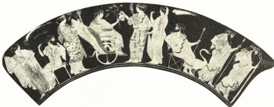
Εἰκ. 4. Κοτύλη Ἰέρωνος.

Ἀκόμη καὶ τὸν ἀμφορέα τῆς Bibliothèque Nationale ἀρ. 231, ὅπου ὁ Διόνυσος καὶ ὁ Ἀπόλλων μὲ τὴν κιθάραν τοῦ εἰκονίζονται μεταξύ γυναικῶν. Αἱ γυναῖκες αὐταὶ ἀποκαλοῦνται μοῦσαι εἰς τὴν δημοσίευσιν, ἀλλὰ Μοῦσαι τέσσαρες τὸν ἀριθμὸν εἶναι κάπως ἀσυμβίβαστοι πρὸς τὴν παράδοσιν. Πρὸς τούτοις ἡ παρουσία ἐλάφου μεταξύ τῶν μορφῶν ἀποδεικνύει ὅτι καὶ πάλιν ἔχομεν τὴν δυνάδα τῶν θεαινῶν τῶν σχετικῶν πρὸς τοὺς θεοὺς—ἦτοι Ἄρτεμιν (τῆς ὁποίας βεβαίως ἡ ἔλαφος ἦτο σύμβολον) καὶ Λητώ ἀφ' ἑνὸς καὶ ἀφ' ἑτέρου Ἀριάδην καὶ Σεμέλην 1 . Ὁ πρὸς τὰ ὀπίσω βλέπων Ἑρμῆς φαίνεται ὅτι εἶναι τύπος τῆς γραφῆς τοῦ εἰς τὸν μελανόμορφον ρυθμὸν. Τοῦτο σαφῶς ὑποδεικνύεται καὶ ὑπὸ τῆς παραστάσεως τῆς ὑδρίας Β 347, ἐκ Καμείρου, τοῦ Βρετανικοῦ Μουσείου, ὅπου ἔχομεν τὸν Ἀπόλλωνα μὲ τὴν κιθάραν τοῦ, δύο θεᾶς καὶ τὸν Ἑρμῆν. Εἰς τὴν παράστασιν αὐτὴν ἀσφαλῶς δὲν πρόκειται περὶ πομπῆς 2 .