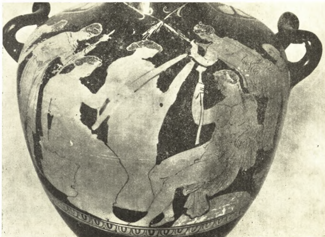
Εἰκ. 14β. Ἡ ἐπὶ τῆς ἐκ Κρήτης ὑδρίας παράστασις.

ξίαν. Εἰς τὰς τρεῖς κόρας ἴσως ἔχομεν τὰς τρεῖς θυγατέρας τοῦ Κελεοῦ τὰς ἀναφερο- μένας ὑπὸ τοῦ Πausανίου, τὴν Διογένειαν, τὴν Παμμερόπην καὶ τὴν Σαισάραν. Ὁ ἰστάμενος ἀνὴρ εἶναι βεβαίως ὁ Εὐμόλοπος. Δὲν δύναται νὰ ὑπάρξῃ ἀμφιβολία ὅτι παρὰ τὰς διαφορὰς τὸ θέμα εἶναι τὸ αὐτὸ πρὸς τὸ τῆς ὑδρίας τῆς Καπούης. Καὶ εἰς τὴν ὑδρίαν τῆς Κρήτης λοιπὸν ἔχομεν προκαταρκτικὴν ἱεροπραξίαν τῆς μύσεως τοῦ Διονύσου εἰς τὰ Μυστήρια.