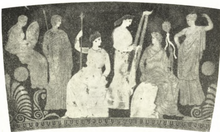
Εἰκ. 11. Ὑδρία Καπούης.

Ἡ Δημήτηρ ἐγράφη καθημένη ἐπὶ βωμοσχήμου ἔδρας, ἡ ὁποία λόγῳ τοῦ σχήματος καὶ τῆς διακοσμῆσεώς της δὲν εἶναι ἡ ἀγέλαστος πέτρα. Κρατεῖ σκῆπτρον καὶ στρέφει τὴν κεφαλὴν πρὸς τὰ δεξιὰ καὶ πρὸς τὸν καθημένον Διόνυσον. Καὶ ὁ θεός, μολονότι κάθηται πρὸς τὰ δεξιὰ, στρέφει τὴν κεφαλὴν πρὸς τὰ ἀριστερὰ καὶ πρὸς τὴν Δήμητρα. Κρατεῖ θύρσον, φέρει χειριδωτὸν χιτῶνα καὶ ἱμάτιον, εἶναι δηλαδὴ ἐνδεδυμένος κατὰ τὸν Θρακικὸν τρόπον. Τὸ κάθισμα τοῦ Διονύσου ἴσως εἶναι ὁ ὀμφαλός, δύναται ὅμως νὰ συμβολίζῃ λοφῶδες ἔδαφος. Πρὸς τὸν Διόνυσον βαίνει ἡ Κόρη κρατοῦσα ἀνημμένας δᾶδας. Ἡ κίνησις αὕτη τῆς Περσεφόνης ἐνθυμίζει τὴν ἀπεικόνισίν της εἰς τὴν σκηνὴν Β τοῦ πίνακος τῆς Νιωνίου καὶ δὲν συμφωνεῖ πρὸς