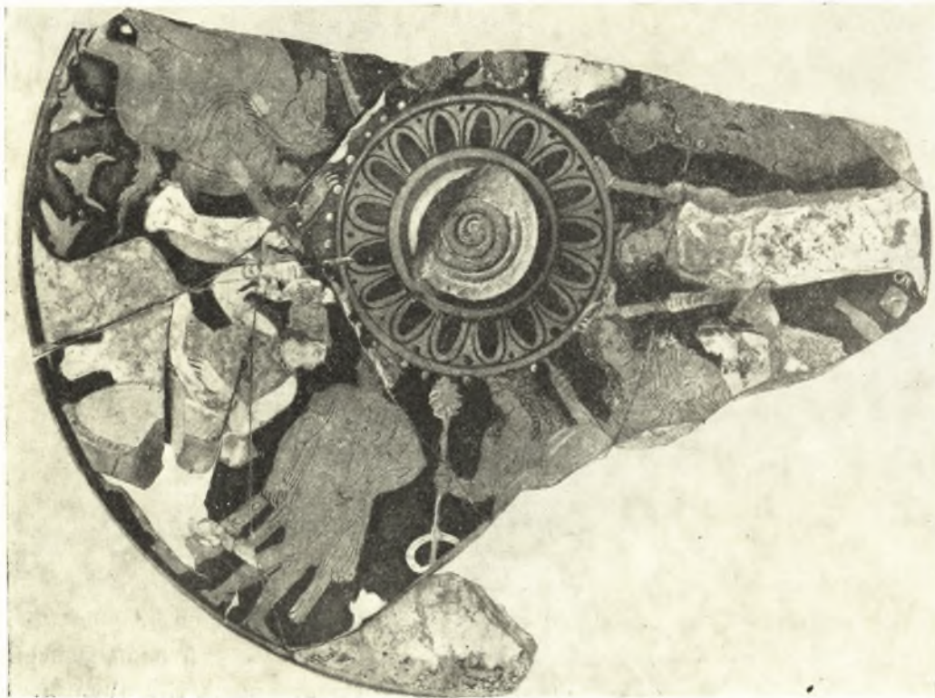
Εἰκ. 7. Κάλυμμα λεκανίδος ἐν Tübingen.

Ὁ ΜΕΤΖΓΕΡ, ἔ.ά. σ. 339, γράφει διὰ τὴν παράστασιν αὐτήν: «Le voici, par exemple, aux Mystères d'Agra présidant à l'initiation d'Héraclès et des Dioscures