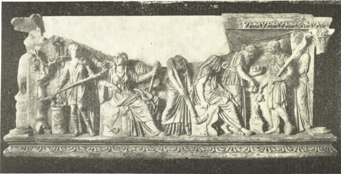
Εἰκ. 12. Σαρκοφάγος τῆς Torre Nova.

καὶ εἰς προκαταρκτικὴν πράξιν τῆς μνήσεώς του. Βεβαίως ὁ Ἡρακλῆς ἔχει τὴν κεφαλὴν κεκαλυμμένην καὶ πατεῖ ἐπὶ τοῦ Διὸς κοδίου, ἀλλ' ὁ ἦρωας ἔπρεπε προτοῦ μνηθῆναι καθαρισθῆναι ἀπὸ τοῦ μίσους τοῦ αἵματος τοῦ κενταύρου. Ὁ Διόνυσος δὲν πρόκειται νὰ ἀπαλλαγῆ τοιοῦτου μίσους. Τὸ ὅτι αὐτὴ ἡ Περσεφόνη ἐκτελεῖ τὸ τυπικὸν τοῦτο μέρος ἀποδεικνύει ὅτι πρόκειται περὶ τῶν μικρῶν Μυστηρίων, εἰς τὰ ὅποια προϊστατο. Κατὰ τὸν αὐτὸν τρόπον ἡ Περσεφόνη φαίνεται ὡς ὑδρανὸς εἰς τὸ γνωστὸν ἀνάγλυφον τῆς Ἐλευσίνας (εἰκ. 13) 1 . Ἡ Δημήτηρ εἶναι παροῦσα εἰς τὴν τελετὴν ὡς τιμωμένη θεά, ὅπως καὶ εἰς τὴν παράστασιν Β τοῦ πίνακος τῆς Νιωνίου. Διὰ τοῦτο κάθεται ἐπὶ βωμοσχήμου ἔδρας καὶ οὐχὶ χαμαὶ ἐπὶ τῆς γῆς ἢ ἐπὶ τῆς Ἀγελάστου Πέτρας. Ἡ στάσις τῆς Περσεφόνης δὲν συμβιβάζεται πρὸς τὴν ἀντίληψιν τῆς παραστάσεως θείας τριάδος καὶ δι' ἓνα ἀκόμη λόγον: Καθὼς ἡ Κόρη κινεῖται