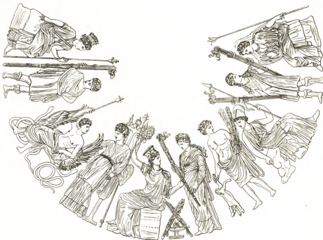
Εἰκ. 8. Ὑδρία Κύμης.

5. Ἐνδιαφέρουσαν ἀναπαράστασιν τοῦ αὐτοῦ θέματος, συμφωνοῦσαν περισσότερον πρὸς τὴν τῆς ληκύθου τοῦ Λούβρου, ἔχομεν ἐπὶ τοῦ ὄμου τῆς ὑδρίας τῆς Κύμης (εἰκ. 8) τοῦ β' ἡμίσεος τοῦ 4 ου αἰῶνος 1 . Νομίζω ὅτι ὁ ΣΒΟΡΩΝΟΣ εἶχε δίκαιον ὅταν διέκρινε τὴν ὅλην εἰκόνα εἰς τρεῖς διαφόρους παραστάσεις, εἰς κεντρικὴν καὶ εἰς δύο πλαγίας ἴσως δὲ καὶ δευτερευούσης σημασίας παραστάσεις, ἐκά-