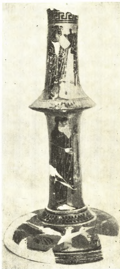
Εἰκ. 3. Πήλινον θυμιατήριον Ἐλευσίνος.