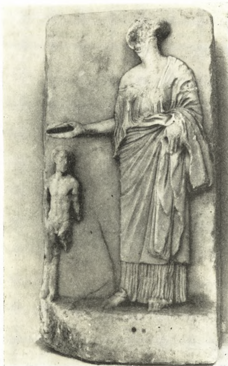
Εἰκ. 13. Περσεφόνη ὡς ὑδρανός.

ρίνης στέφανον διὰ τὸν μύστην, ἐν ᾧ ἡ Δημήτηρ παρακολουθεῖ τὰ γινόμενα. Ὅπως εἰς τὸν σκύφον οὕτω καὶ εἰς τὴν ὑδρίαν τῆς Καπούης ὁ Διόνυσος εἶναι μύστης καὶ οὐχὶ θεὸς τῶν Μυστηρίων. Κρατεῖ βεβαίως τὸν θύρσον του, διότι εἶναι τὸ σύμβολον