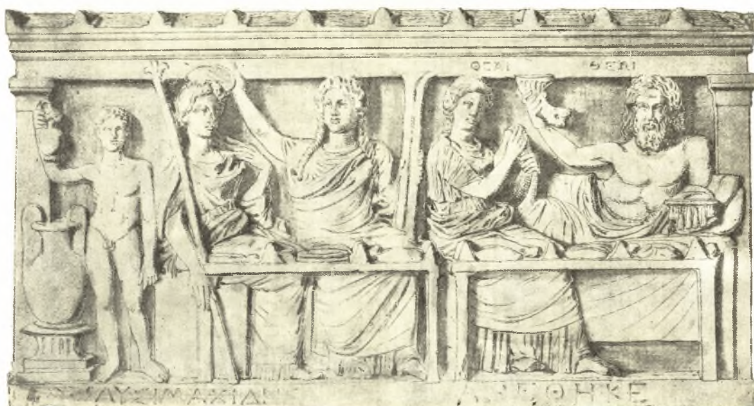
Εἰκ. 16. Ἀνάγλυφον τοῦ Λυσιμαχίδου.

11. Τὸ ἀνάγλυφον τοῦ Λυσιμαχίδου τοῦ Ἀρχαιολογικοῦ Μουσείου Ἀθηνῶν (εἰκ. 16) 1 .