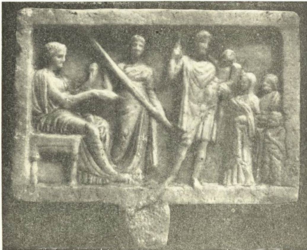
Εἰκ. 22. Ἀνάγλυφον Ἀγορᾶς.

κέρας τῆς Ἀμαλθείας, ὁ βαστάζων δ' αὐτὸν δαίμων πιθανώτατα εἶναι ὁ Ἰακχος, ὡς συνεπέρανεν ὁ THOMPSON. Κατὰ τὸν Πausανίαν (I 2, 4) οὐχὶ μακρὰν τῆς Ἀγορᾶς, ἐσελθόντων... ἐς τὴν πόλιν, ὑπῆρχε ναὸς τῆς Δήμητρος καὶ εἰς αὐτὸν ἀπέκειντο ἀγάλματα τῆς θεᾶς, τῆς Κόρης καὶ τοῦ Ἰάκχου φέροντος μίαν καὶ μόνην δᾶδα, ἔργα τοῦ Πραξιτέλους. Ὁ βραχὺς χιτῶν καὶ τὸ ἐπένδυμα, τὸ ὁποῖον φέρει, ὑπενθυμίζουν τὸν δαδουχοῦντα Ἰακχὸν τῶν ἀγγειογραφιῶν καὶ τοῦ πίνακος τῆς Νειννίου. Ὁ THOMPSON προσφύεστατα ὑπέμνησε τὸ σχόλιον εἰς τοὺς Βατράχους τοῦ Ἀριστοφάνους (στ. 479),