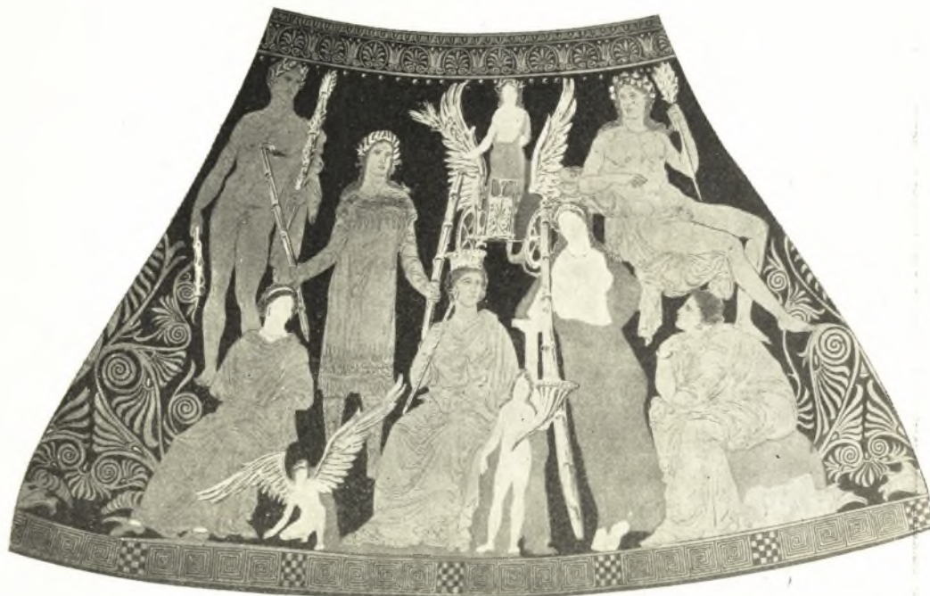
Εἰκ. 10. Περίκη ἐκ Παντικαπαίου. Ermitage. Ὅψις Α.

ναίοι και οί Ἐλευσίνιοι εἶχον ἀποφασίσει πρὸ τῶν μέσων τοῦ αἰῶνος ἐκείνου 1 , ἦτο γνωστὴ εἰς πάντας και βεβαίως μεθ' ὑπερηφανείας θὰ ἠδύνατο νὰ γραφῆ ὡς ὀρίζουσα τὸ ἱερὸν τῆς Ἐλευσίνας. 3) Ὁ κενὸς πρὸ τῆς καθημένης Δήμητρος «θρόνος», ὁ ἐπαναλαμβάνων τὴν αὐτὴν διάταξιν τὴν συναντωμένην εἰς τὴν παράστασιν Α τοῦ πίνακος τῆς Νιωνίου. Ὡς εἶδομεν ἐκεῖ, εἶναι ὁ «θρόνος» τῆς Περσεφόνης και πρὸς αὐτὸν βαίνει ἡ κόρη τῆς παραστάσεως τοῦ κρατῆρος κρατοῦσα δᾶδα 2 . Ἡ Δημήτηρ δὲν τὴν ἔχει ἀντιληφθῆ ἀκόμη και προσέχει εἰς τὰ ὑπὸ τοῦ Τριπτολέμου λεγόμενα. Κατὰ ταῦτα πιστεύω ὅτι εἰς τὸν κρατῆρα εἰκονίζεται ἡ προσέλευσις τῶν ἡρώων πρὸς μύησιν, ἔχομεν δηλαδὴ εἰς αὐτὸν παράλληλον παράστασιν τῆς ἐπὶ τῆς κάτω ζώνης