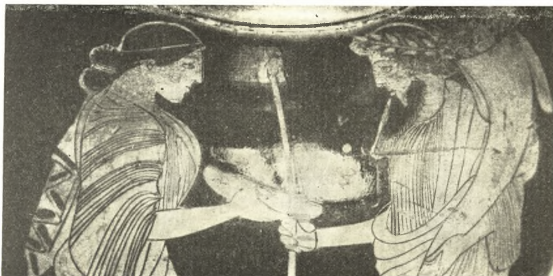
Εἰκ. 18. Ἀμφορεὺς τοῦ Λούβρου.

Εἰς τὸ μέσον τῆς παραστάσεως ἐγράφη μέχρι τῆς ὀσφύος γυνὴ ἀνερχομένη ἐκ τοῦ ἐδάφους (πιθανῶς ἡ Γῆ) καὶ προτείνουσα βρέφος εἰς τὴν Ἀθηνᾶν. Παρὰ τὴν