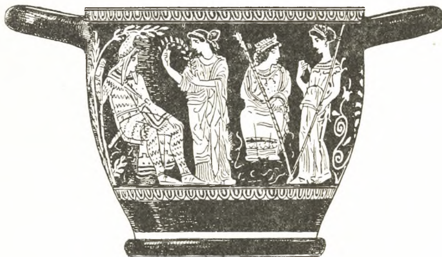
Εἰκ. 6. Σκύφος Βερολίνου.

ἔχομεν τὸν Διόνυσον καὶ τὸν Ἡρακλέα ὡς μύστας τῶν Μυστηρίων καὶ οὐχὶ ὡς λατρευομένους θεούς. Βεβαίως ἡ Ἀθηνᾶ ἐτέθη ὡς συμβολίζουσα τὴν στενὴν συγγένειαν τῆς Ἐλευσίνοσ πρὸς τὰς Ἀθήνας. Ἡ γραφή τοῦ Τριπτολέμου ὑποδεικνύει καὶ πάλιν ὅτι εἰς τὴν λήκνυθον ἔχομεν ἀναπαράστασιν ὅχι τῶν Ἐλευσινίων θεῶν ἀλλὰ τῶν Ἐλευσινίων θεαινῶν, τῆς Ἀθηνᾶς καὶ τῶν δύο θείων μυστῶν τῆς Ἐλευσινιακῆς λατρείας. Φαίνεται ὅτι ὁ λόγος τοῦ δαδούχου Καλλία πρὸς τοὺς Λακεδαιμονίους, εἰς τὸν ὁποῖον τοὺς ὑπεμίμησε τὰς μεγάλας πρὸς τοὺς προπάτοράς των ὑπηρεσίας τῆς Ἀθηναϊκῆς - Ἐλευσινιακῆς πολιτείας καὶ τὸν ὁποῖον διεφύλαξεν ἐν μέρει ὁ Ξενοφῶν ἔκαμε μεγάλην ἐντύπωσιν 1 . Ἰδίᾳ ἢ περικοπῇ: λέγεται μὲν Τριπτόλεμος