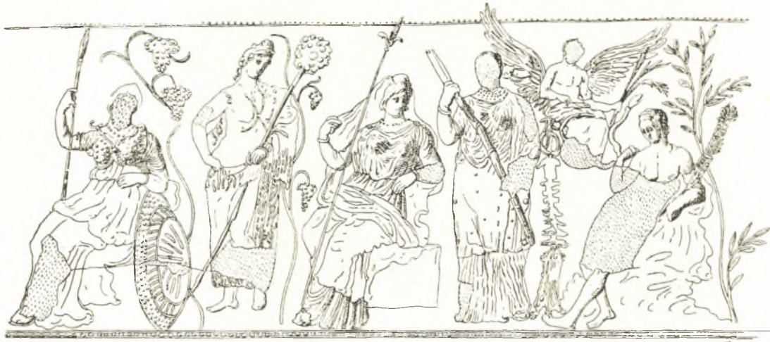
Εἰκ. 5. Σχεδίασμα τῆς ἐπὶ τῆς ληκύθου τοῦ Λούβρου παραστάσεως.

Ὁ Διόνυσος ὁμοιος τῆς ληκύθου, ὡς ὀρθῶς παρατήρησεν ὁ ROTTIER. ἐγράφη ὡς μύστης φέρων στέφανον μυρρίνης και νεβρίδα και οὐχὶ ὡς ἰσότημος θεὸς τῆς Δήμητρος. Ἰσταται ὀλίγον τι πρὸς τὰ ὀπίσω τῶν καθημένων θεαινῶν, αἱ ὁποῖαι δὲν τοῦ δίδουν καμμίαν σημασίαν. Προφανῶς σχετίζεται πρὸς τὸν νέον τὸν γραφέντα εἰς τὸ δεξιὸν ἄκρον τῆς παραστάσεως, ὁ ὁποῖος, καθὼς και ὁ θεός, ἀποδεικνύεται ὡς μύστης ἐκ τοῦ βάχχου τὸν ὁποῖον φέρει. Τὸν νέον τοῦτον ὁ μὲν ROTTIER ἐδέχθη ὡς τὸν