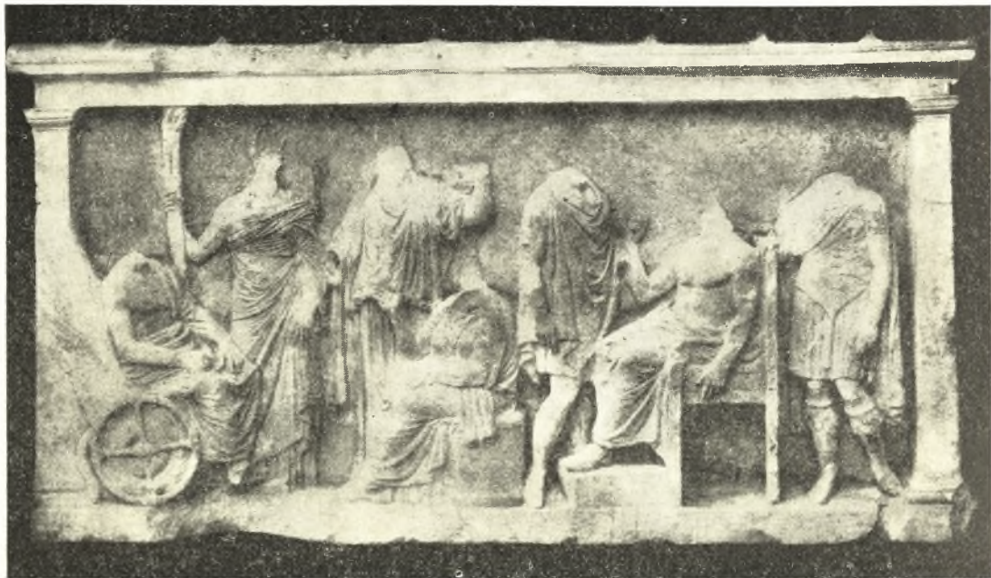
Εἰκ. 15. Ἀνάγλυφον Mondragone.

Ἡ παράστασις τοῦ ἀναγλύφου ἀποτελεῖται ἀπὸ δύο μέρη, ἡ ἐρμηνεῖα τῶν ὁποίων εἶναι δύσκολος. Τέσσαρες μορφαὶ παρίστανται εἰς τὸ πρῶτον μέρος: Ὁ Τριπτόλεμος παρεστάθη καθήμενος ἐπὶ τοῦ ἄρματός του, ἡ Κόρη ἴσταται παρ' αὐτὸν φέρουσα διπλὴν δᾶδα ἀνημμένην. Παρ' αὐτὴν ἴσταται ἑτέρα θεὰ καὶ μετ' αὐτὴν ἡ Δημήτηρ καθήμενη, ἐστραμμένη δὲ πρὸς τὸν Τριπτόλεμον. Τὸ δεξιὸν μέρος τοῦ ἀναγλύφου περιλαμβάνει τρεῖς ἀνδρικός μορφάς. Θεὸς κάθηται εἰς θρόνον μεταξὺ τῶν ἱσταμένων νέων. Ἡ ταυτότης τοῦ πρὸ τοῦ καθήμενου θεοῦ νέου εἶναι ἄγνωστος, ἴσως εἶναι Ἐρμῆς ἢ Ἀπόλλων· ὁ ὀπισθεν τοῦ θρόνου ἱστάμενος καὶ στηρίζων τὴν