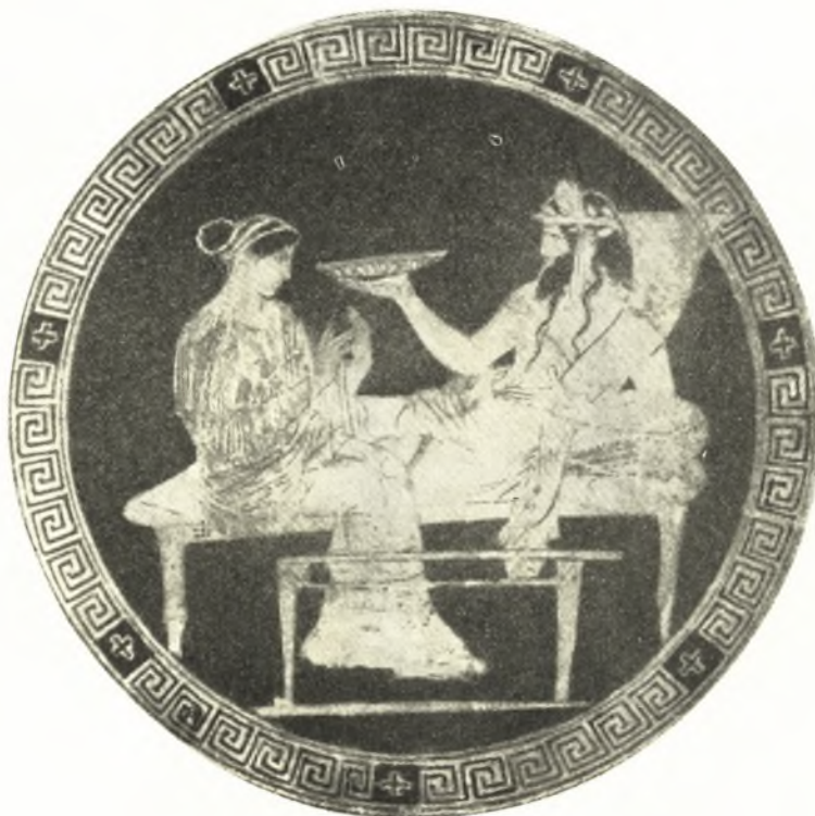
Εἰκ. 17. Κύλιξ τοῦ Κόδρου

κος Ε 82 τοῦ Βρετανικοῦ Μουσείου (εἰκ. 17). Ἐνωθεν ὁμοῦ τῶν μορφῶν τῆς κύλικος εἶναι γεγραμμένα τὰ ὀνόματα Φερέφαιτα - Πλούτων καὶ οὐχὶ Διόνυσος. Καὶ ὁ Πλούτων τοῦ Κόδρου κρατεῖ κέρας Ἀμαλθείας ἀλλὰ κατὰ τὸν METZGER, παρὰ τὴν ἐπιγραφὴν, εἶναι ὁ χθόνιος Διόνυσος, διότι φέρει στέφανον ἐκ κισσοῦ. Ὁ στέφανος ὁμοῦ ἐκεῖνος δὲν εἶναι ἐκ κισσοῦ ἀλλ' ἐκ μυρρίνης, ἱερᾶς τῆς Περσεφόνης καὶ τῆς Δήμητρος καὶ συμβολικῆς τῆς λατρείας των. Τὸ ὅτι ἐνίοτε ὁ Πλούτων ἔφερε στέφανον μυρρίνης, ὅτε εὐρίσκετο μὲ τὴν Περσεφόνην, ἀποδεικνύεται καὶ ἀπὸ τὸν ἐρυθρόμορφον ἀμφορέα τοῦ Λούβρου G 209 (εἰκ. 18), εἰς τὸν ὁποῖον ἀπεικονίσθη τὸ