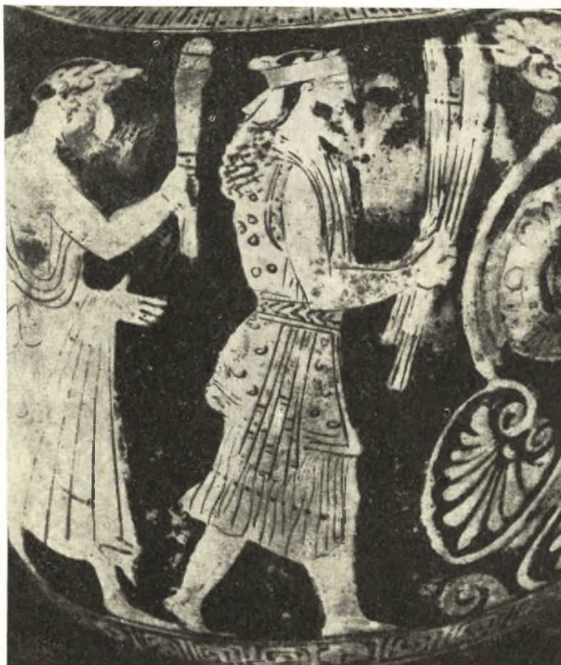
Εἰκ. 2. Δαδούχος Ἐλευσίνος.

πρὸς τὴν στολὴν τοῦ Δαδούχου. Πρὸς τούτοις αὐτὸς ὁ ΣΒΟΡΩΝΟΣ παρατήρησεν ὅτι «οἱ προσκυνηταὶ..... εἰκονίζονται ὑπὸ τοῦ πινακογράφου..... εἰς μέγεθος πολὺ μικρότερον τῶν δύο θεαινῶν τῆς ἄνω ομάδος καὶ τῆς κάτω ἐν τῇ σκηνῇ». Τὴν παρατήρησίν του αὐτὴν δὲν ἀκολουθεῖ καὶ εἰς τὴν περίπτωσιν τοῦ δαδουχοῦντος νέου, διότι καὶ αὐτὸν ὁ «πινακογράφος» ἔγραψεν εἰς μέγεθος μεγαλύτερον τῶν προσκυνητῶν καὶ ἴσον πρὸς τὸ τῶν δύο θεαινῶν. Ἡ παραβολὴ του πρὸς τὴν ἰσταμένην Περσε-