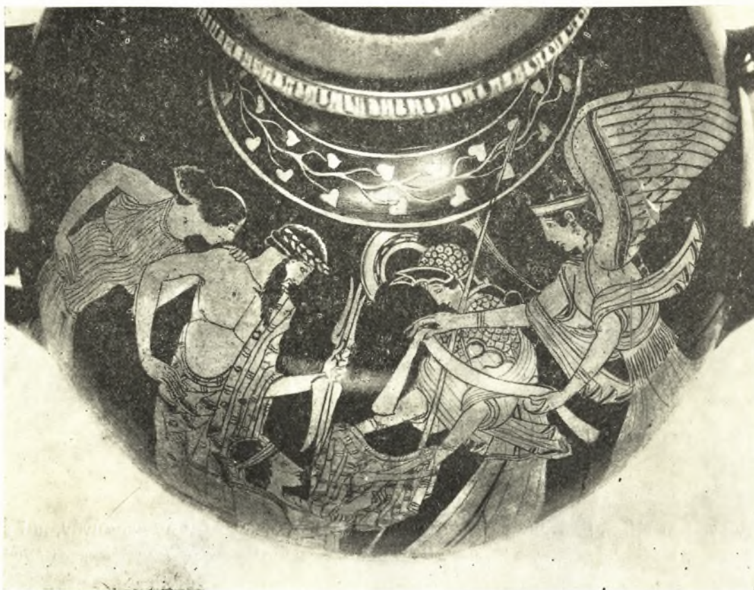
Εἰκ. 19. Ὑδρία Βρετανικοῦ Μουσείου Ε 182.

Ἡ ἐπὶ τῆς πελίκης παράστασις αὕτη ἡρμηνεύθη διαφοροτρόπως ὑπὸ τῶν μελετητῶν. Ὁ STEPHANI, ὁ ὁποῖος καὶ πρῶτος ἐδημοσίευσε τὴν πελίκην, ὑπεστήριξεν ὅτι