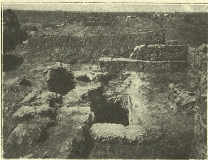
Εἰκ. 3. Ὁ περὶ τὴν κάθοδον τῆς κρήνης χώρος.

Περὶ τὸ στόμιον τῆς ὑπογείου δεξαμενῆς, ἀφαιρεθέντος τοῦ ξένου χώματος, ἀπεκαλύφθη τοῖχος περιφράσεων τὴν κατάδοσιν, ἔχων δὲ αὐτὴν οὐχὶ ἐν συμμετρικῇ ἐν τῷ μεταξὺ χώρῳ θέσει. Ἐν τῷ βορείῳ ἡμίσει εὐρέθη κατὰ χώραν ἐπίστρωμα τοῦ ἐδάφους ἐξ ἀργολίθων, πρὸς τῇ βάσει δὲ τοῦ τοίχου λείψανον λευκοῦ ἐπιχρίσματος καὶ κονιάματος (εἰκ. 3).