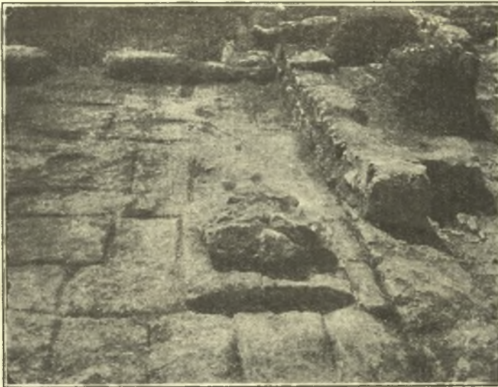
Εἰκ. 52. Πλακόστρωτος αὐλὴ μετὰ φρέατος.

τὸν ἄξονα τῆς καθόδου τῆς κρήνης ἔδειξεν ὅτι ὁ ὑπόγειος δρόμος ἔξακολουθεῖ πρὸς δυσμὰς, ἔχοντες δὲ ὑπ' ὄψει ὅτι τὸ μήκος τοῦ ὑπὸ τὴν γῆν δρόμου τῆς κρήνης εἶναι 8,20, ἡ δὲ ἀπόστασις τοῦ φρέατος ἀπὸ τῆς θύρας τῆς κρήνης (πρβ. ΠΑΕ 1914 σ. 136) περίπου μέτρα 10.50, παρατηροῦμεν ὅτι δὲν ὑπολείπεται πολλή ἐργασία μέχρι τῆς συναντήσεως τοῦ καταγωγοῦ τοῦ φρέατος ἢ ἀκριδέστερον τῆς δεξαμενῆς, εἰς ἣν κατέληγεν ὁ καταγωγός. Ὅμοίως λαξευτῆς κρήνης μετὰ φρέατος παράδειγμα εἶναι ἡ ἐν