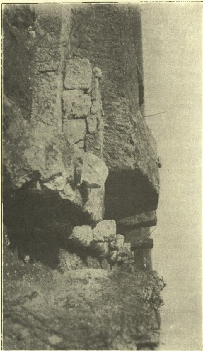
Εικ. 1. Μίθος τοῦ περιβόλου τῆς κρήνης καὶ βορεῖα πλάτη τοῦ περιστερίου.