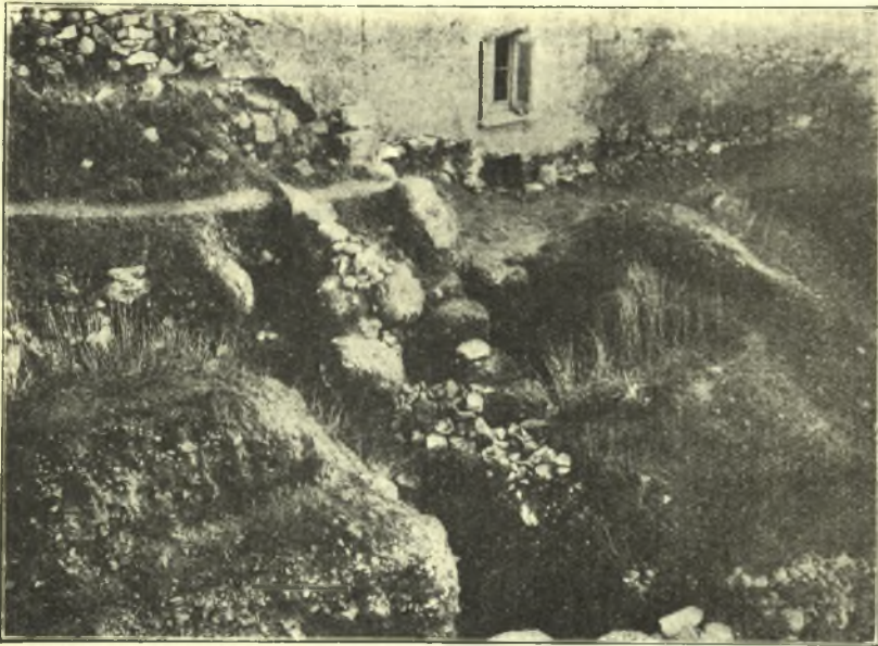
Εἰκ. 1. Τμήμα τοίχου Μ. πλευρᾶς τοῦ Ὡδείου.

Ὁ ἀνακαλυφθεὶς οὗτος τοῖχος τοῦ μεσημβρινοῦ ἡμίσεος τοῦ Ὡδείου φαίνεται ὅτι ἐπεσκευάσθη εἰς μεταγενεστέρους χρόνους, χρησιμοποιηθέντος ἀρχαίου ὕλικου ἐξ ἄλλων οἰκοδομημάτων ληφθέντος, ὡς καὶ ἐξ αὐτοῦ τοῦ Ὡδείου, πλὴν τῶν κάτω δόμων, οἵτινες φαίνονται ὅτι εἶναι οἱ ἀρχικοὶ ἀποτελούμενοι ἐκ μεγάλων κατειργασμένων λίθων, ἀλλ' οὐχὶ ὑμηττίου λίθου (λατομείου Καρᾶ), ὡς βλέπομεν ἐπὶ πάντων τῶν ἐν τῇ Ἀκροπόλει κρηπιδωμάτων τῶν ἐπὶ Περικλέους χρόνων. Ἀλλὰ καὶ οὕτως ἔχον τὸ κρηπίδωμα τοῦ τοίχου τούτου φρονοῦμεν ὅτι δὲν εἶναι τοῦ ἐπὶ Ἀριοβαρζάνου ἀνοικοδομηθέντος Ὡδείου.