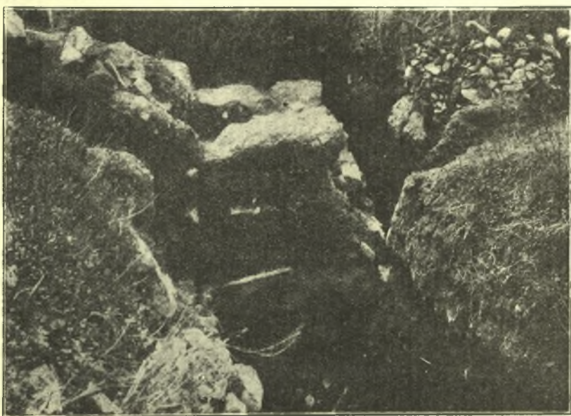
Εἰκ. 2. Τμήματα τοῖχου Δ. πλευρᾶς τοῦ Ὡδείου.

Διὰ τῆς ἐξερευνήσεως τοῦ πέραν τοῦ Προπύλου χώρου θέλομεν διευκρινίσει τὸ ζήτημα τοῦτο, ὅταν ἡ Ἀρχαιολογικὴ Ἐταιρία εἰς εὐθετώτερον