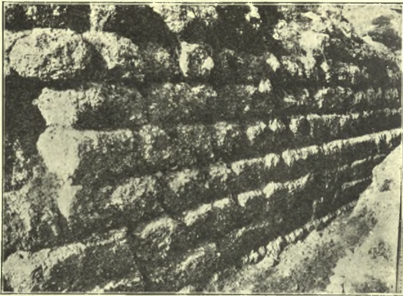
Εἰκ. 4. Τὸ ἀνατολικὸν ἀνάλημμα τοῦ Διονυσιακοῦ Θεάτρου.

᾿Ωδεῖον νὰ ἀνεκτίσθῃ ἐπὶ τῶν ἰδίων θεμελίων τοῦ ὑπὸ Περικλέους ἰδρυθέντος. Εἶναι ἀληθές ὅτι ἐν τῇ προγενεστέρᾳ ἐκθέσει ἡμῶν εἶπομεν ὅτι δὲν ἦτο τετράγωνον, ἀλλὰ παραλληλόγραμμον, ἐκλαβόντες τὸ τοίχιον τοῦτο ὡς τῆς μεσημβρινῆς πλευρᾶς, δι' οὗ ὠρίσαμεν καὶ τὰς διαστάσεις τοῦ κτιρίου, ἀλλ' ὁμολογοῦμεν νῦν ὅτι ἐπλανήθημεν τότε, διότι τὸ τοίχιον τοῦτο ἦτο τοῦ αὐτοῦ πάχους καὶ τὸ ὕλικόν ἐξ ἀρχαίων εἰργασμένων λίθων καὶ ὁμοίαζε καταπληκτικῶς πρὸς τὰ ἄλλα σωζόμενα σκέλη, ἤτοι τοῦ Β. καὶ Δ. ᾿Αλλ' ἤδη