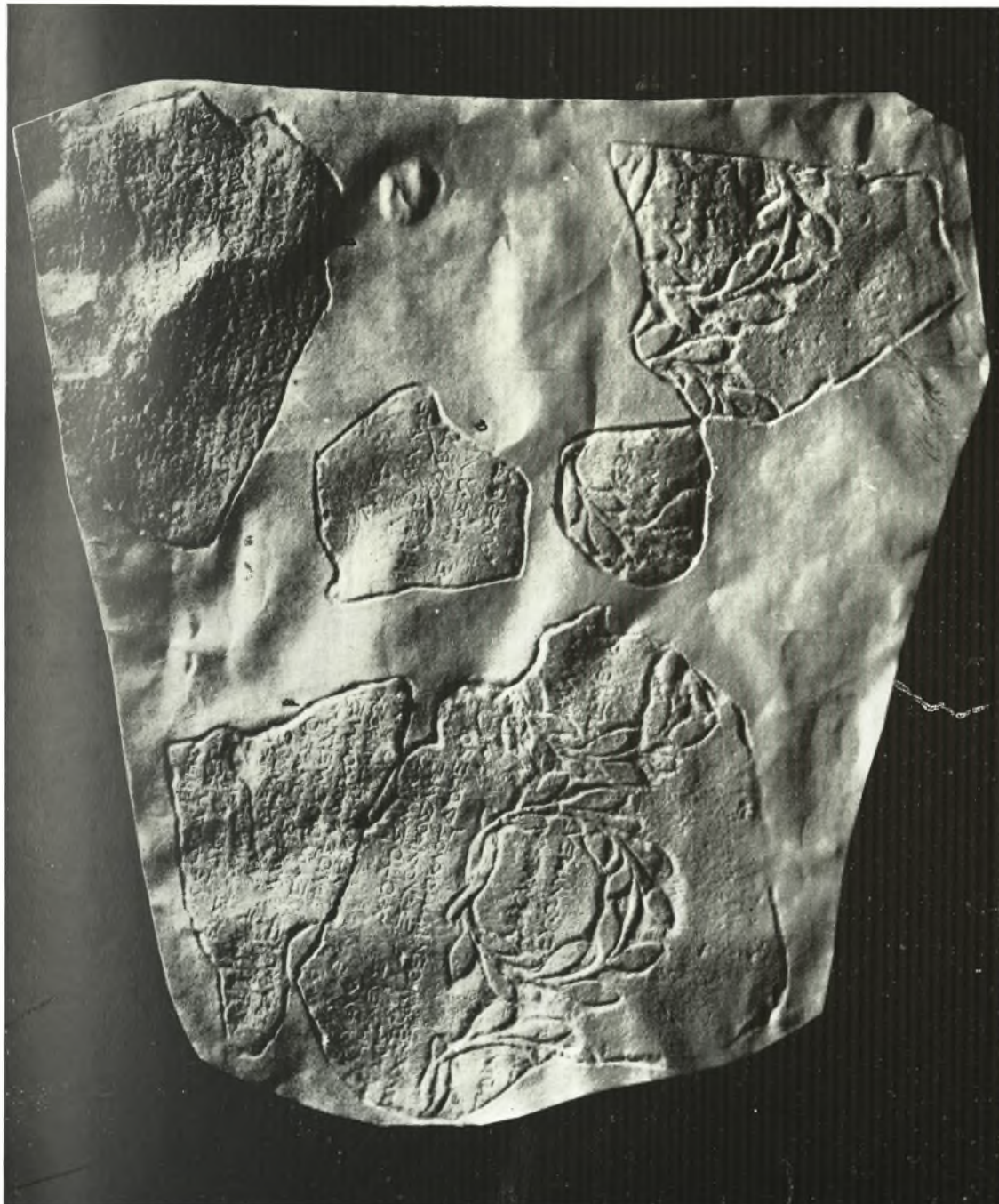
Τὸ κάτω μέρος τῆς ἐν IG II 2 1006 ἐπιγραφῆς. (Φωτογραφία ἐξ ἐκτύπου)