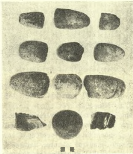
Εἰκ. 5. Νεολιθικοὶ πελέκεις, ρόπαλα καὶ πυρῆνες ὀψιδιανοῦ ἐκ Κατσαμπᾷ. (Τὰ πλείστα ἐκ τῆς οἰκίας).