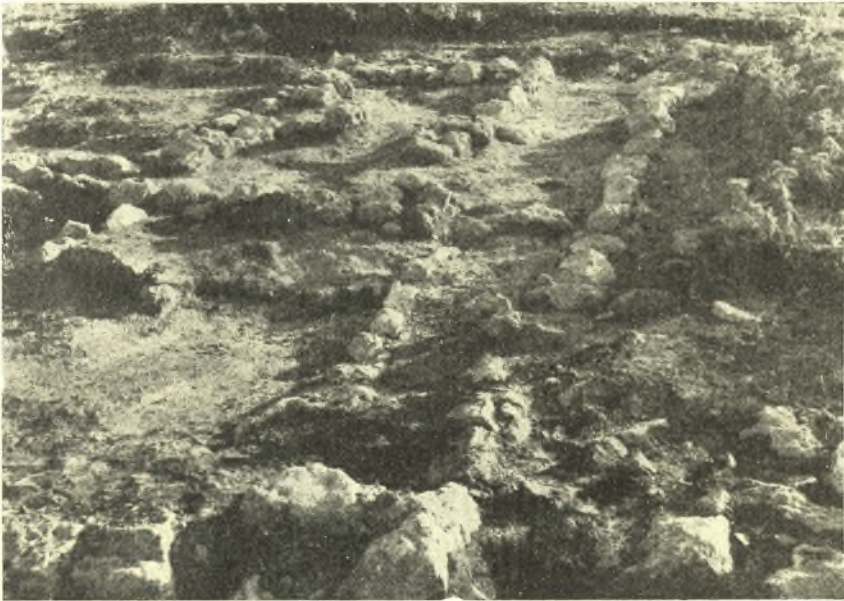
Εἰκ. 3. Ἐλπίς τῆς νεολιθικῆς οἰκίας Κατσαμπᾷ κατὰ τὴν ἀνασκαφήν.

Μὲ τὴν πρόοδον τῆς ἀνασκαφῆς καὶ τὸν καθαρισμὸν τῆς νεολιθικῆς οἰκίας διεφωτίσθη ἡ διάταξις αὐτῆς (εἰκ. 2, 3). Ἡ οἰκία εἶχε περιβόλον, ὅστις κατὰ τὴν νοτίαν πλευρὰν ἠρείδετο ἐπὶ τοῦ βράχου. Αἱ τρεῖς ἄλλαι πλευραὶ, ὧν ἑκάστη ἔχει μῆκος περίπου 7 μ., ἀπαρτίζονται ἐκ σειρῶν ἀργῶν λίθων, οἱ ὁποῖοι ἐχρησίμευον ὡς βάσεις πλινθίνων τοίχων.