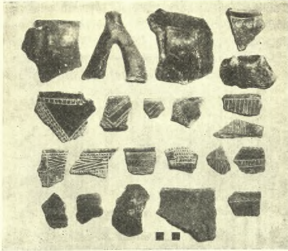
Εἰκ. 4. Ὅστρακα τῆς « μέσης νεολιθικῆς » περιόδου ἐκ τῆς οἰκίας Κατσαμπᾷ.

κεραμεικῆς καὶ ἀρκετὰ λίθινα ἐργαλεῖα, ἀπέδωσε καὶ ἐφέτος δύο λιθίνους πελέκεις καὶ κεραμεικὴν. Ἐκ τῆς μελέτης τῆς κεραμεικῆς προκύπτει ὅτι ἡ