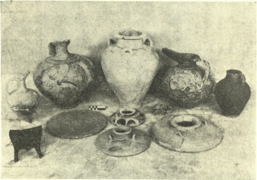
Εἰκ. 6. Ἀνακτορικὴ κεραμικὴ ἐκ τοῦ τάφου Ζ Κατσαμπᾶ.

οἰκία χρονολογεῖται κατὰ τὴν μέσην νεολιθικὴν περίοδον, χαρακτηριζομένη κατὰ τὴν ταξινομήσιν τοῦ EVANS (Palace of Minos I σ. 36, εἰκ. 8), ἐκ τῆς πλουσίας χαρακτῆς καὶ ἐνθέτου διακοσμῆσεως. Ὅτι πάντα τὰ κινητὰ εὐρήματα τῆς οἰκίας, κεραμικὴ καὶ λίθινα ἐργαλεῖα (εἰκ. 4, 5), ἀνήκουν εἰς μίαν καὶ τὴν αὐτὴν περίοδον δὲν δύναται νὰ ὑπάρξῃ ἀμφιβολία, διότι πενιχρὰ καλύβη, ὡς ἡ παρούσα, δὲν ἦτο δυνατόν νὰ κατοικηθῆ ἐπὶ λίαν μακρὸν διάστημα. Ὡς πρὸς τὴν ἀπόλυτον χρονολογίαν πρέπει νὰ εἴμεθα ἐπιφυλακτικοί, κατόπιν τῶν γενομένων ἐπὶ τοῦ θέματος τούτου συζητή-