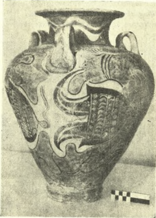
Εἰκ. 7. Ἀνακτορικὸς ἀμφορεὺς μετὰ παραστάσεις κροῶν ἐξ ὀδόντων ἀγριοχοίρου.

Περαιτέρω ἔρευνα διὰ δοκιμαστικῶν τάφρων πρὸς ἀνακάλυψιν καὶ νέων τάφων ἐδυσκολεύθησαν μεγάλως λόγῳ τῆς τεραστίας ἐπιχώσεως. Οὐδαμοῦ συνητήθη βράχος μέτρι βάθους δύο μέτρων καὶ πλέον, πιθανὰ δὲ δάπεδα τάφων θὰ εὐρίσκοντο εἰς βάθος κάτω τῶν ἕξ μέτρων. Ἐξ ἑτέρου διεπιστώθη ὅτι ἡ περαιτέρω ἐπιφάνεια τοῦ ἐκ κούσκουρα πετρώματος τῆς κλιτύος, ὅπου πιθανῶς ἐλαξεύθησαν κατὰ τὴν ἀρχαιότητα τάφοι, εὐ-