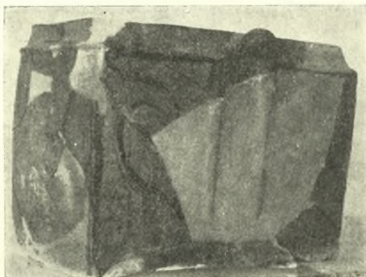
Εἰκ. 6. Συγκροτηθὲν ὑπομινωικῶν χρόνων κιβατιόσχημον σκεῦος ἐκ τοῦ θολωτοῦ τάφου Γ Συκιᾶς - Ἀδρομύλων.

ὁποίων τινὰ εἶναι ἀξιόλογα. Τὰ ἀνευρεθέντα ἀγγεῖα δὲν εἶναι ὀλιγώτερα τῶν ἑκατὸν ὀγδοήκοντα. Δύο χρυσοὶ δακτύλιοι μὲ ἑλλειψοειδῆ ἀκόσμητον