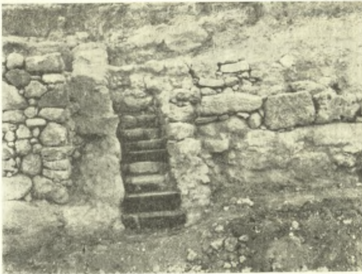
Εἰκ. 3. Ἡ ἀποκατασταθεῖσα κλιμακίς τῆς δυτικῆς πτέρυγος τῆς μινωικῆς Ἐπαύλεως Σητείας.

Τὰ κινητὰ εὐρήματα ὑπῆρξαν ὀλίγα καὶ ὄχι σημαντικά (μαχαίριον, κύπελλα καὶ ἄλλα μικρὰ ἀγγεῖα, πιθίσκος), διὰ τούτων ὅμως ἐπεβεβαιώθη ἡ χρονολογία τῆς Ἐπαύλεως, τῆς ὁποίας, διὰ τῆς γενομένης ἐφέτος ἐρεύνης, ἀπεπερατώθη ἡ ἀνασκαφή.