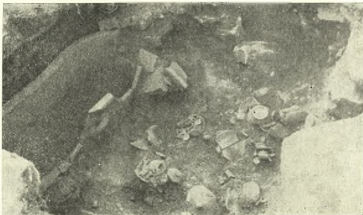
Εἰκ. 5. Ὁ θάλαμος τοῦ θολωτοῦ γεωμετρικοῦ τάφου Β περιοχῆς Συκιᾶς - Ἀδρομύλων.

μόνον εἰς ἀνευρέθη ἄθικτος· οἱ λοιποὶ εἶχον συληθῆ παλαιόθεν. Παρὰ τὴν σύλησιν ὅμως ἀπέδωσαν συνολικῶς ὄχι ὀλίγα κτερίσματα, μεταξὺ τῶν