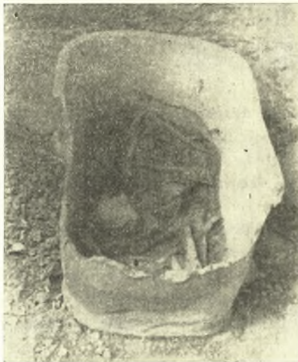
Εἰκ. 7. Ἡ ΥΜ III λάρναξ τοῦ μινωικοῦ τάφου Καντέμη Κεφάλας - Ἀδρομύλων.

Ἄλλη ὁμὰς τάφων, τῶν αὐτῶν χρόνων καὶ ἀναλόγου χαρακτῆρος,