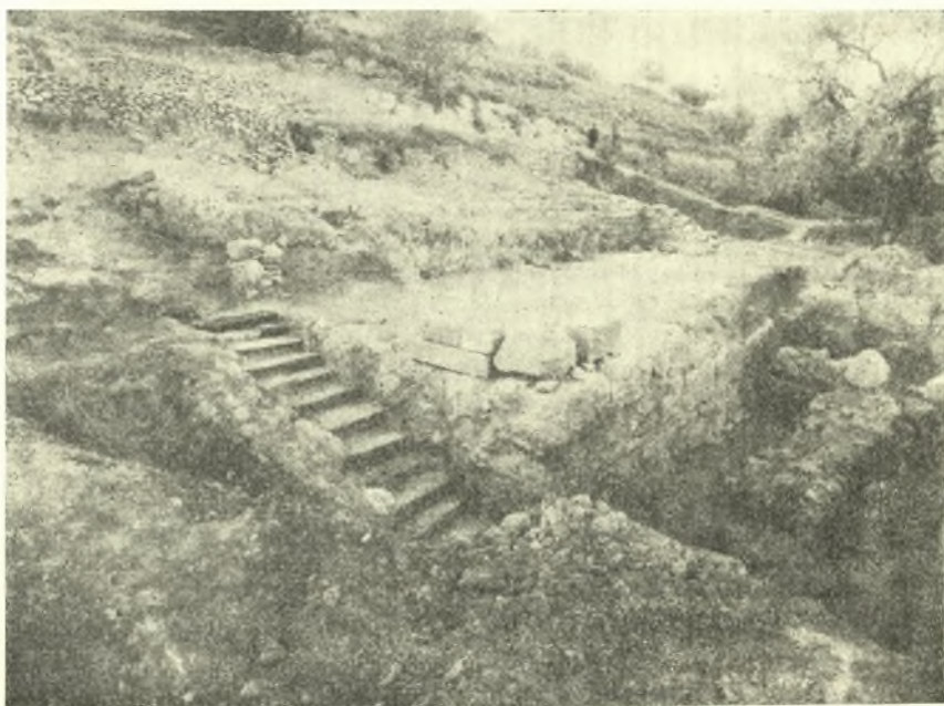
Εἰκ. 1. Μινωικὴ ἑπαυλις Σητείας. Ὅψις ἀπὸ Ν. Α.

Ἡ ἔρευνα εἶχεν ὡς πρόγραμμα νὰ συμπληρώσῃ τὰς ἀπὸ δύο ἐτῶν ἀρξαμένης ἐργασίας εἰς τὴν Μινωικὴν Ἑπαυλίαν Σητείας καὶ νὰ ἐπεκταθῇ εἰς εὐρύτεραν ἀκτίνα τῆς περιοχῆς Σητείας, εἰς τὰ σημεῖα ὅπου εἶχον ἔλθει εἰς φῶς τελευταίως ἐνδιαφέροντα εὐρήματα. Τὰ ἀποτελέσματα ὑπῆρξαν ἄκρως ἱκανοποιητικά :