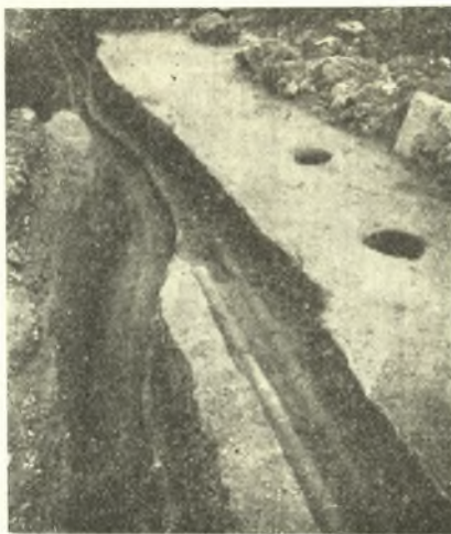
Εἰκ. 4. Τμήμα τῆς ὁδοῦ κατὰ τὸν τομέα β΄, μετὰ τοῦ ἀνωτέρου ὁδοστρώματος, σωληνώσεων καὶ ὀπῶν δένδρων.

Ἀξιοσημείωτον εἶναι πρὸς τούτους ὅτι πρὸ τοῦ ἐν λόγῳ τοίχου ἀπεκαλύφθησαν ὅσαι εἰς τὰ ὁδοστρώματα, διαμ. 0.20-0.30 μ., αἱ ὁποῖαι ὀφεί-