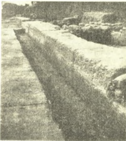
Εἰκ. 2. Εἰς βάθος σκαφή τῆς ὁδοῦ παρ' οἰκοδομῆν τοῦ τομέως α'.

Τοιαῦτα στρώματα, πάχους 0.20 μ. περίπου, διακρίνονται καὶ ἄλλα