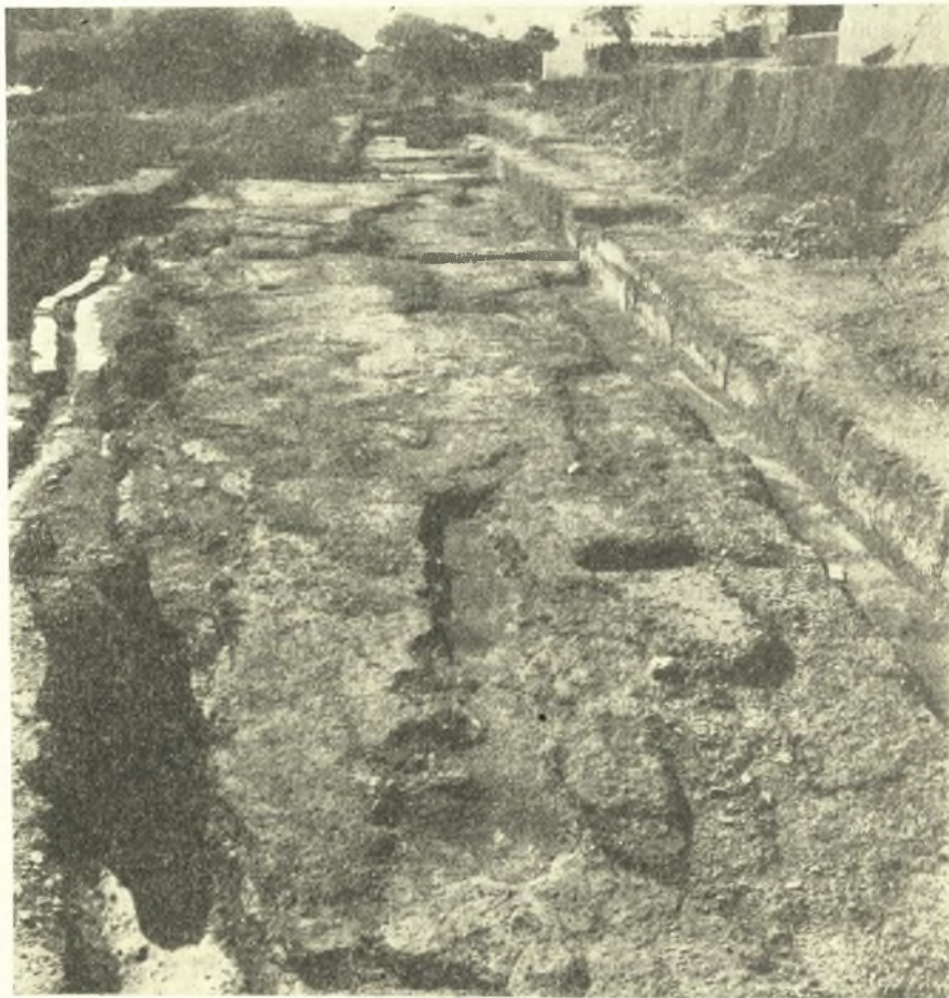
Εἰκ. 1. Ἡ ἀποκαλυφθεῖσα ἀρχαία ὁδὸς μετὰ τῶν ἀνωτέρων ὁδοστρωμάτων κατὰ τὸν τομέα α΄.

ἔχουν ἀνακατασκευασθῆ μεταγενεστέρως, κατὰ πᾶσαν πιθανότητα μετὰ τινὰ τῶν καταστρεψάντων τὴν πόλιν σεισμῶν, διὰ τοῦ ἀρχικοῦ προφανῶς ὑλικοῦ, τὸ ὁποῖον ἐχρησίμευσεν ὁσαύτως καὶ διὰ σημαντικὰς μεταβολὰς τοῦ παλαιοῦ σχεδίου τῶν οἰκοδομῶν.