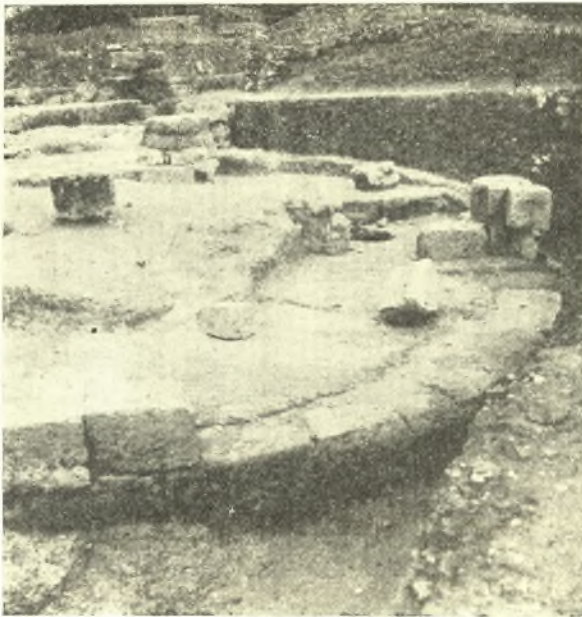
Εἰκ. 7. Ἡ βάση τοῦ πεταλοειδοῦς πύργου μετὰ τὴν ἀπομάκρυνσιν τῶν πέριξ χωμάτων.

Κατὰ τοὺς τελευταίους μῆνας τοῦ 1954 ἀνεσκάφη τὸ δυτικώτερον μέρος τοῦ τμήματος, εἰς μῆκος 26 μ. ἀπὸ τοῦ προηγουμένως ἀποκαλυφθέντος πεταλοειδοῦς πύργου, μέχρι τοῦ εἰρημένου νοσοκομείου, παρὰ τὸ ὁποῖον ἐσταμάτησε κατ' ἀνάγκην ἡ ἀνασκαφή. Οὕτω τὸ σύνολον τῆς ἀποκαλυφθείσης ὀχυρώσεως ἀνῆλθεν εἰς 85 μέτρα.