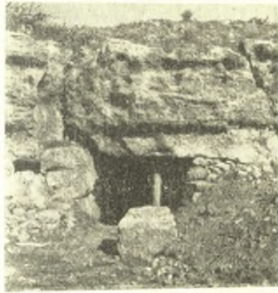
Εἰκ. 6. Ἡ εἴσοδος τοῦ σπηλαίου πρὸ τῆς ἐξερευνήσεως.

α'. Ἐξερεύνησις σπηλαιώδους κατασκευῆς. (Εἰκ. 5 - 6). Ὁ ἀμέσως πρὸς Ν. τοῦ τεμένους τοῦ Πυθίου Ἀπόλλωνος χῶρος, ἔνθα ἔξετελέσθη ἡ ἀνακοινουμένη ἐρευνα, πλάτους 100 μ. περίπου, ἴσου, πρὸς τὸ ἥμισυ τοῦ μεγάλου βασικοῦ μέτρου τῆς διαιρέσεως τῆς ἀρχαίας Ῥόδου, διατηρεῖ εἰς ἀρίστην κατάστασιν τὴν εἰς ἀνδρωτὰ πεδία ἀρχικὴν του διαμόρφωσιν. Ἐπὶ πλέον τὰ πεδία ἐνταῦθα παρουσιάζουν κανονικώτερον τοῦ συνηθούς σχηματισμόν, ὡς ἐκ τῶν διαστάσεών των δὲ καὶ τοῦ διαχωρισμοῦ των διὰ καλῶς κατεσκευασμένων ἀναλημμάτων, τοίχων ἢ κατατομῶν βράχων, παρέχουν τὴν ἐκτύπωσιν ὅτι ἀπετέλουν τεμένη ἢ ἄλλα αὐτοτελοῦς μνημειακῆς διαμορφώσεως μέρη τοῦ συνόλου.