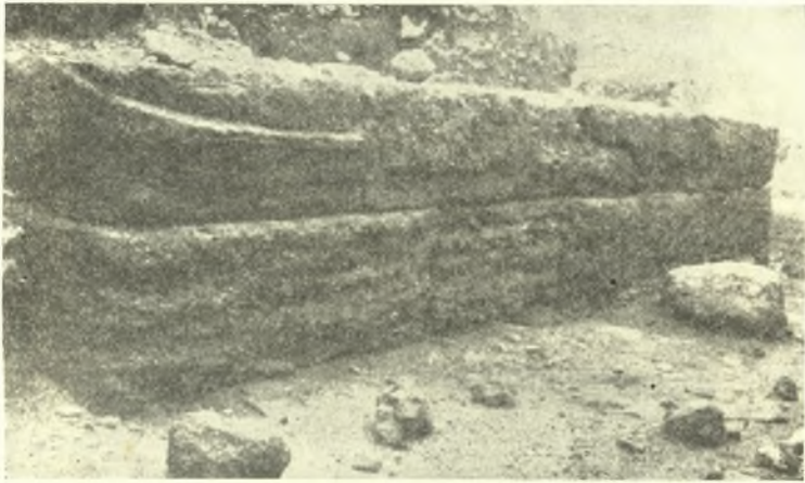
Εἰκ. 8. Τὸ δυτικώτερον ἀποκαλυφθὲν τμήμα τοῦ τείχους τοῦ μεγάλου λιμένος.

Τοῦ μεταξὺ τῆς πύλης καὶ τοῦ πύργου τείχους διατηρεῖται, ἐπὶ μέρος, ἡ νότιος πλευρὰ μέχρι δύο δόμων (συν. ὕψ. 1 μ.) διακρίνεται δὲ σαφῶς καὶ ὀλόκληρος ἡ κοίτη ἐπὶ τοῦ βράχου, ἐκ τῆς ὁποίας συνάγεται μετ' ἀσφαλείας ὅτι τὸ πλάτος τοῦ τείχους εἰς τὴν βάσιν του ἦτο 4-4.10 μέτρα· ὅσον δηλαδὴ τὸ πλάτος τοῦ ἀνατολικοῦ μέρους τῆς ἀνασκαφείσης ὀχυρώσεως πρὸ τῆς διαπλατύνσεως, περὶ τῆς ὁποίας ἐγίνε λόγος εἰς τὴν προηγουμένην ἔκθεσιν.