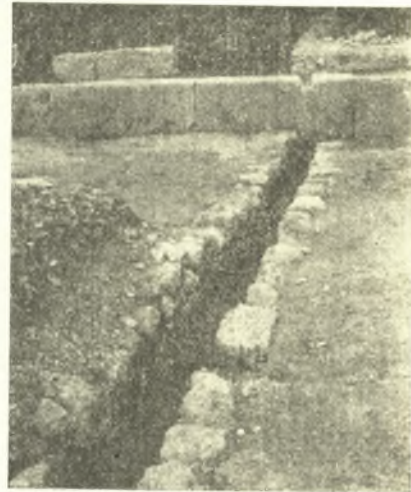
Εἰκ. 3. Ἀρχικῶς κρυπτὸς ὄχετος οἰκίας ἐντὸς τοῦ ἀνωτέρου ὁδοστρώματος τοῦ τομέως α'.

ὑπὸ τὸ ἀνώτατον, ἀντιστοιχοῦντα προφανῶς εἰς διαφόρους ἐπισκευὰς τῆς ὁδοῦ.