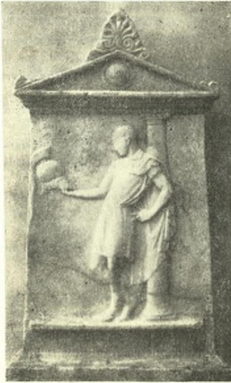
Εἰκ. 9. Ἐπιτύμβιος στήλη ἐκ τῆς νεκροπόλεως τῆς Ἀκαντιάς.

Ἐπιτύμβιος στήλη ἐκ μαρμάρου λευκοῦ πρὸς τεφρόχρουν. Μέγιστον ὕψος στήλης μετὰ τὴν βάσιν καὶ τὸ ἀνθέμιον 0.917, πλάτος τῆς στήλης ἄνω (ἄνευ τοῦ ἀετώματος) 0.423, πλάτος τῆς στήλης κάτω (ἄνευ τῆς βάσεως) 0.478, πλάτος τῆς βάσεως κάτω 0.555, πάχος μέγιστον βάσεως κάτω 0.170, πλάτος τῆς προεσοχῆς ἐπὶ τῆς ὁποίας πατεῖ ὁ νέος 0.045, μήκος 0.425, πάχος