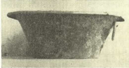
Εἰκ. 7. Χαλκὴ λεκάνη.

λούρου κώνου, ὕψ. 0.124 μ., διάμ. στομίου 0.273 μ., διαμ. χειλέων 0.315, διαμ. βάσεως 0.175 μ., φέρουσα ὑπὸ τὴν κινητὴν λαβὴν ἐπίθετον φύλλον κισσοῦ ἐκ χαλκοῦ. Μεταξὺ τῶν κεραμικῶν εὐρημάτων τῆς στέγης συγκαταλέγονται ἀνθεμωτὰ μέτωπα καλυπτήρων ἠγεμόνων τοῦ α' ἡμίσεος τοῦ 4ου π. Χ. αἰ. (εἰκ. 8) καὶ τινα, γνωστὰ καὶ ταῦτα ἐκ παλαιότερων εὐρημά-