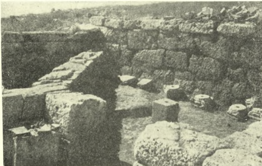
Εἰκ. 3. Τὸ δωμάτιον ο.

τοψιν μορφῆς Π μὲ τὸ ἀνοικτὸν σκέλος πρὸς μεσημβρίαν, κατὰ τὸν συνήθη τύπον τῆς κλασσικῆς καὶ ἑλληνιστικῆς οἰκίας. Ἐκαστον τοιοῦτο σκέλος ἐστεγάζεται διὰ πετασοειδοῦς (σκούφιας) στέγης (ΠΑΕ 1952 σ. 351). Ἐκ τῆς ἐσωτερικῆς κυρίως συνθέσεως τοῦ σχεδίου κατοψέως καὶ ἐπὶ τῇ βάσει τῶν ἀνευρεθέντων κεράμων τῆς στέγης προκύπτει ὅτι μόνον τὸ δωμάτιον ρ καὶ ἡ εἴσοδος σ τῆς μεσημβρινῆς στοᾶς ἐστεροῦντο δευτέρου ὀρόφου, τῆς εἰσόδου στεγαζομένης διὰ σαγματοειδοῦς στέγης μετ' αἰτώματος, ἔχοντος κλίσιν 1:5 περίπου.