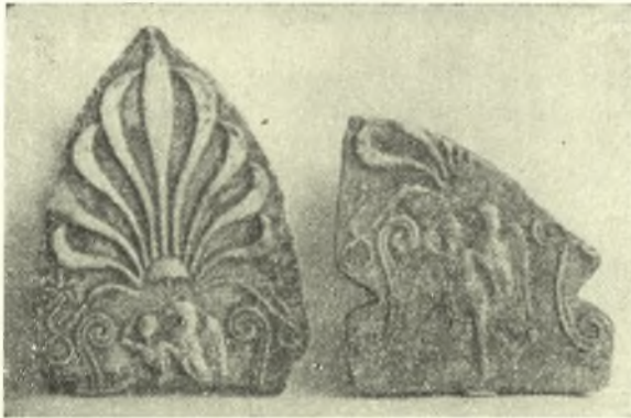
Εἰκ. 9. Ἀνθεματὰ μέτωπα ἡγεμόνων καλυπτῆγων.

παρεμβάλλεται τὸ ἱμάτιον, ὡς ἀναφέρει ὁ Πλίνιος διὰ τὸ χάλκινον σύμπλεγμα τοῦ Λεωχάρους, ὃ δὲ Γανυμήδης λαμβάνει τὸν ἀντίστοιχον πόδα τούτου, ἵνα στηριχθῆ ἀσφαλέστερον. Ὁ αἰτὸς παρίσταται οὐχὶ κατ' ἐνώπιον, ὡς εἰς τὸ γνωστὸν σύμπλεγμα τοῦ Βατικανοῦ, ἀπομιμούμενον ἐλευθέρως τὸ ἔργον τοῦ Λεωχάρους, ἀλλὰ σχεδὸν πλαγίως, ἔχων τὴν κεφαλὴν ἐν κατατομῇ, τὸ ράμφος κλειστόν, τὸς πτέρυγας ἡμιανοίκτους καὶ κινητέως. Ὁ νέος εἰκονίζεται μὲ ἀπογεγυμνωμένον τὸ σῶμα ἐκ τοῦ ὀρητικῶς παρασυρομένου ὑπὸ τοῦ ἀνέμου ἱματίου, ἔχων τοὺς πόδας χιαστί, ἵνα ὑποδηλωθῆ ἡ ἀπελευθέρωσις τῶν ποδῶν ἐκ τοῦ βάρους τοῦ σώματος καὶ ἡ ἀνύψωσις του πρὸς τὸν ἕναστρον κόσμον, συμβολιζόμενον ἐνταῦθα διὰ τῶν δύο ἑκατέρωθεν καὶ