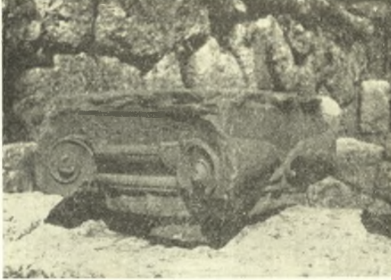
Εἰκ. 4. Ἴωνικὸν κιονόκρανον.

Τὸ κορινθιακὸν κιονόκρανον τῆς εἰκ. 5, ὕψ. 0.358 μ., ἐκ τοῦ αὐτοῦ