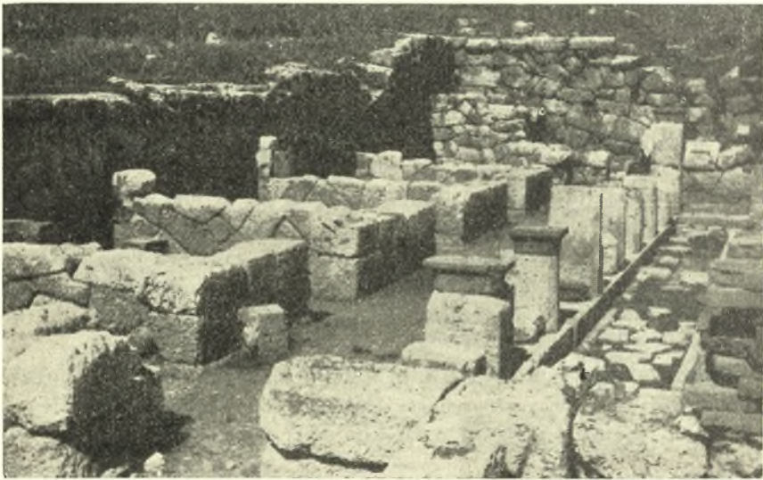
Εἰκ. 1. Ἡ δυτικὴ πλευρὰ τοῦ οἰκοδομήματος, ὀρωμένη ἐκ νότου.

δων, τοποθετημένων ἑσωτερικῶς εἰς τὰ σημεῖα συνδέσεως τῶν μεσοτοιχῶν μετὰ τῶν ἑξωτερικῶν τοίχων. Εἰς τὴν εἰκ. 1 εἶναι ὄρατὰ εἰσέτι τμήματα τοιούτων λιθίνων ἀντιστηριγμάτων. Ἰδιαιτέρα φροντίς ἐλήφθη διὰ τὴν ἐξασφάλισιν τῆς στερεότητος τῆς ΒΔ. γωνίας τοῦ οἰκοδομήματος καὶ τῶν ἐκατέρωθεν ἑξωτερικῶν πλευρῶν τῶν δωματίων κ, λ, ἔνθα ἡ ἑξωτερικὴ ὄψησις τῶν χωμάτων ἦτο ἰσχυροτάτη. Ἐνταῦθα κατ' ἐξαιρέσιν ὁ διαγώνιος μεσότοιχος, ἀποτελούμενος ἐν μέρει ἐκ τοῦ αὐτοφουῶς βράχου, προσέλαβε μεγαλύτερον πάχος (1.10 μ.), ἐν συγκρίσει πρὸς τοὺς λοιποὺς διαγωνίους