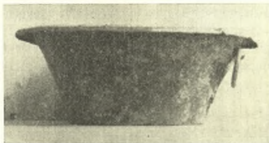
Εἰκ. 7. Χαλκὴ λεκάνη.

λούρου κώνου, ὕψ. 0.124 μ., διάμ. στομίου 0.273 μ., διαμ. χειλέων 0.315, διαμ. βάσεως 0.175 μ., φέρουσα ὑπὸ τὴν κινητὴν λαβὴν ἐπίθετον φύλλον κισσοῦ ἐκ χαλκοῦ. Μεταξὺ τῶν κεραμικῶν εὐρημάτων τῆς στέγης συγκαταλέγονται ἀνθεμωτὰ μέτωπα καλυπτήρων ἠγεμόνων τοῦ α' ἡμίσεος τοῦ 4ου π. Χ. αἰ. (εἰκ. 8) καὶ τινα, γνωστὰ καὶ ταῦτα ἐκ παλαιότερων εὐρημά-