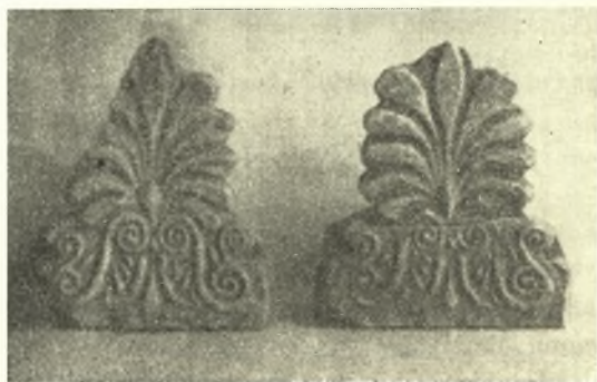
Εἰκ. 8. 'Ανθεμωτοὶ ἠγεμόνες καλυπτῆρες τοῦ Δ' αἰῶνος.

των, μὲ παράστασιν ἀετοῦ ἐντὸς κεραυνοῦ (πρβλ. καὶ ΠΑΕ 1952, σ. 350, εἰκ. 28-29). Τὰ τελευταῖα ταῦτα, χρονολογούμενα εἰς τὸ τέλος τοῦ 3ου π. Χ. αἰ. ἢ εἰς τὸ α' ἡμισοῦ τοῦ 2ου π. Χ. αἰ., προέρχονται πιθανότατα ἐκ τῆς στέγης τῆς παρακειμένης στοᾶς. Λίαν ἐνδιαφέροντα εἶναι ἐπίσης δύο