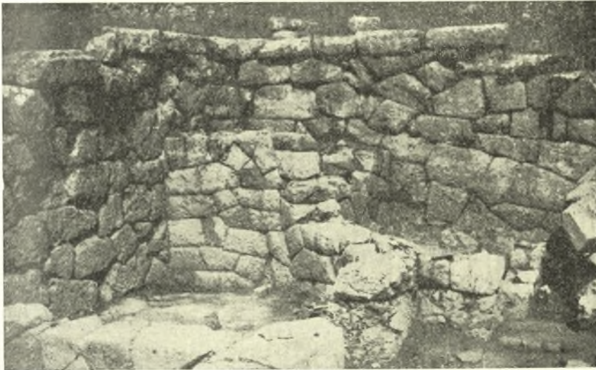
Εἰκ. 2. Ἡ ΒΔ. γωνία τοῦ οἰκοδομήματος μετὰ τὴν ἀναλημματικὴν τετράγωνον κατασκευὴν ἐσωτερικῶς.

ἀρχικὴν κατεύθυνσιν ἀπὸ νότου πρὸς βορρᾶν, ἐστρέφετο ἀκολούθως πρὸς ἀνατολάς. Ὅμοία κλίμαξ ὑπῆρχε πιθανώτατα καὶ ἐντὸς τοῦ δωματίου κ ἢ λ, διὰ τὴν ἐπικοινωνίαν μετὰ τοῦ ἀνωγείου τῆς δυτικῆς πλευρᾶς· ἀλλ' ἐνταῦθα δὲν διεπιστώθησαν ἕγνη θεμελίου κλίμακος, διότι ἤρχει πρὸς τοῦτο τὸ στερεὸν λίθινον δάπεδον τῶν δωματίων. Ἐβεβλήθη τοιουτοτρόπως ὅτι τὸ οἰκοδόμημα εἶχε καὶ δεῦτερον ὄροφον κατὰ τὰς τρεῖς τοῦλάχιστον πλευρᾶς, πλὴν τῆς μεσημβρινῆς. Καὶ διὰ μὲν τὴν βόρειον καὶ δυτικὴν πλευρὰν οὐδεμία περὶ τούτου ὑπῆρχεν ἀμφιβολία· διότι ἐνταῦθα οἱ ἔξωτερικοὶ τοῖχοι διατη-