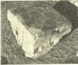
Εἰκ. 4. Βάθρον ἀσβεστολίθου.

Πρὸς Β. τοῦ ἐτέρου ναΐσκου (Θ) πλᾶξ ἀσβεστολίθου, ἀποκεκρουμένη ἄνω καὶ δεξιᾷ (0.56 × 0.31 μ.), περιέχουσα ψήφισμα τοῦ κοινοῦ τῶν Μολοσσῶν ἀπονέμον πολιτείαν καὶ ἄλλας συνήθεις τιμὰς εἰς τινας, τῶν ὁποίων τὰ ὀνόματα δὲν σώζονται, ὡς ἐπίσης ἐλλείπουσι τὰ ὀνόματα τοῦ βασιλέως καὶ τοῦ προστάτου, ὅστις ἦτο ἐκ τοῦ φύλου τῶν Κελαίθων. Ἀναγράφονται ὅμως τὸ ὄνομα τοῦ γραμματέως καὶ ἐν μέρει τῶν δέκα πέντε συναρχόντων μετὰ τοῦ φύλου αὐτῶν, τῶν τελευταίων πρώτην φορὰν ἐμφανιζομένων ἐν τῇ πολιτείᾳ τῶν ἠπειρωτικῶν φύλων, ὡς τῶν δαμιοργῶν ἐν ἄλλῃ ἐπιγραφῇ δημοσιευομένη ἐν τῇ ΑΕ, 1956. Ἡ νέα αὕτη ἐπιγραφή πρέπει νὰ ἀνάγεται εἰς τοὺς πρὸ τοῦ 330 π. Χ. χρόνους.