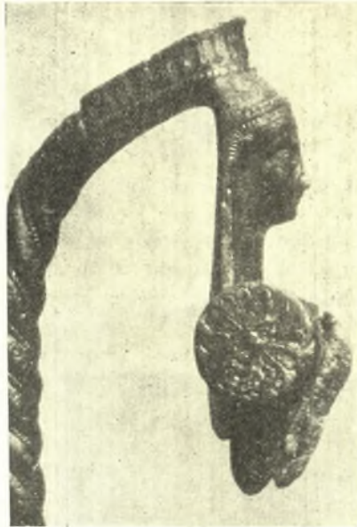
Εἰκ. 5. Στρεπτὴ χαλκῆ λαβὴ οἰνοχόης.

Ἐκ τοῦ ἐτέρου πρὸς Δ. τοῦ ἱεροῦ κτηρίου ναΐσκου προέρχεται χαλκῆ