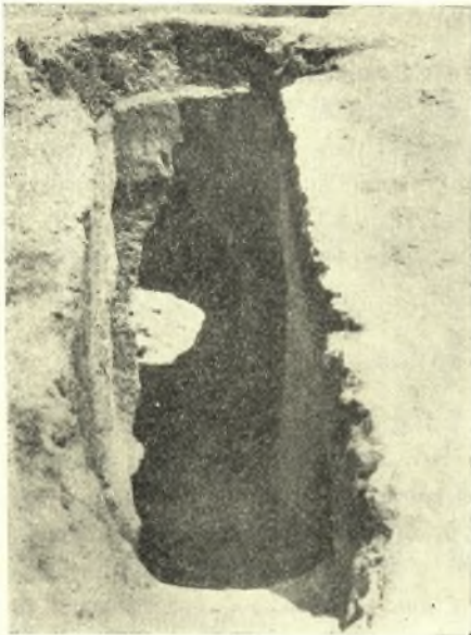
Εἰκ. 10. Δρόμος καὶ πρόσοψις τοῦ 5ου τάφου.

προσθεν ἐπὶ τῆς κοιλίας καὶ τὴν κεφαλὴν βλέπουσαν πρὸς τὰ ἄνω. Ἄλλὰ καὶ αἱ δύο κόγχαι δὲν περιεῖχον κτερίσματα. Ἡ πρόσοψις τοῦ τάφου εἶχεν, ὡς εἶπομεν, πλάτος 1.05 μ. καὶ κατὰ τὸ κέντρον αὐτῆς ἠνοίγετο ἡ εἴσοδος πλάτους 0.62 μ., ὕψους 1.58 μ. καὶ πάχους 0.75 μ. Εἶχε δὲ τοῦτο τὸ χαρακτηριστικὸν ὅτι αἱ πλευραὶ αὐτῆς μέχρι μὲν ὠρισμένου ὕψους ἦσαν εὐθύγραμμοι, συγκλίνουσαι ἐκεῖθεν ἐντόνως πρὸς τὴν κορυφὴν καὶ σχηματίζουσαι τρίγωνον. Τὴν ἀρχιτεκτονικὴν δὲ ταύτην ἰδιορρυθμίαν παρατηροῦμεν