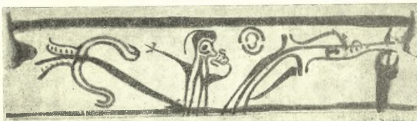
Εἶν. 6. Ἀνάπτυγμα τῆς παραστάσεως τῆς προχοΐσκης τῆς εἰκ. 5. Θεὰ μεταξὺ δύο δένδρων.

Προσπάθεια τοῦ τεχνίτου εἶναι νὰ δώσῃ ἐνταῦθα ζωγραφικὴν παράστασιν δασώδους τοπίου, ἄλσους, ἐντὸς τοῦ ὁποίου κινεῖται ἡ γυναικεία μορφή, δρέπουσα ἄνθη καὶ ἀγαλλομένη ἐκ τῆς εὐωδίας αὐτῶν, ὡς ὑποδεικνύει ἡ ἔκτασις τῆς δεξιᾶς χειρός. Εἶναι δὲ πιθανὸν ὅτι αἱ ἄνω ἀριστερὰ τοξοειδεῖς γραμμαὶ παριστοῦν τὸν ἥλιον ἢ τὴν σελήνην διὰ νὰ ἐξαρθῇ παραστατικώτερον ἢ ἔκφρασις τοῦ ὑπαιθρίου περιβάλλοντος. Θὰ ἡδυνάμεθα νὰ ἐρμηνεύσωμεν τὴν παράστασιν ὡς εἰλημμένην ἐκ τοῦ καθημερινοῦ βίου, σημαίνουσαν δηλαδὴ ἀπλῶς γυναῖκα ἐντὸς κήπου δρέπουσαν ἄνθη, διότι δυσκόλως θὰ ἀνεζήτηι τις παρομοίας εἰκονογραφικὰς (pittoresques) παραστάσεις εἰς τὴν Ὑστεροελλαδικὴν III b – c ἐποχὴν, εἰς ἣν ἀνήκει τὸ ἄγγειον,