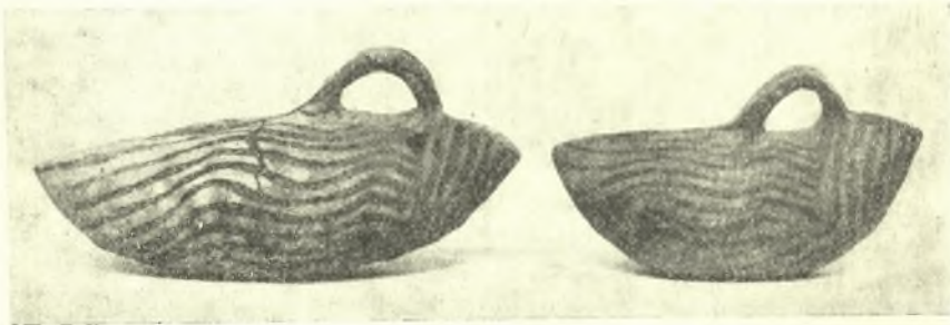
Εἰκ. 3. Ἀσκοειδῆ ἀγγεῖα ἐκ τοῦ 3ου τάφου.

7. Φιάλη δίωτος ἐκ πηλοῦ ὑπολεύκου καὶ μελονοκαστανῆς διακοσμῆσεως ἐκ γραμμῶν καὶ συνεχοῦς ἀπλῆς σπείρας. Τὸ χεῖλος καὶ τὸ ἐσωτερικὸν εἶναι βεβαμμένον· ὑψ. 0.105 διάμ. χείλους 0.15.