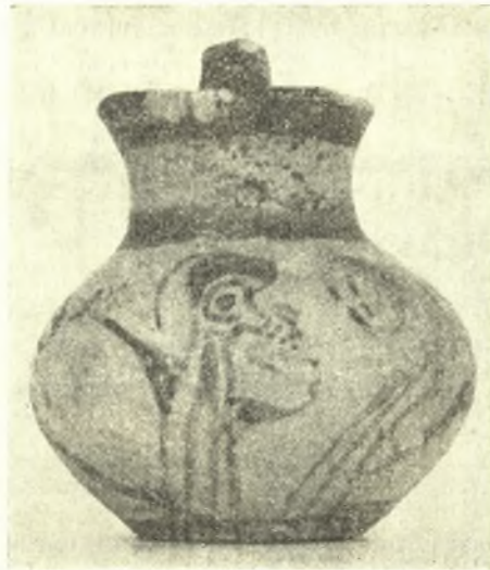
Εἰκ. 5. Προχοΐσκη ἐκ τοῦ 3ου τάφου.

Τὸ κέντρον τῆς παραστάσεως, συμπίπτον πρὸς τὴν ἀντίθετον τοῦ χείλους πλευρὰν τοῦ ἀγγείου, καταλαμβάνει ἀνθρωπίνη μορφή, ἀποδιδόμενη κατὰ πρωτόγονον καὶ στοιχειώδη τρόπον. Παρίσταται ὀρθία γυνή, κατ' ἐνώπιον, ἐνδεδυμένη διὰ ποδήρους χειριδωτοῦ χιτῶνος, ἀποδιδόμενην διὰ τεσσάρων καθέτων γραμμῶν πρὸς δῆλω-