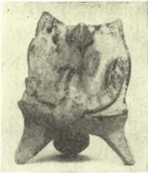
Εἰκ. 7. Εἰδῶλιον ἐκ τοῦ 3ου τάφου παριστῶν μορφήν καθημένου ἐπὶ θρόνου.

Ἐκτὸς δὲ τῶν ἀγγείων εὐρέθησαν ἐντὸς τοῦ τάφου 5 εἰδῶλια, ἔξ ὧν τὸ ἕν παριστᾷ μορφήν καθημένην ἐπὶ θρόνου 2 (εἰκ. 7) τὰ δὲ λοιπὰ εἶναι τοῦ γνωστοῦ Ψοειδοῦς τύπου (εἰκ. 8), 10 ἐκ στεατίου κομβία καὶ τινὰ ἄλλα μικρότερα κτερίσματα, ὡς ψηφίδες ἔξ ὑαλομάζης καὶ στεατίτου κλπ.