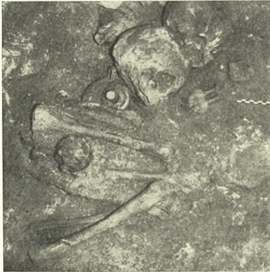
Εἰκ. 11. Τμῆμα τοῦ θαλάμου τοῦ 6 ου τάφου, ἔνθα διακρίνεται τὸ ἀνευρεθὲν τρίμορφον εἰδῶλιον.

αὐτοῦ ἐν μέρει εἶχε καταστραφῆ, καταλήγων εἰς τὴν ΒΔ. γωνίαν τῆς ἐκ τσιμέντου βάσεως. Εἰς ἀπόστασιν 1.70 μ. ἀπὸ τῆς ἀρχῆς ὁ δρόμος ἐφράσσετο διὰ τοίχου, ὅστις κατὰ τὸ κάτω μὲν μέρος ἦτο ἐκτισμένος διὰ κοινῶν λίθων κατὰ δὲ τὸ ἄνω μέχρι τοῦ στερεοῦ ἐδάφους διὰ πλακῶν ἐξ εὐθραύστου σχιστολίθου, εἰλημμένων ἐκ λατομείου κατὰ τὰς ὑπορείας τοῦ Ὑμηττοῦ. Χαρακτηριστικὸν δὲ εἶναι καὶ τοῦτο ὅτι δύο τῶν πλακῶν εὐρέθησαν καθέτως τοποθετημέναι οἷονεὶ ὡς στῆλαι. Τὸ πλάτος τοῦ δρόμου ἀρκεταὶ ἀπὸ 0.65 μ. εἰς τὴν ἀρχήν, ἐξικνούμενον μέχρις 1.09 μ. κατὰ τὸ