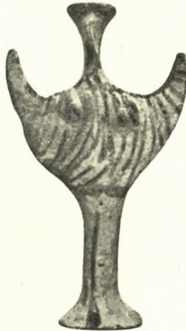
Εἰκ. 8. Ψοειδὲς εἰδῶλιον ἐκ τοῦ 3ου τάφου.

Κατὰ τὸν μῆνα Ἀπρίλιον 1954 ἐξηκολούθησεν ἡ ἀνασκαφὴ τοῦ νεκροταφείου, διότι καὶ νέοι κίνδυνοι καταστροφῆς ἢ συλήσεως τῶν τάφων ἀνεφάνθησαν (εἰκ. 9). Ἀνεσκάφη δὲ συστάς τάφων εἰς ὀλίγων μέτρων ἀπόστασιν νοτιοδυτικῶς, ἔνθα εἶχεν ἀνοικοδομητῆ εὐμεγέθους βάσις ξυλίνου οἰκίσκου ἐκ τσιμέντου καὶ μάλιστα ἀκριβῶς ἐπὶ τοῦ θαλάμου τοῦ 7ου κατὰ σειρὰν ἐκ Β. πρὸς Ν. τάφου. Τοῦ τάφου τούτου ἀνεσκάψαμεν τὸν δρόμον, ὅστις μερικῶς μόνον εἶχε καταστραφῆ.