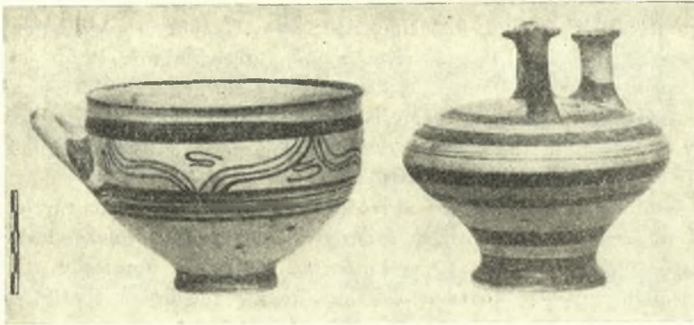
Εἰκ. 4. Ἀγγεῖα ἐκ τοῦ 3ου τάφου.

Βορειότερον τοῦ πρώτου τάφου καὶ εἰς ἀπόστασιν 3—4 μέτρων ἀνεσκάφη ὁ 3ος τάφος, τοῦ ὁποίου ὄμως καὶ ὁ δρόμος καὶ ὁ θάλαμος εἶχον κατὰ τὴν ἐπιφάνειαν καταστραφῆ κατὰ τὴν ἐκσκαφὴν τῶν θεμελίων καὶ τὴν