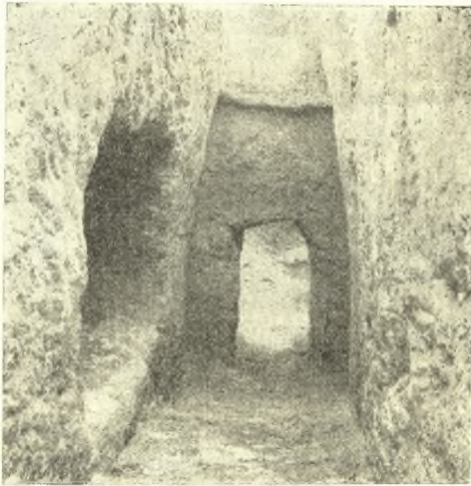
Εἰκ. 2. Πρόσοψις τοῦ τάφου 1 μετὰ τμήματος τοῦ δρόμου καὶ τῆς ἀριστερᾶ τούτου κόγχης.

ἀπὸ τοῦ ἀνωφλίου τῆς θύρας συνέκλινον ἑλαφρῶς πρὸς τὰ ἄνω μέχρι τῆς ἐπιφανείας (εἰκ. 2). Εἶχε δὲ κάτω ἢ πρόσοψις πλάτος 1.23 περίπου καὶ εἰς τὸ κέντρον περίπου ταύτης εἰς ἀπόστασιν (0.27 – 0.32) ἕξ ἑκατέρων τῶν πλευρῶν, εὐρίσκετο ἡ εἴσοδος. Αὕτη ἐκλείετο δι' ἰσχυροῦ τοίχου (ξηρολιθιάς), καταλαμβάνοντος ὁλόκληρον τὸ βάθος τοῦ στομίου (1.15 μ.) καὶ ἔχοντος ὕψος 1.10 μ. καὶ πλάτος 0.64, εὐρυνομένη ἑλαφρῶς 0.75 μ. κατὰ τὸν θάλαμον. Τὸ ἀνώφλιον τῆς εἰσόδου εἶναι εὐθύγραμμον Ὁ θάλαμος τοῦ τάφου εἶχεν, ὡς εἶπομεν, ἀναταραχθῆ κατὰ τὸ πολὺ ὑπὸ ἀρχαιοκαπήλων, οἵτινες ἀφήρσαν μερικὰ τῶν κτερισμάτων. 5 Ἦσαν δὲ ταῦτα τὰ ἑξῆς: