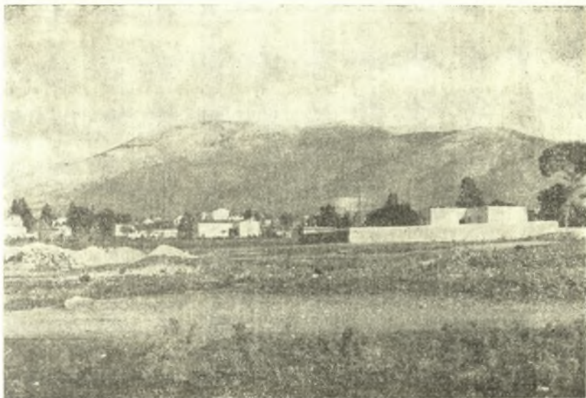
Ἐικ. 1. Ὁ Ὑμηττὸς ἀπὸ τοῦ χώρου τῆς ἀνασκαφῆς.

ὑπὸ τοῦ H. G. Lolling, ὅστις ὀρίζει τὴν θέσιν ὡς κειμένην πλησίον τῶν ἔρειπίων τῶν Ἀλῶν Αἰξωνίδων «κατὰ τὴν ἀνατολικὴν πλευρὰν τῆς ἀποξηρανθείσης λιμνοθαλάσσης, ἡ ὁποία ἐξικνεῖται ἀπὸ τὴν μικρὰν χερσόνησον Πούντα (νησί) πρὸς τὸ ἐσωτερικόν. Εἰς ἀπόστασιν 10' τῆς ὥρας πρὸς τὸν Ὑμηττὸν κεῖται ἡ ἐκκλησία τοῦ Ἀγ. Νικολάου». Τοὺς τάφους δὲ τούτους ἐπεσήμανε κατὰ τὸ 1919 καὶ ὁ ΑΝΤ. ΚΕΡΑΜΟΠΟΥΛΛΟΣ (ΠΑΕ, 1919, 33 κ.έ.), ὅστις ἀναφέρει μάλιστα ὅτι ἀνεῦρε συστάδα «σπηλαιωδῶν Μυκηναϊκῶν τάφων περὶ τοὺς πενήτηκοντα» σεσυλημένων ἀπὸ μακροῦ καὶ «ματαίως ἀνε-