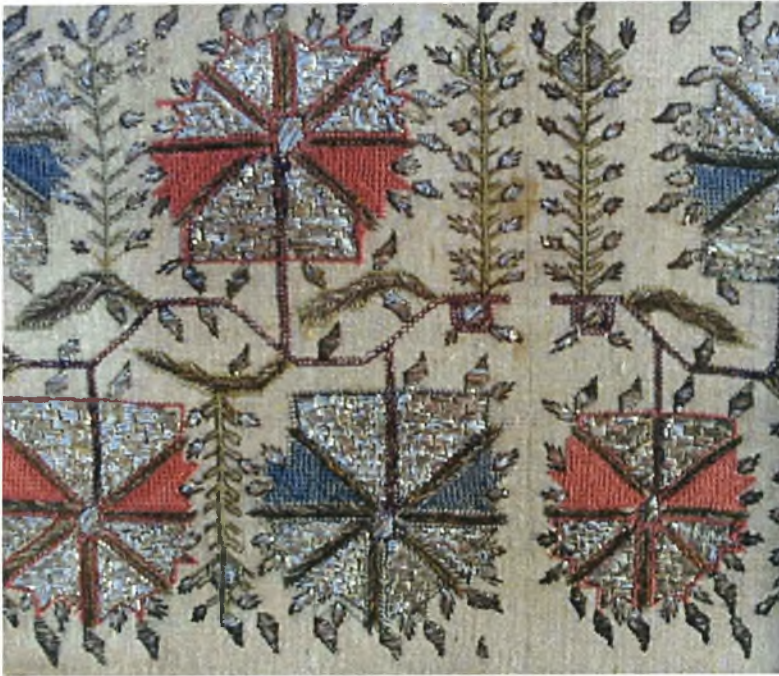
Χρυσοκέντημα από τα Καράμπουρνα