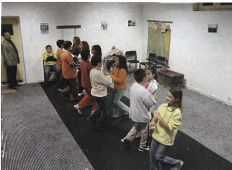
Τα παιδιά του χωριού χορεύουν καρσιλαμά

Εδώ και αρκετά χρόνια, ο Μορφωτικός και Εξωραϊστικός Σύλλογος έχει δημιουργήσει και χορευτικό τμήμα. Οι νέοι του οικισμού μαθαίνουν χορούς μέσα από τη παράδοσή τους αλλά και από όλη την Ελλάδα. Εμφανίζονται σε παραστάσεις, γλέντια και ανταμώματα υπενθυμίζοντας τους μεγαλύτερους τα νιάτα τους και προσκαλώντας τους νεότερους στο χορό.