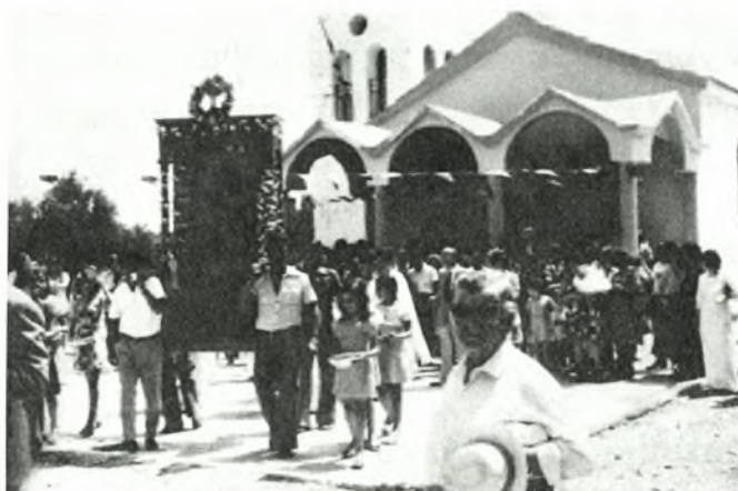
Λιτανεία της εικόνας της Αγίας Μαρίνας στις 17 Ιουλίου

Η Αγία Μαρίνα γιορτάζεται το καλοκαίρι, στις 17 Ιουλίου, μια περίοδος που είναι και ευκολότερη η φιλοξενία των επισκεπτών της Γλύφας.