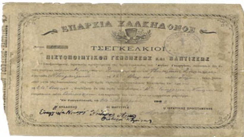
Έντυπα από τους πρώτους κατοίκους, αρχείο του Λαογραφικού Μουσείου του οικισμού