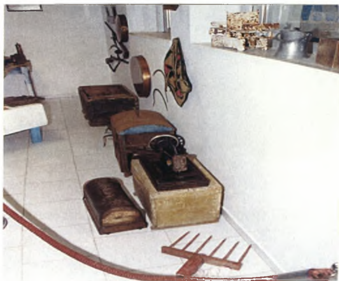
Χώρος του μουσείου με κειμήλια