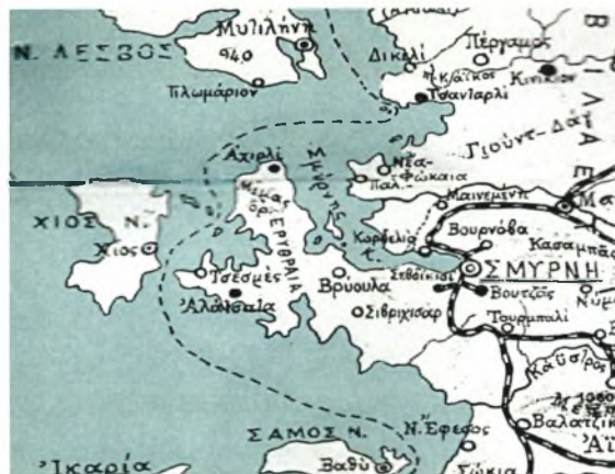
Η χερσόνησο της Ερυθραίας