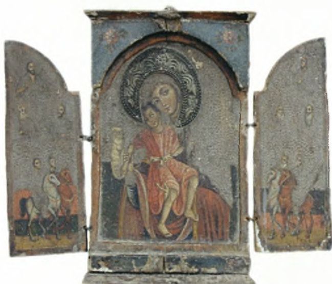
Τρίπτυχη εικόνα της Παναγίας Βρεφοκρατούσας και των Αγίων Θεοδώρων