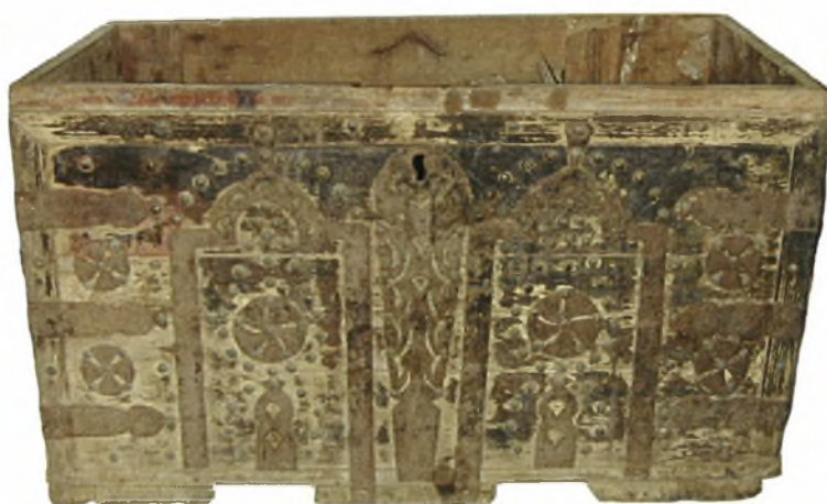
Μπαούλο- σεντούκι από την Καππαδοκία που ήρθε στην Ελλάδα με την Ανταλλαγή