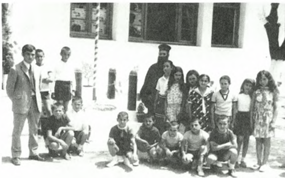
Πρώτη μέρα σχολικής περιόδου

Το Δημοτικό σχολείο του οικισμού της Γλύφας ιδρύθηκε το 1928 και στεγάστηκε σε δύο προσφυγικά σπίτια, στο σημείο που βρίσκεται και το σημερινό, όπου λειτούργησε για πολλά χρόνια. Το 2003 ανεστάλη η λειτουργία του, και τα παιδιά του οικισμού πλέον πηγαίνουν σχολείο στο Βαρθολομίο που είναι το κεφαλοχώρι της περιοχής. Το κτήριο του σχολείου του οικισμού, τα 2 τελευταία χρόνια λειτουργεί ως το Λαογραφικό Μουσείο της Γλύφας.