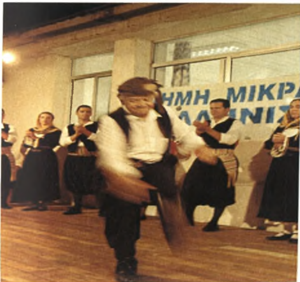
Φιγούρα Ζεϊμπέκικου χορού

Όταν ο ίδιος ο χορός ήταν αργός τον ονόμαζαν ζεϊμπέκικο και το χόρευε ένας-ένας και όσοι τα κατάφερναν, έκαναν και φιγούρες με μαχαίρια. Είναι, ίσως, ο μοναδικός χορός στο είδος του που δε διέπεται από κανόνες, φιγούρες και βήματα, αλλά είναι καθαρά αυτοσχεδιαστικός χορός. Ορίζεται από την ψυχοσύνθεση και τον σεβντά του χορευτή.