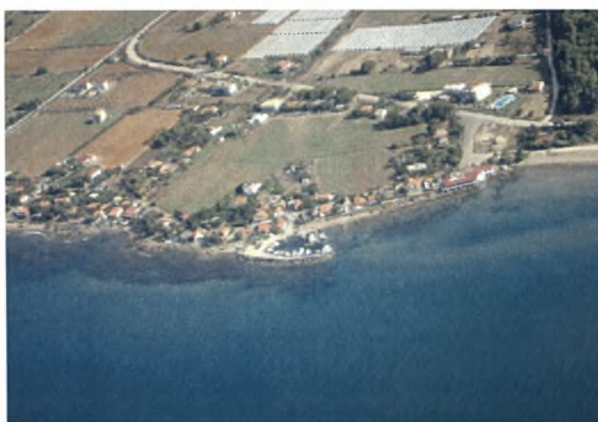
Αεροφωτογραφία παραλίας Γλύφας

Η περιοχή όπου εγκαταστάθηκαν οι πρόσφυγες, χαρακτηρίζεται από τα γλυφά νερά της και για αυτόν το λόγο ο συνοικισμός παίρνει την ονομασία Γλύφα. Είναι τοπωνύμιο προϋπάρχον.