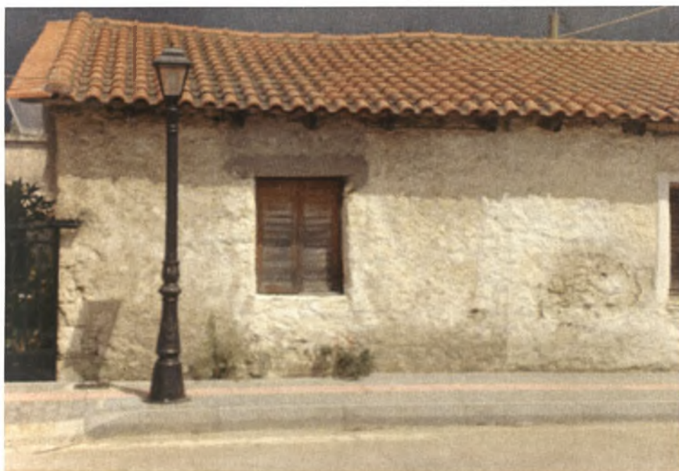
Τα πρώτα προσφυγικά σπίτια