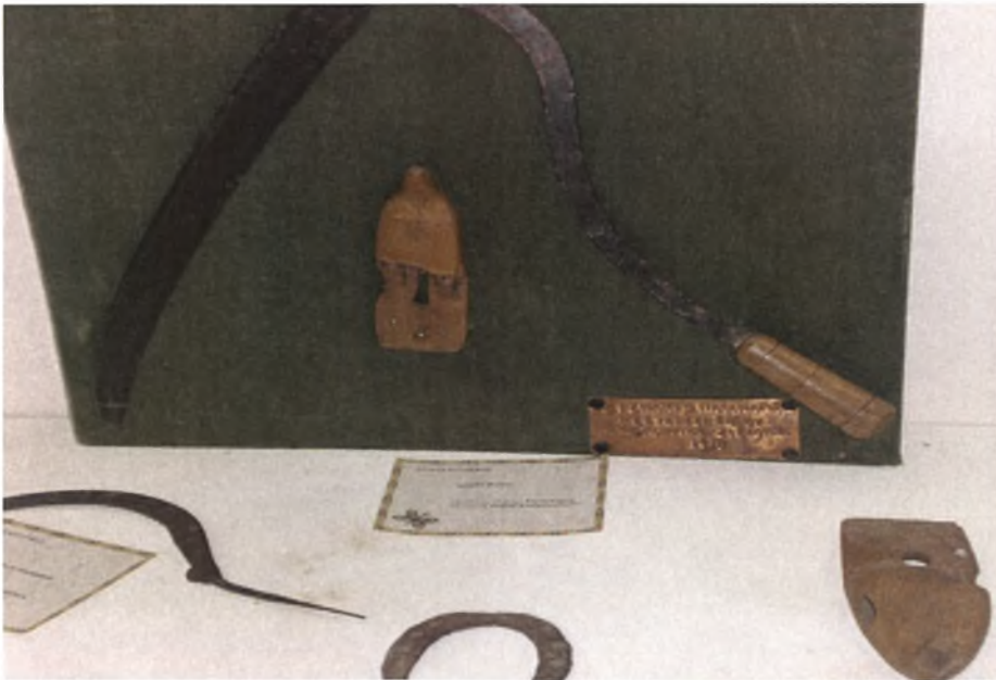
Εργατικά δρεπάνια και παλαμαριές