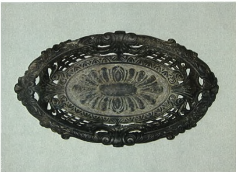
Χάλκινο κειμήλιο από την Καππαδοκία