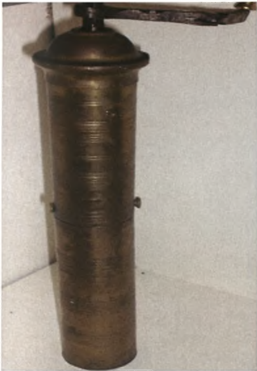
Μύλος του καφέ