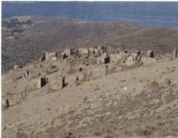
Χωριό Σατζάκι στο Καραμπουρούν- Φωτογραφία του 2009

Η πλειοψηφία κατάγεται από τα καραμπουρνιώτικα χωριά το Σατζάκι, το Σαρπουντζίκι, το Σεκί. Η ονομασία του χωριού Σατζάκι είναι τούρκικη και προέρχεται από το sancak που σημαίνει λάβαρο 2 . Χτισμένο με θέα στη θάλασσα έβλεπε τη Χίο. Πλέον αποτελεί «μνημείο» περιήγησης για επισκέπτες, ως το χωριό «φάντασμα» 3 αφού δεν ξανακατοικήθηκε ποτέ από το 1922. Εκκλησία του χωριού ήταν ο Άγιος Δημήτριος και το ελληνικό σχολείο που το συντηρούσε η κοινότητα μέσω της σχολικής επιτροπής.