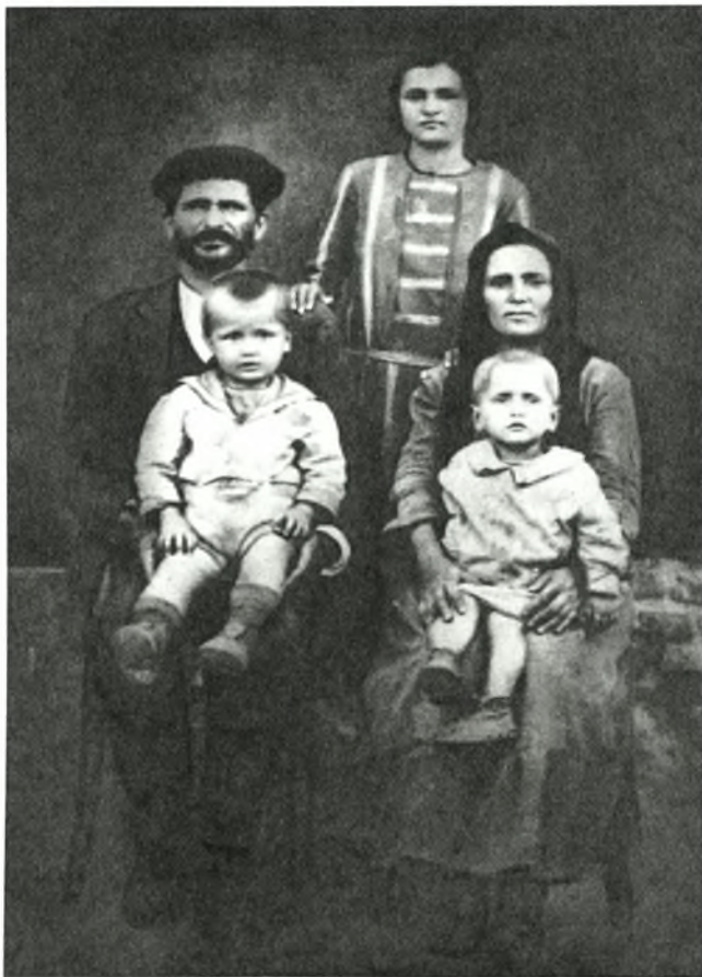
Οικογένειες του οικισμού της Γλύφα