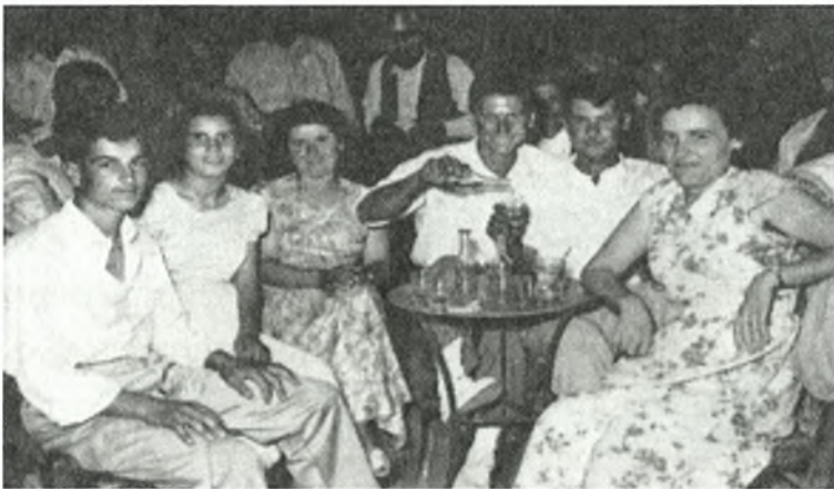
Σε πανηγύρι του οικισμού

Οι Γλυφαίοι γιόρταζαν στις 30-31 Αυγούστου και την Αγία Ελεούσα, την Ιερά Μονή που είναι κοντά στο χωριό τους. Μόλις τελείωνε η εκκλησία μοίραζαν λουκούμια και ούζο κι έτσι σιγά σιγά ξεκινούσε το γλέντι και οι χοροί.