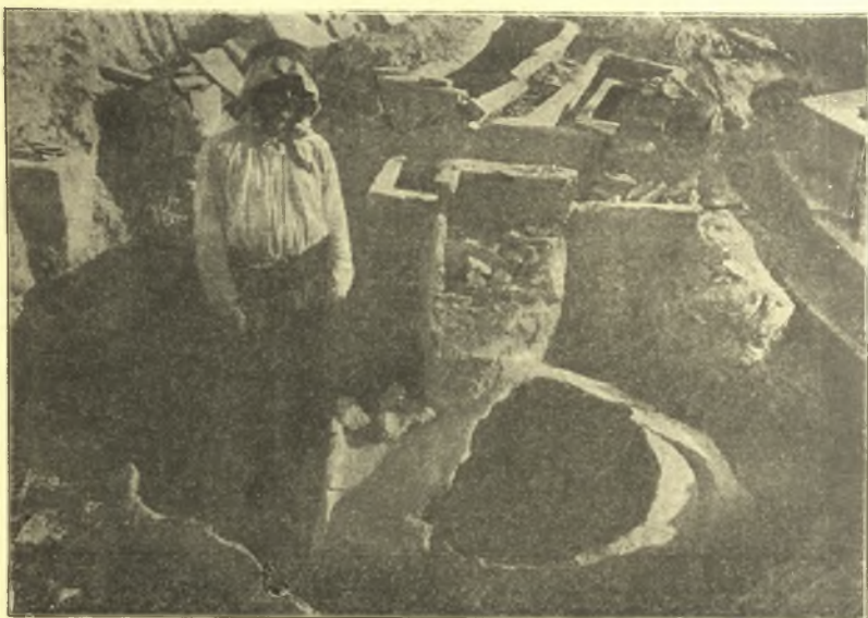
Εἰκ. 2. Τάφοι Κλαζομενῶν.

κίλη. Συχνή εἶναι ἡ ἀπλὴ κυματοειδὴς γραμμὴ ἐπὶ τῶν μακρῶν πλευρῶν, διπλὴ δὲ ἐπὶ τῶν στενῶν. Ἐπειτα ἔχομεν τρίγωνα, μαιάνδρους, ζωφόρους ἐναλλασσομένων ἀνθέων καὶ καλύκων λωτοῦ καὶ τέλος συμπλέγματα σφιγγῶν, λεόντων καὶ βοῶν. Κτερίσματα δὲν εὐρέθησαν ἐντὸς τῶν ἀδιαταράκτων σαρκοφάγων, ἀλλ' εὐρέθησαν πολλὰ τεμάχια ἀγγείων ἐκτὸς τῶν σαρκοφάγων καὶ ἐντὸς τῶν πέριξ χωμάτων. Σκελετοὶ περιείχοντο ἀνὰ εἷς ἐν ἑκάστη. Μία δὲ μόνη εἶχε δύο. Ὡς καλύμματα ἐχρησίμευον πλάκες πώρινοι. Μία τῶν σαρκοφάγων εἶχε κάλυμμα ἐπίσης πήλινον πάχους δύο περίπου ἑκατοστῶν τοῦ μέτρου μονοκόμματος.