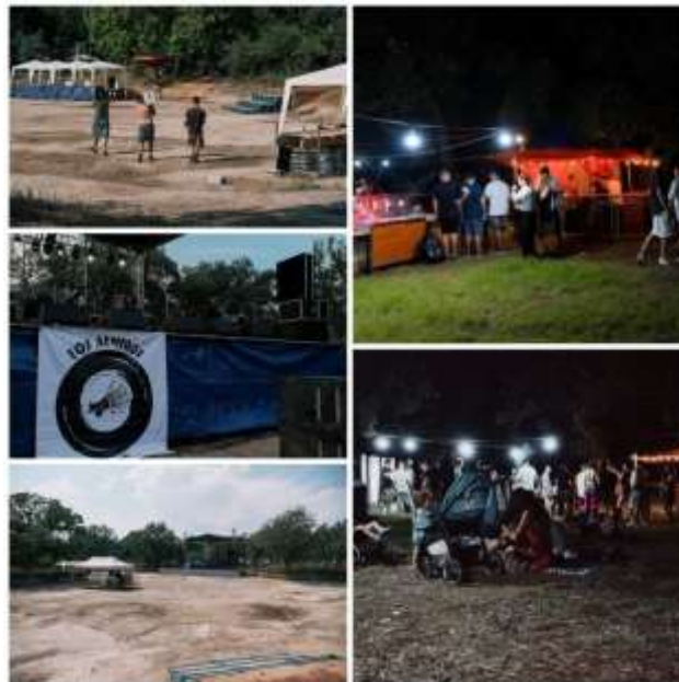
Εικόνα 4.6 Στιγμιότυπα από δράσεις της ομάδας 3.