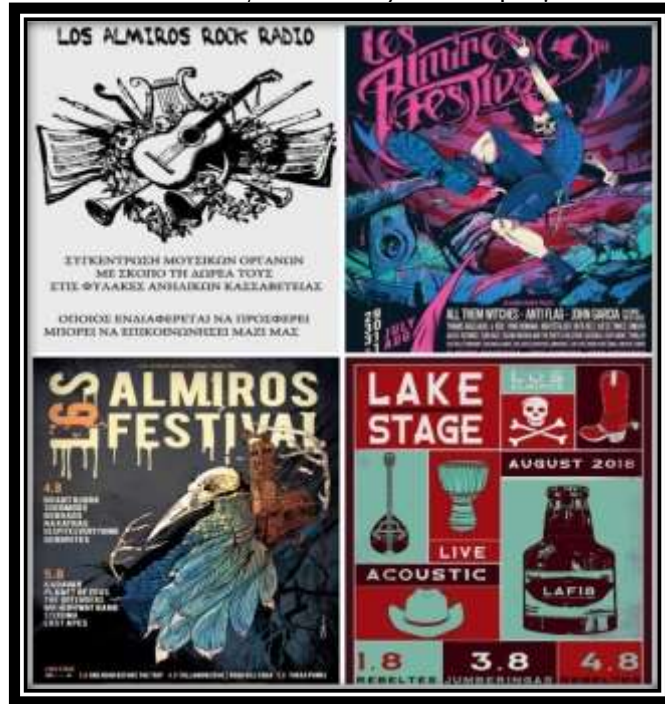
Εικόνα 4.3 Αφίσες από δράσεις της ομάδας