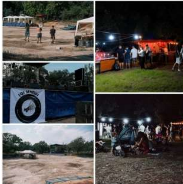
Εικόνα 4.6 Στιγμιότυπα από δράσεις της ομάδας 3.