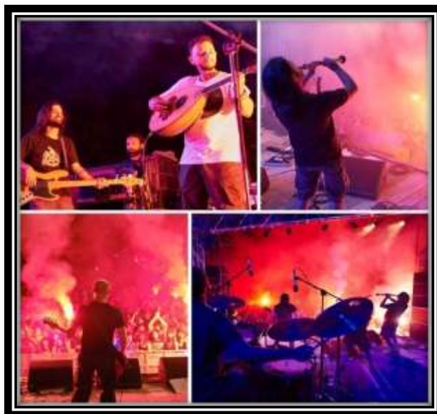
Εικόνα 4.4 Στιγμιότυπα από δράσεις της ομάδας