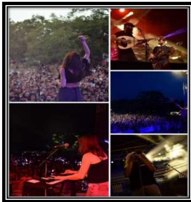
Εικόνα 4.5 Στιγμιότυπα από δράσεις της ομάδας 2