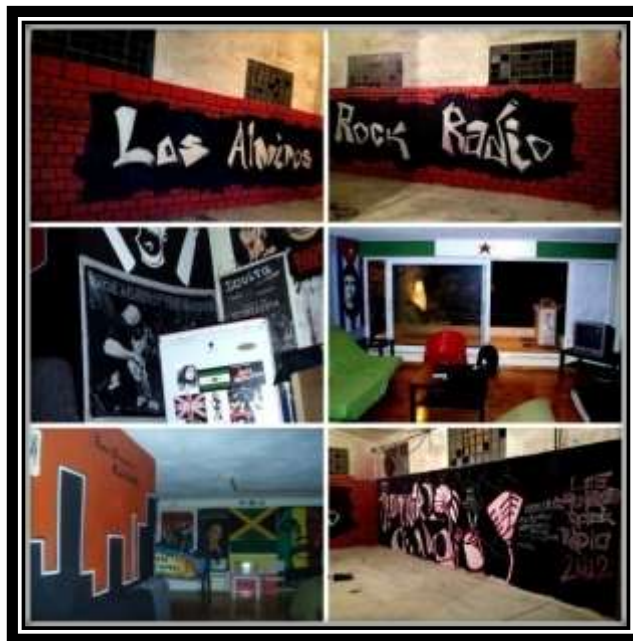
Εικόνα 4.2 Άποψη από το Αυτοδιαχειριζόμενο Στέκι Πολιτισμού του «Los Almyros»