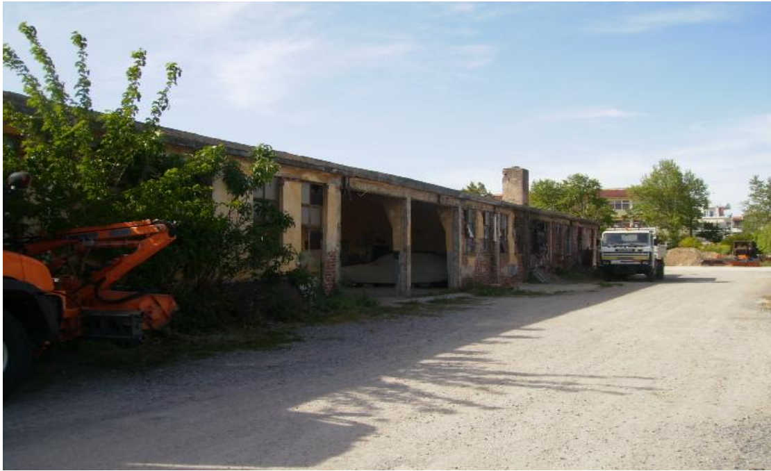
Εικόνα 35: Άποψη του δυτικού υποστέγου οχημάτων.