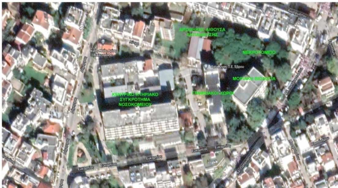
Χάρτης 3: Χωροταξία εγκαταστάσεων εντός του οικοπέδου του παλαιού Νοσοκομείου

Ανατολικά του κεντρικού κτηριακού συμπλέγματος βρίσκονται δύο τριώροφα κτήρια, μεταγενέστερης κατασκευής. Το πρώτο από αυτά, που είναι και πλησιέστερα προς τον κεντρικό κτηριακό όγκο, στεγάζει σήμερα Υπηρεσίες της Περιφερειακής Ενότητας Έβρου και του Υπουργείου Παιδείας και Θρησκευμάτων. Βρίσκεται σε πλήρως λειτουργική κατάσταση μετά και από σειρά παρεμβάσεων που εκτελέστηκαν κατά το παρελθόν από τις αρμόδιες Υπηρεσίες της Περιφερειακής Ενότητας Έβρου.