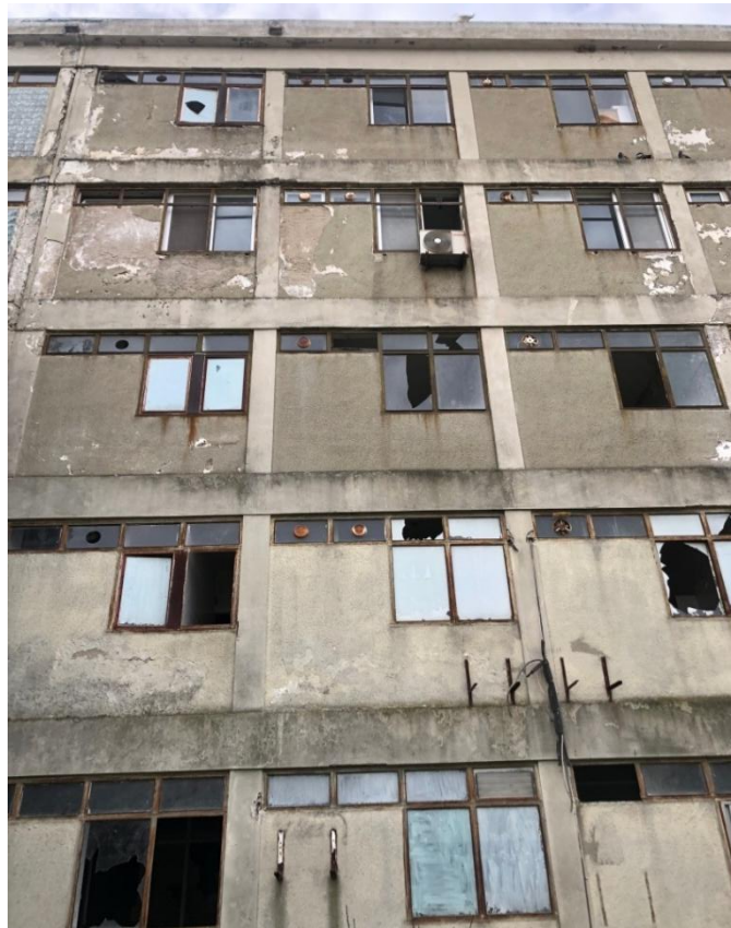
Εικόνα 24: Εσωτερική όψη του παλαιού Νοσοκομείου σήμερα.