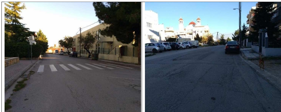
Εικόνα 15: Τμήματα των οδών Θράκης και Ανδρονίκου σήμερα.