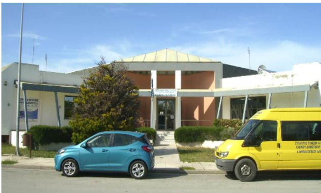
Εικόνα 32: Η πρόσοψη του Πολυκοινωνικού Κέντρου του Δήμου Αλεξανδρούπολης.