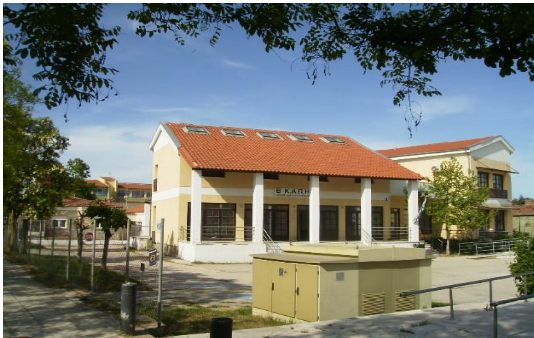
Εικόνα 33: Το Β΄ ΚΑΠΗ του Δήμου Αλεξανδρούπολης