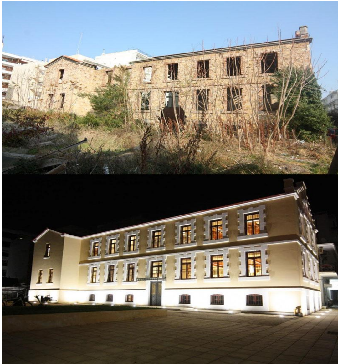
Εικόνα 7: Το Καπνομάγαζο μετά την καταστροφή του και σήμερα μετά την ανακατασκευή του.