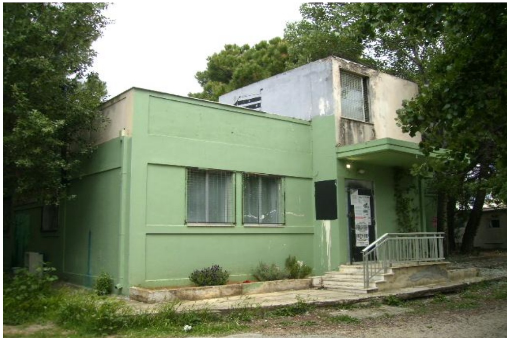
Εικόνα 21: Το κτήριο του Νεκροτομείου που σήμερα τελεί υπό κατάληψη