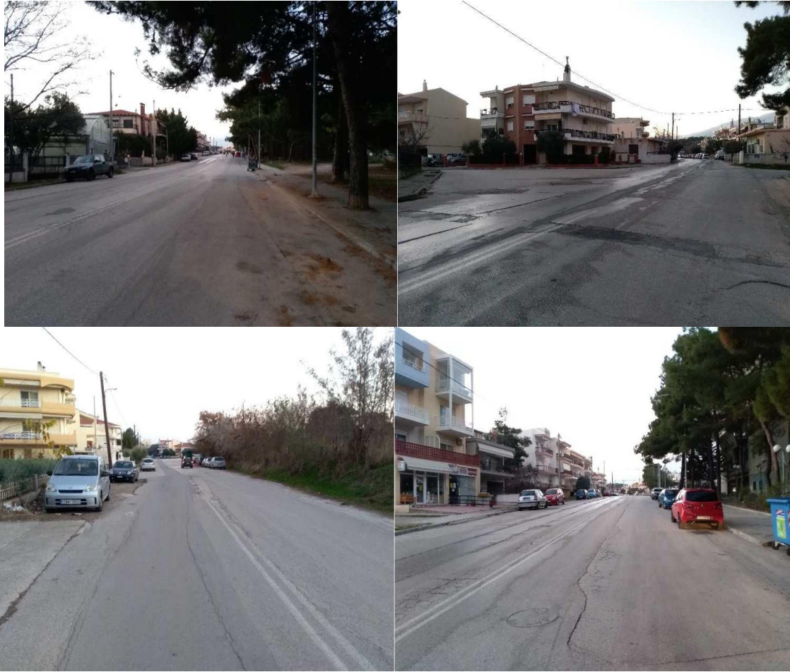
Εικόνα 11: Η οδός Αγίου Δημητρίου σήμερα