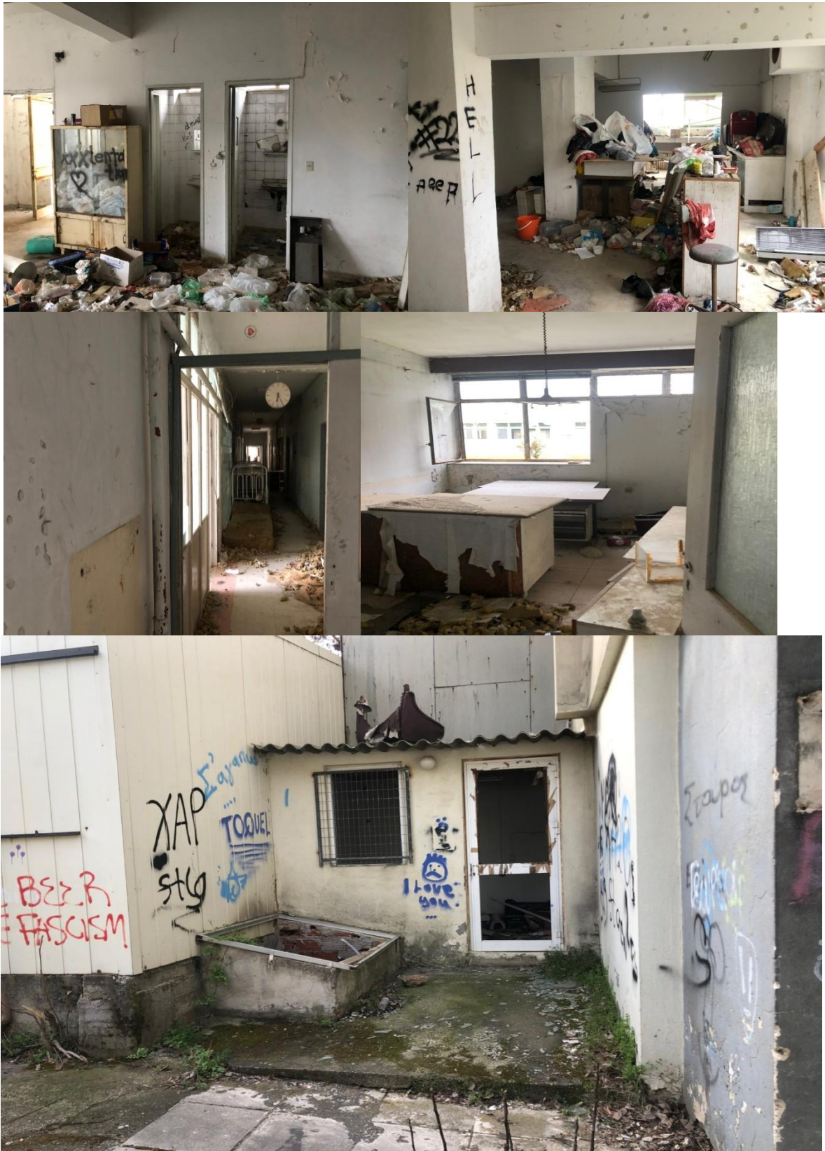
Εικόνα 27: Η κατάσταση στο εσωτερικό του παλαιού Νοσοκομείου σήμερα.