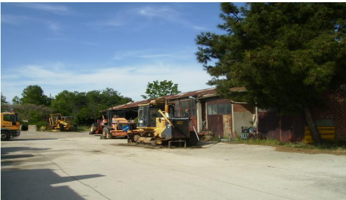
Εικόνα 38: Αποθήκες στο ανατολικό όριο του οικοπέδου.