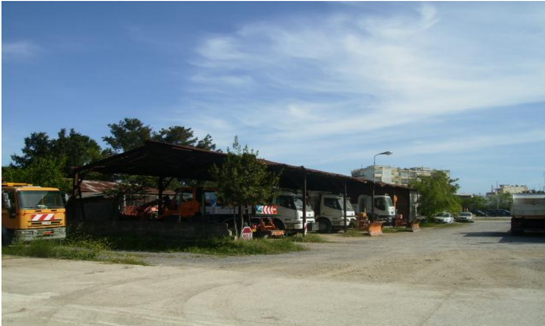
Εικόνα 37: Άποψη του ανατολικού υποστέγου οχημάτων