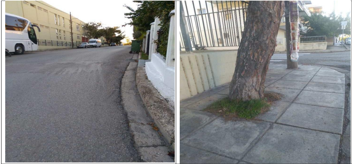
Εικόνα 16: Τμήματα των οδών Θράκης και Ανδρονίκου σήμερα.