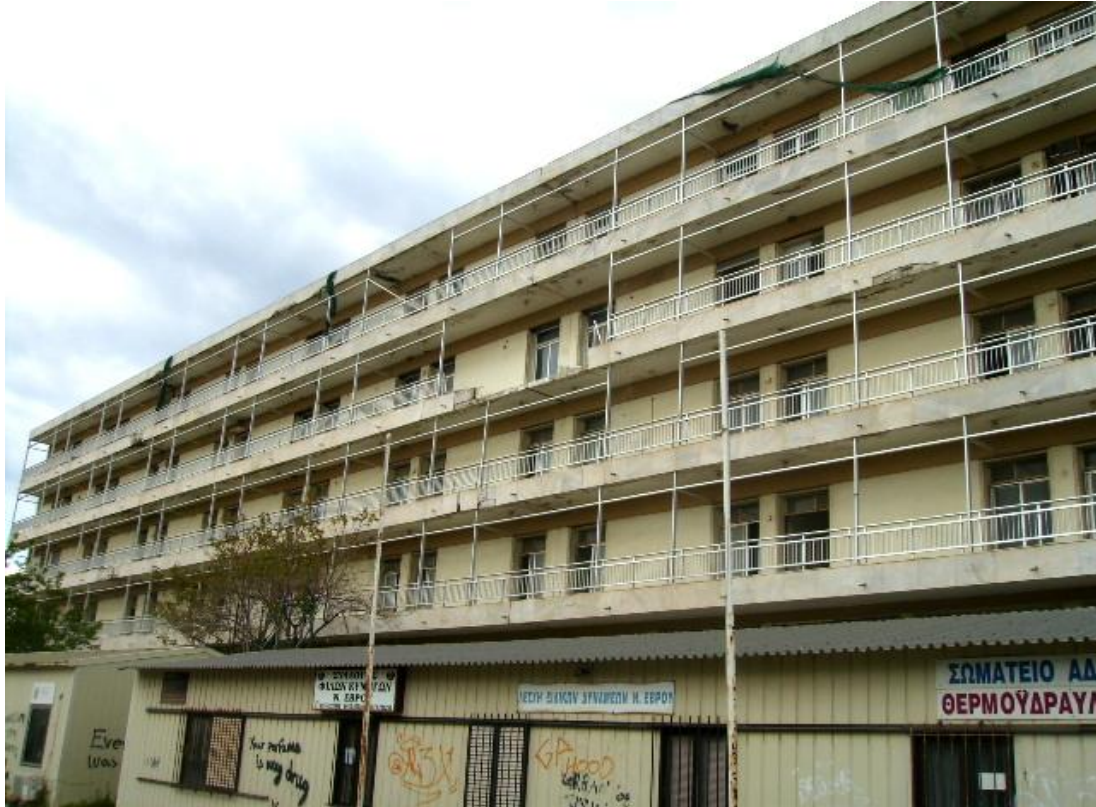
Εικόνα 31: Η νότια εξωτερική πλευρά του πενταόροφου κτηρίου του κεντρικού κτηριακού συγκροτήματος του παλαιού Νοσοκομείου όπως είναι σήμερα.