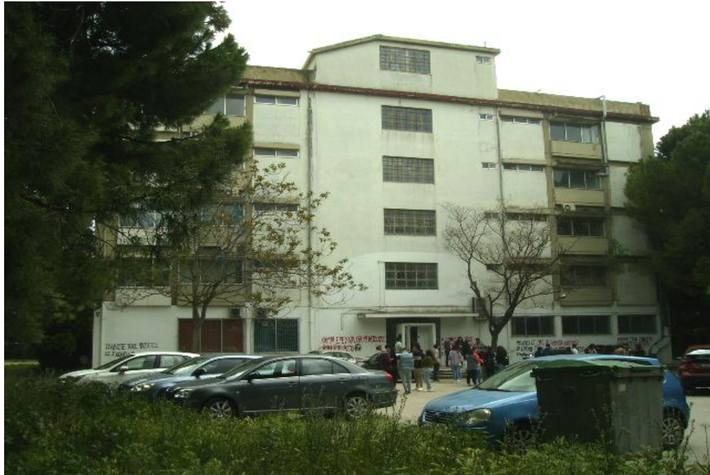
Εικόνα 20: Το κτήριο της Μοριακής Βιολογίας, στο οποίο σχεδιάζεται να μεταφερθεί η πλειονότητα των Υπηρεσιών της Π.Ε. Έβρου.