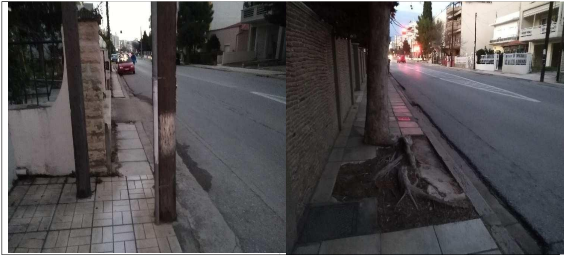
Εικόνα 12: Η οδός Ηροδότου σήμερα