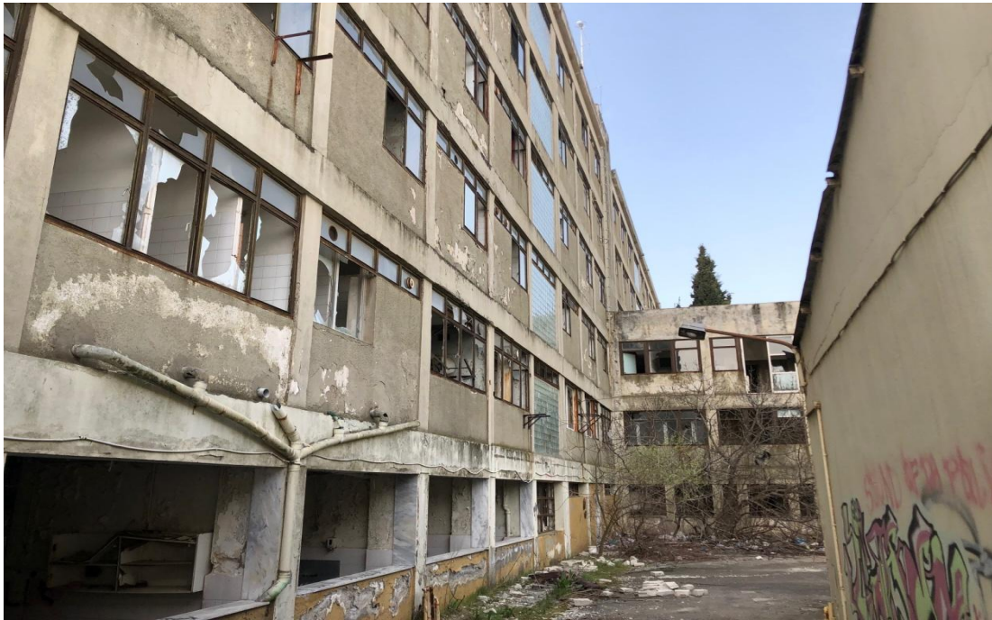
Εικόνα 23: Εσωτερικές όψεις του παλαιού Νοσοκομείου σήμερα.