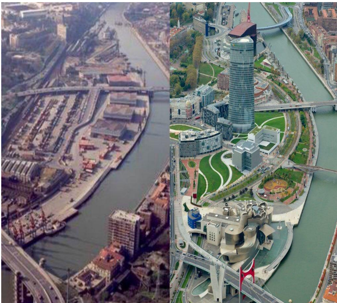
Εικόνα 4: Η περιοχή της Abandoibarra πριν και μετά τις εργασίες ανάπλασης.

Πηγή: Ηλιακοπούλου Α., (2020) 'Η περίπτωση ανάπλασης της περιοχής Abandoibarra στο Bilbao