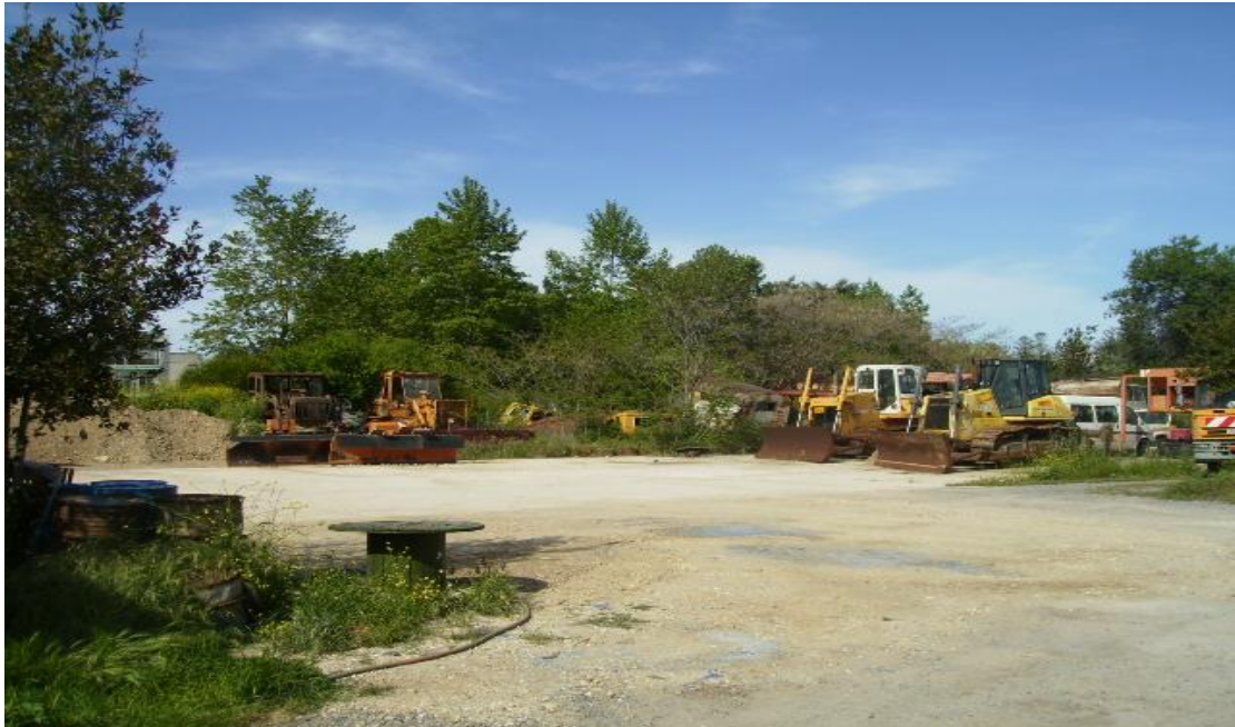
Εικόνα 36: Ο χώρος όπου σήμερα βρίσκονται παλαιά και εν λειτουργία μηχανήματα της Π.Ε. Έβρου.