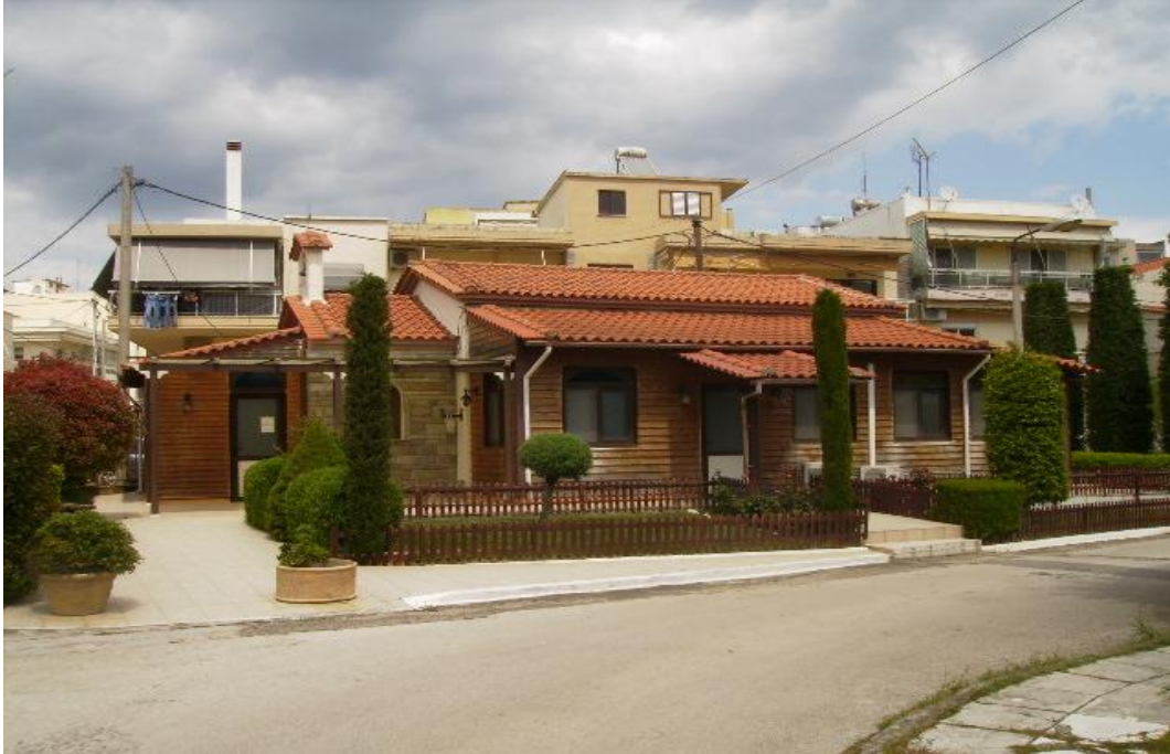
Εικόνα 17: Ο Ι.Ν. της Αγίας Αικατερίνης στο βορειοδυτική γωνία του οικοπέδου

Επαγγελματικής Κατάρτισης, αποθήκες, μικρό αλσύλλιο, καθώς και ο Ιερός Ναός της Αγίας Αικατερίνης στη βορειοδυτική γωνία του οικοπέδου.