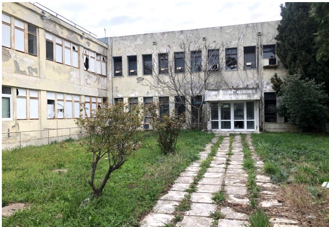
Εικόνα 22: Η κεντρική είσοδος του παλαιού Νοσοκομείου σήμερα.

Η κατάσταση στην οποία βρίσκονται σήμερα οι χώροι αυτοί είναι της πλήρους εγκατάλειψης. Η έλλειψη παντελούς συντήρησης έχει οδηγήσει στην καταστροφή όλου του δομικού και ηλεκτρομηχανολογικού κεφαλαίου ενώ η μέχρι πρόσφατα έλλειψη μέτρων ασφαλείας και παρεμπόδισης εισόδου στους χώρους κατέστησε τον χώρο έρμαιο κάθε λογής παραβατικών συμπεριφορών και βανδαλισμών.