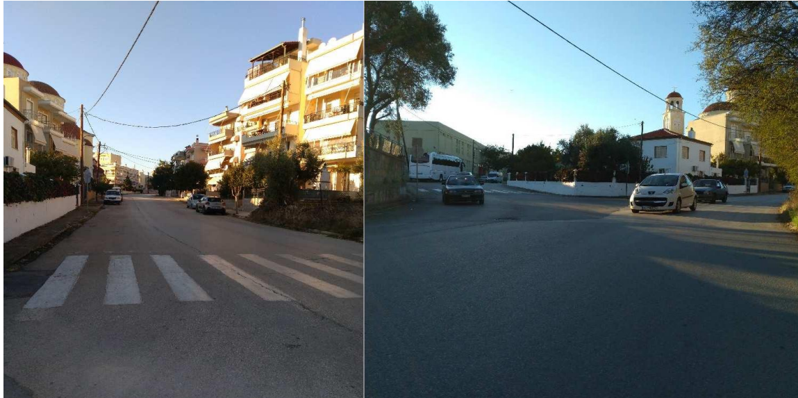
Εικόνα 14: Τμήματα της οδού Κονδύλη σήμερα