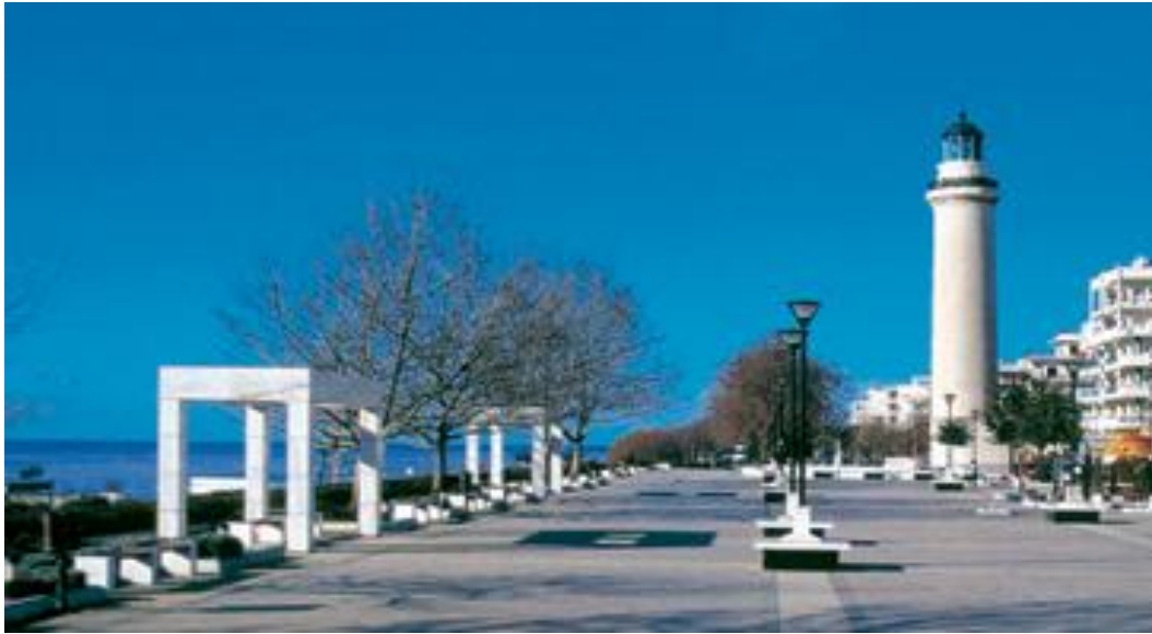
Εικόνα 10: Η γραμμική πλατεία του Φάρου σήμερα.