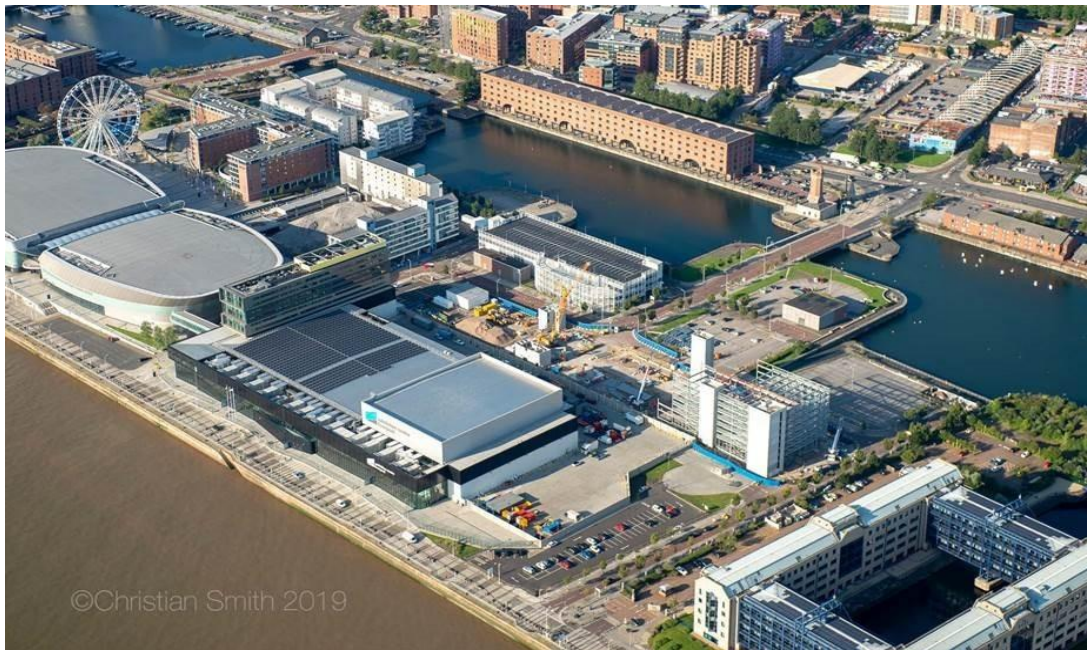
Εικόνα 3: Η αποβάθρα King' s Dock σήμερα

230 χρόνια πριν. Συγκεκριμένα, κατεδαφίστηκαν όλα τα παλαιά κτήρια και ο χώρος ανάμεσα στη συστάδα των αποβάθρων γέμισε με άμμο με τη βοήθεια κατάλληλων υδραυλικών βυθοκόρων, διαμορφώνοντας μια τεράστια ενιαία επιφάνεια περίπου τετραγωνικής μορφής με έδαφος ικανό για τη θεμελίωση καινούριων κτισμάτων σε όλο το βάθος [6].