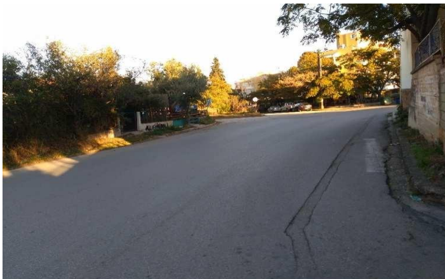
Εικόνα 13: Τμήμα της οδού Κονδύλη σήμερα.