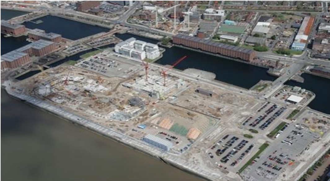
Εικόνα 2: Άποψη της αποβάθρας King' Dock το 2006 πριν την έναρξη κατασκευής των εργασιών ανάπλασης

Η αποβάθρα King' s Dock κατασκευάστηκε τον 18ο αιώνα σε συνέχεια της συνεχούς αναβάθμισης του λιμανιού του Liverpool για να ικανοποιήσει τις αυξημένες ανάγκες του εμπορίου. Καταλάμβανε έκταση περίπου 22 στρεμμάτων με διαστάσεις 265 μέτρα μήκος με 82 μέτρα πλάτος, περιλαμβάνοντας μέσα σε αυτήν πλήθος μεγάλων αποθηκών για την αποθήκευση προϊόντων καπνού και εμπορευμάτων που κυρίως έφταναν στο λιμάνι του Liverpool από τη Βιρτζίνια, τη Βαλτική θάλασσα και τις Δυτικές Ινδίες.