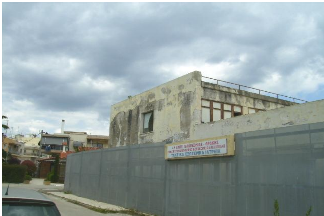
Εικόνα 29: Εξωτερική όψη του παλαιού Νοσοκομείου όπου βρίσκονταν τα εξωτερικά ιατρεία