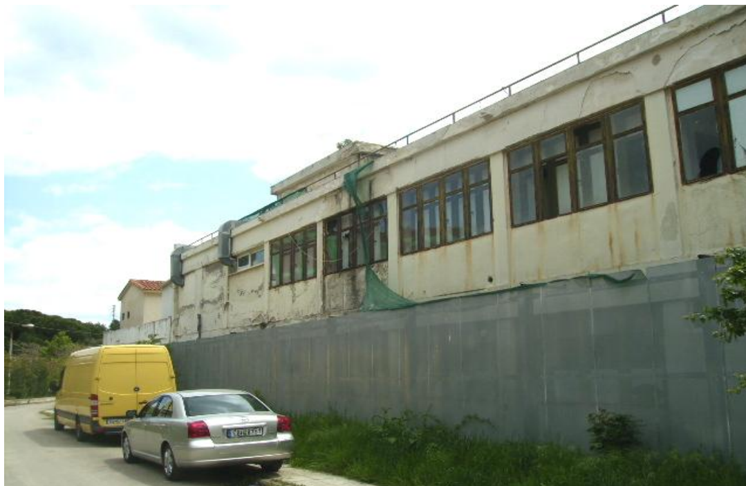
Εικόνα 30: Εξωτερική βόρεια όψη των παλαιών εξωτερικών ιατρείων όπως είναι σήμερα.