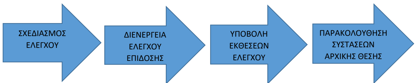
Εικόνα 1: Διαδικασία ελέγχου.

Επισημαίνουμε ότι το ελεγκτικό συνέδριο δεν πραγματοποιεί τους ελέγχους αποκλειστικά και μόνο με ίδια μέσα, αλλά πολύ συχνά αναθέτει την διενέργεια των ελέγχων σε εξειδικευμένους προς τούτο φορείς του δημοσίου όπως πχ το Εθνικό Συντονιστικό Κέντρο Ελέγχου και Λογοδοσίας. Σύμφωνα με τον οδηγό ελέγχου επίδοσης του εθνικού συντονιστικού οργάνου ελέγχου και λογοδοσίας (ΕΣΟΕΛ) η διαδικασία του ελέγχου περιλαμβάνει 4 φάσεις. Τον σχεδιασμό ελέγχου (planning), τη διενέργεια ελέγχου επίδοσης (conducting the performance audit), την υποβολή εκθέσεων ελέγχου (reporting), και την παρακολούθηση των συστάσεων της αρχικής έκθεσης (follow up).