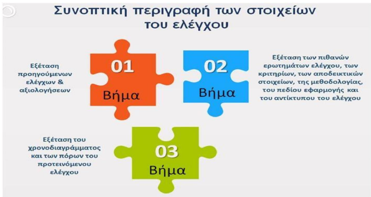
Εικόνα 3: Συνοπτική περιγραφή των στοιχείων του ελέγχου.

Σημαντικό είναι επίσης να ελεγχθεί το χρονοδιάγραμμα και οι πόροι που βρίσκονται προς αξιοποίηση, ώστε η ελεγκτική ομάδα να μη βγει εκτός χρονικού πλαισίου αλλά σαφώς να διευθετήσει και το οικονομικό σκέλος του ελέγχου. Η χρονική διάρκεια του ελέγχου είναι ένας σημαντικός παράγοντας και πρέπει να οριστεί με σαφήνεια και όσο το δυνατόν καλύτερη ακρίβεια. Για τη διευκόλυνσή της και την ρεαλιστική πρόβλεψη του χρόνου η ομάδα μπορεί να βασιστεί σε παλαιότερους ελέγχους επιδόσεων. Ένα ακόμα σημαντικό κριτήριο το οποίο μπορεί να επηρεάσει τον έλεγχο και χρήζει προσοχής είναι να ακολουθείται ο ισχύον νόμος για τον εκάστοτε ελεγχόμενο τομέα, καθώς η νομοθεσία συχνά αλλάζει. Τέλος η εμπειρία, οι εξειδικευμένες επαγγελματικές γνώσεις και η καταλληλότητα των ελεγκτών θα πρέπει να εξετάζεται από την ελεγκτική ομάδα για το καλύτερο αποτέλεσμα του ελέγχου.