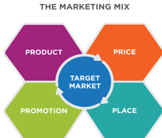
Εικόνα 1: Το μίγμα marketing 4P.

των κατηγοριών στην αγγλική γλώσσα, Product, Place, Price, Promotion, έννοιες συμπληρωματικές μεταξύ τους. Αναλυτικότερα: