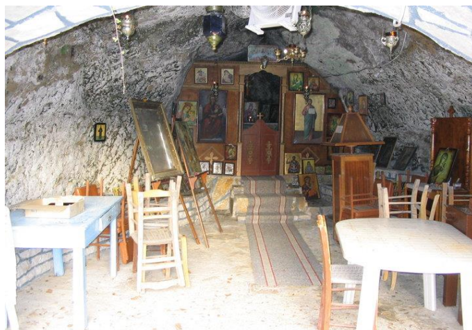
(Φωτογραφία από το εσωτερικό της εκκλησίας)

προσκυνητές με γλυκίσματα, κουραμπιέδες και δίπλες, τα οποία έχουν φτιάξει μόνες τους. Φεύγοντας από το εκκλησάκι και αφού κατέβεις αρκετά σκαλοπάτια φτάνεις σε έναν χώρο με πολλά πλατάνια, στο χώρο αυτό οι παλιοί μετά την εκκλησία έκαναν πανηγύρι. Ο Πολιτιστικός σύλλογος του χωριού με υπεράνθρωπες προσπάθειες κατάφερε να αναβιώσει αυτό το έθιμο το 1990. Μέχρι το 2019 κάθε 22-23 Αυγούστου πραγματοποιούνταν διήμερο πολιτιστικών εκδηλώσεων. Δυστυχώς όμως το 2019 οι μηχανικοί του Υπουργείου Πολιτισμού, μετά από αυτοψία, έκλεισαν το χώρο που βρίσκεται το εκκλησάκι, διαπιστώνοντας ότι υπάρχει κίνδυνος από την πτώση βράχων. Από τότε άρχισε μια τεράστια γραφειοκρατική διαδικασία και μεγάλες έχθρες και διχόνοιες ανάμεσα στους κατοίκους του χωριού. Πριν από λίγο καιρό, συγκεκριμένα στις 18/01/2022 η πρόεδρος του Συλλόγου ανακοίνωσε ότι οι μελέτες έχουν ολοκληρωθεί και το έργο αποκατάστασης θα χρηματοδοτηθεί από δημόσιες δαπάνες. Ευχή όλων των κατοίκων είναι το εκκλησάκι να αρχίσει να ξαναλειτουργεί και όλοι να έχουν την ευκαιρία να ανάψουν ένα κεράκι και να γλεντήσουν με παραδοσιακά τραγούδια και χορούς.