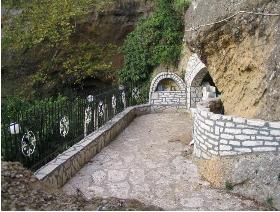
(Φωτογραφία από το χώρο εισόδου στο εκκλησάκι)