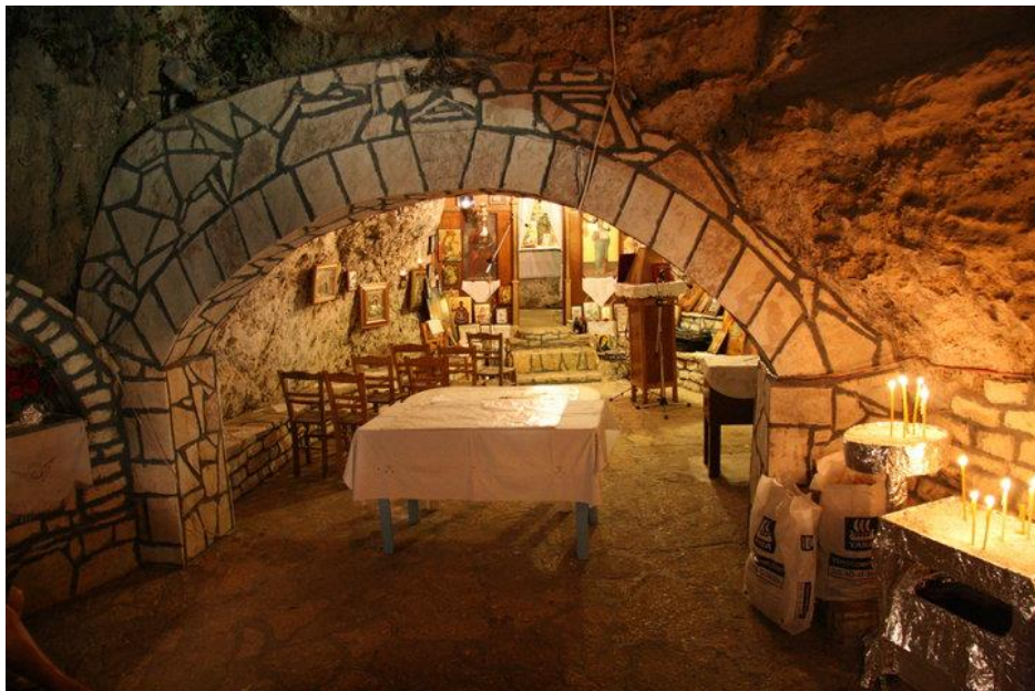
(Φωτογραφία από το εσωτερικό της εκκλησίας)