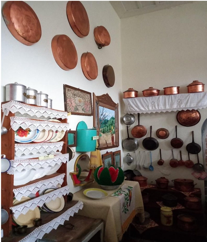
(Φωτογραφία από το εσωτερικό του Λαογραφικού Μουσείου Καλίδονας, "Το βασίλειο της νοικοκυράς")

Το Λαογραφικό Μουσείο είναι ανοιχτό προς όλους τους επισκέπτες καθώς επίσης και για όλα τα σχολεία που θα επιθυμούν να έρθουν να γνωρίσουν το χωριό και να επισκεφτούν το μουσείο κάνοντας μια αναδρομή στο χρόνο και στην ιστορία της περιοχής. Οι επισκέπτες, αλλά και τα σχολεία είναι πολλά ειδικά τους μήνες της άνοιξης και του καλοκαιριού. Το 2017 η εκπομπή από "τόπο σε τόπο " ανταποκρίθηκε στην πρόσκληση του συλλόγου και επισκέφτηκε το χωριό κάνοντας ένα αφιέρωμα τόσο στο λαογραφικό μουσείο όσο και στις πολιτιστικές εκδηλώσεις που πραγματοποιούνται στο εκκλησάκι της Παναγίας στο χώρο του Βαρκού.