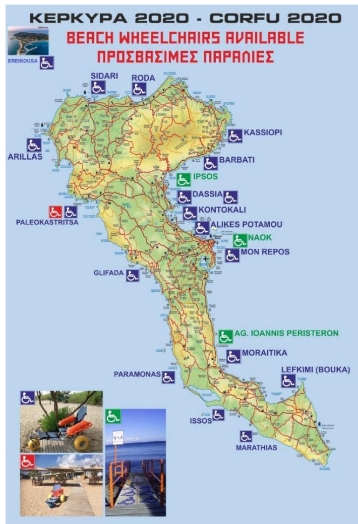
Εικόνα 1: Χάρτης προσβάσιμων παραλίων Κέρκυρας