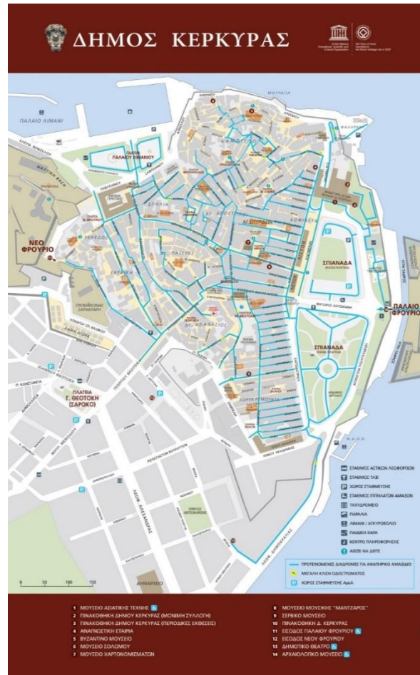
Εικόνα 2: Χάρτης προσβάσιμων διαδρομών στο ιστορικό κέντρο της Κέρκυρας