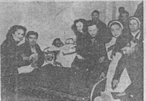
Άντιπροσώπια της Ένώσεως Οικογενιών Στρατού έπισκέπεται τους θορακίς τραυματίας εις ένα των νοσοκομείων μας και κόπια μαζί τους την κέπια.