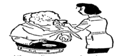
Με περιέλουσε με την κάναπνη Λένινς.

Μιά ώραία ξανθιά μέ τά ευριστικά της εργασία πέρασε μισον ήμερών την πύλη του Σπασκό κών, τού κτίου της αιν. αιν. ρικονικής πρεσβείας, για να