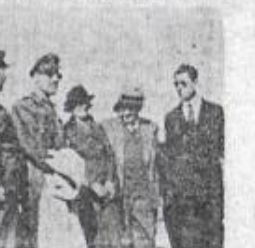
Ἡ κ. Βικ Φλίτ μιλά πρὸς τοὺς Μακρονησιώτας

Ἐπικολούθησε ἕνα γέφυρα εἰς τὴν Νέσων ἀνεχωρήσαντων τοῦ Ἄ. Ε. Τ. Ο., κατὰ τὴν διάρκειαν τοῦ ἴσους τὸ μουσικὸν συγκροτήματα τοῦ τάγματος παρῶν ἦσαν ἕνα ἐκλεκτὸ καλλιτεχνικὸν πρόγραμμα. Τὸ ἀπόγευμα οἱ ἐθνικὸς μας ἦλθαν εἰς τὸ Ἄ. Ε. Τ. Ο. — Ε. Σ. Α. Ι. ὅπου τὸς ὑπεβύθη ἡ κ. Βικ Φλίτ, ὁ κ. Μεγαλόπουλος ὁ Γενικὸς στρατοπεδάρχης ἀντισυνταγματάρχης κ. Θεωρίας Μπαϊρακτάρη καὶ ὁ ὑπολοχαγὸς κ. Σούζης, ἐξομολογῶντες τὴν συμβολὴν τῆς Μακρονήσων καὶ τῶν Μακρονησιωτῶν εἰς τὴν κληρονομία τῶν ἔθνικων ἐπισκοπῶν. Οἱ ἐκλεκτοὶ μας (ἐκεῖ ἔργον συνοδοκλήτως τὰς φέροντες τῶν ἐπιθεωρήσεων καὶ μετὰ τὴν ἐξομολογῶν πλὴν πεποιθήσιν ὅτι ἡ Μακρονήσος ἀποτελεῖ τὴν πλὴν περιττοὺν Νίκην τῆς Ἑλλάδος.