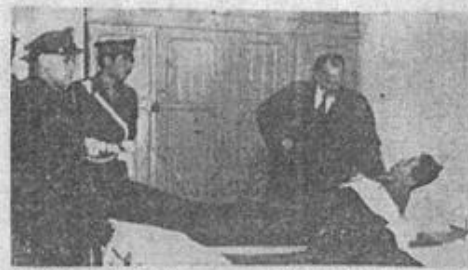
Ο Ύπουργός των Στρατιωτικών κ. Κωνσταντίνος Φρακίπεται έπί ύπεκρίση των έσπερων τούς νοσηλευμένους εις τό 401 στο. Νοσ. θορακίς τραυματίας.

νιζε η λέσχη εμψυχήσια. Το βράδυ στη λέσχη αξιωματικών