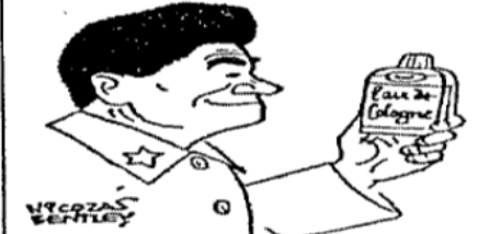
Τό προτραίτο ενός Ρώσου που λέγει «ναί».

Μιά φορά γνώρισα έναν κουρέα που έυρισε τους ήγέτας του Κρεμλίνου και μεθ' άπεκάλυψε ότι τά τελευταία χρόνια της ζωής του ό Στάλιν έχανε τά μαλλιά του επικίνδυνος, αλλά χάρις εις τό τμήμα προπαγάνδας δεν φαινόταν στις φωτογραφίες χάρης