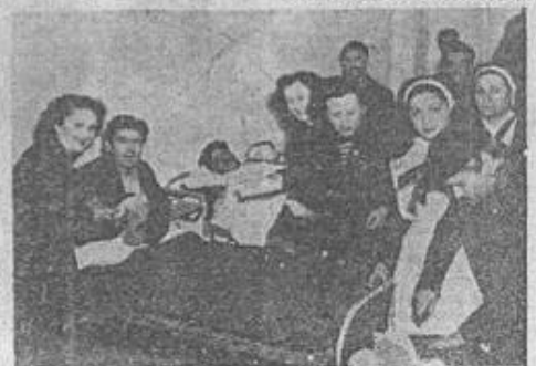
Άντιπροσώπια της Ένώσεως Οικογενιών Στρατού έπισπύεται τούς θορακίς τραυματίας εις ένα τών νοσοκομείων μας και κόπιε μαζί τους την κέπτια.