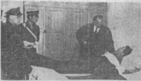
Ο Υπουργός των Στρατιωτικών κ. Κανελλόπουλος επισκέπτεται έπι έκκλησία των έσπερων τους νοσηλευμένους εις το 401 στο Ν.σο. θορακίς τραυματίας.

νιζε Αλέκος Εμμανήλα. Το δούλο στα λέσχη αξιωματικών