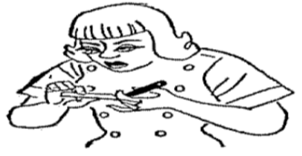
Στή Ρωσία οι ξανθιές προτιμούν τους άνδρες.

Η Ισάττης των γυναικών επετείετο εις όλους τους τομείς οικοδομής, δημόσια έργα κ.λ. άλλ. έκείνο που μέ γοητεύει