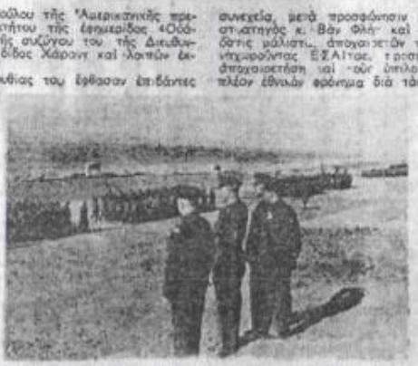
Ὁ Στρατηγὸς κ. Βῆν Φλίτ, ὁ Γεν. Διευκτῆς τοῦ Ο. Α. Μ. Ταξ. κ. Μπαϊρακτάρη, κ. λ. π. παρεκολούθησαν εἰς Μακρονήσων παρελαβὴν τῶν ἀνδρῶν.

κοὴν ἀμιλίαν τοῦ Ταξιαρχοῦ κ. Μπαϊρακτάρη πρὸς τοὺς κρατούμενους καὶ στρατιώτας τῶν Σ. Φ. Μ., οἱ ἐπισκέπται, ἐπιθεωρητῆς ἀλλοκλήτων ἀνεχώρησαν διὰ τὸ ἐδικὸν στρατιωτικὸν Ἀναμορφωτικὸν Ἰδιωτικὸν, ὅπου τοὺς ὑπεβύθη ὁ Διοικητῆς τοῦ Ἄ. Ε. Τ. Ο. (Ε. Σ. Α. Ι.) ταγῆρα κ. Ἀντωνίου Βασιλοπούλου. Ἐπικολούθησε ἐπιθεωρήσεις τῶν παρατεταγμένων Ε. Σ. Α. Ι. τῶν καὶ ἐν συνεχείᾳ μετὰ προσθέντην ἱδιωτικῶν, ὤμιλησαν δι' ὀλίγων ὁ στρατηγὸς κ. Βῆν Φλίτ καὶ ὁ ταξιαρχὸς κ. Μπαϊρακτάρη, ὅτι μάλιστα, ἀπογοητῶν τὸς κοπ' ἀείρας τὰς ἡμέρας ἀνεχωρήσαντες Ε. Σ. Α. Ι. τῶν, τῶν ἐπέθεσαν ὅτι ἐλάλει συντόμως γὰ ἀπογοητικῆ καὶ τοῦ ὑψηλοῦ ἀνεχωρήσαντες μὲ ἀκούσιον πλὴν ἔθνικον εὐφραμίαν διὰ τὰς ἐπίσεις τῶν.