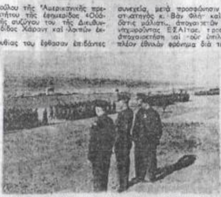
Ὁ Στρατηγὸς κ. Βᾶν Φλίτ, ὁ Γεν. Διευθ. τοῦ Ο.Α.Μ. Ταξ. κ. Μπαϊρακτάρη, κ.λ.π. παρεκολλήσαν εἰς Μακρονήσον παρεταγεμένην τῶν ἀδελφῶν.

κοὴν ἀμιλίαν τοῦ Ταξιαρχοῦ κ. Μπαϊρακτάρη πρὸς τοὺς κρατούμενους καὶ στρατιώτας τῶν Σ.Φ.Μ., οἱ ἐπισκέπται, ἐπεθεύρασαν ἀδελφότητῶν ἀνεχώρησαν διὰ τὸ ἐλεκτὸν στρατιωτῶν Ἀνωρροεπιπέδου ἱδιοκτῆτου, ὅπου τοὺς ἐπεθεύρα ὁ Διοικητῆς τοῦ Ἰ. Ε.Τ.Ο. (Ε.Σ.Α.Ι) ταγῆρα κ. Ἀσπριόκη Βασιλοπούλου. Ἐπηρεκολλήσαν ἐπιθέσεις τῶν παρεταγεμένων Ἰ.Ε.Α.Ι.τῶν καὶ ἐν συνεχείᾳ μετὰ προσέβησαν ἱδιοκτῆτου, ὁμιλήσαν δι' ὀλίγων ὁ στρατηγὸς κ. Βᾶν Φλίτ καὶ ὁ ταξιαρχὸς κ. Μπαϊρακτάρη, ὅπου μάλιστα, ἀπογοητῶν τοὺς κατ' ἄδειαν τὰς ἡμέρας ἀνεχωρήσαντες Ἰ.Ε.Α.Ι.τῶν, ἐπέβησαν ἐπὶ ἐλεκτῶν συντάξεων γὰ ἀποχωρήσασθαι καὶ τοὺς ὑπολοίτους ἀνεχωρήσαντες μὲ ἀκούσιον πλῆθον ἔθνικῶν εὐφρασμα διὰ τὰς ἐπίσεις των.