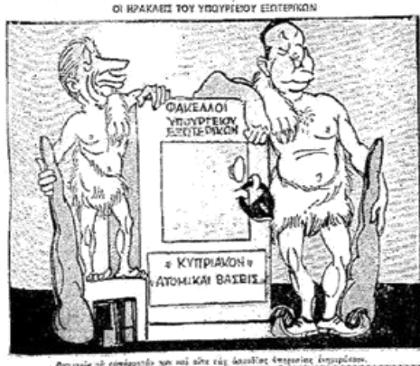
Μηνύματα οι κομμάτια των και άλλα επί άσφαλις έτοιμας έτοιμας.