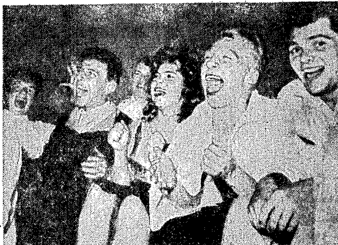
Άησυχητικά φαινόμενα θεωρούνται εις την Τσεχοσλοβακίαν οι μοντερνισμοί των νέων και κυρίως η τυφή αγάπη τους προς κάθε τι το αμερικανικόν. Καί φυσικά, η μουσική τζάζ είναι το πιο αγαπητό δείγμα της αμερικανικής ζωής, όπως δείχνει ο ένθουσιασμός των νέων αυτών ενώ ακούουν ένα κοντρίνο ρυθμό.

Ο τύπος διαμαρτύρεται έναντίον του ροκ εντ ρολ και άπηγορεύθη είσαγωγή τής τσίχλας