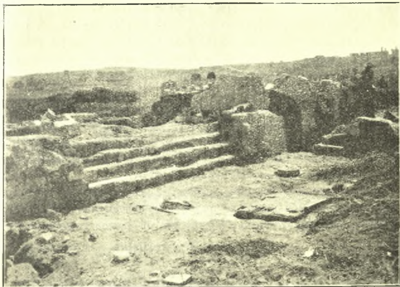
Εικ. 3. Αί άγουσai εις τόν επισκοπικόν θρόνον βαθμίδες και ή κάτω πλάς της άγίας Τραπεζής μετά των βάσεων του Κιβωρίου αυτής.

δου ή επιγραφή του επισκόπου Άλκίσονος), άτινα είναι προσκτίσματα του άνασκαπτομένου παλαιοχριστιανικού μνημείου. Καθωρίσθη ούτω μεγαλοπρεπές σύμπλεγμα περι μέγαν χριστιανικών ναόν ρυθμού Βασιλικής μετά Νάρθηκος και Αιθρίου, περιβαλλόμενον πιθανώτατα διά στοάς, μέρη της οποίας άνεσκάφησαν εις προηγούμενα έτη παρὰ την δημοσίαν όδόν. Ή ούτω προσδιορισθείσα Βασιλική έχει όλικόν μήκος 68.90 μ. και πλάτος 31.60 μ. (εικ. 2).