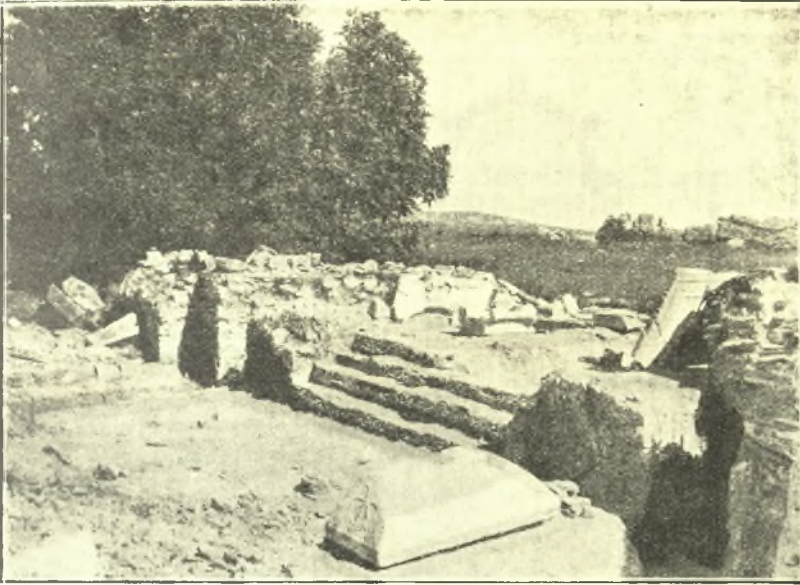
Εἰκ. 1. Ἀποψὶς τοῦ ἀνευρεθέντος ἱεροῦ Βήματος τῆς Βασιλικῆς τῆς Νικοπόλεως.