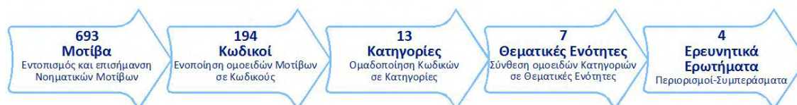
Εικόνα 1. Διαδικασία Θεματικής Ανάλυσης στην Έρευνα

Η σύνθεση των απαντήσεων στα τέσσερα (4) προσδιορισθέντα Ερευνητικά Ερωτήματα αποτελεί προϊόν εξαγωγής συμπερασμάτων από τα αποτελέσματα της ερευνητικής διαδικασίας και δη της θεματικής ανάλυσης σε όλα τα ιεραρχικά επίπεδα: Εννοιολογικά Μοτίβα > Κωδικοί > Κατηγορίες > Θεματικές Ενότητες > Ερευνητικά Ερωτήματα (Εικόνα 1).