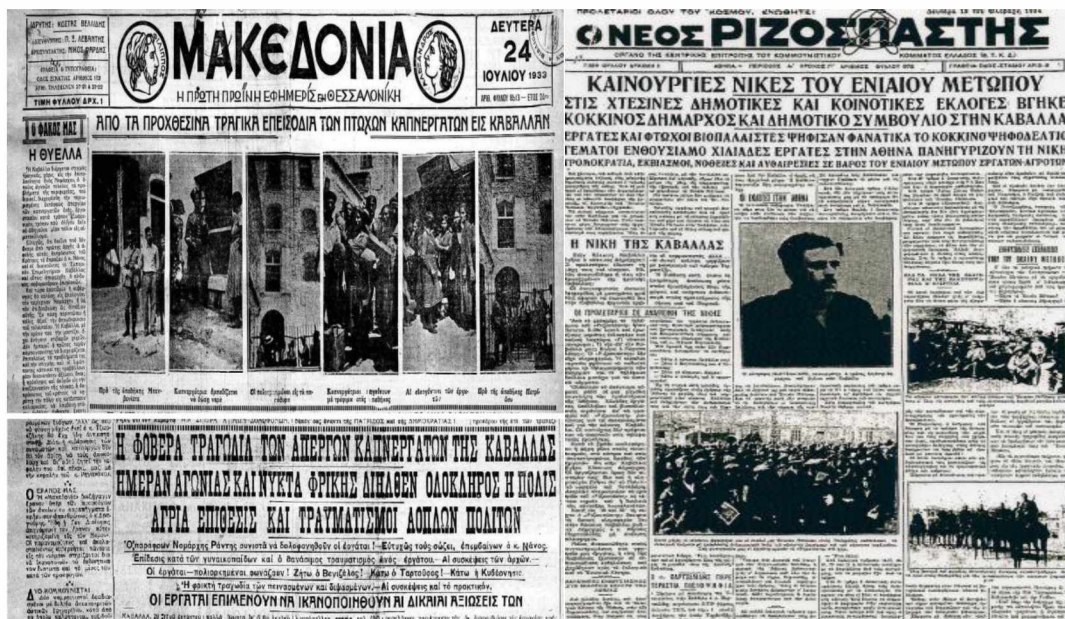
Εικόνα 6. Πρωτοσέλιδο της εφημερίδας Μακεδονίας (24/7/1933). Η απεργία των καπνεργατών στην Καβάλα αποτυπώνεται χαρακτηριστικά σε αυτό το πρωτοσέλιδο: