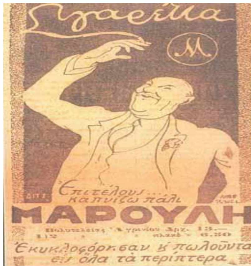
Εικόνα 5: Διαφήμιση της καπνοβιομηχανία Μαρούλη τη δεκαετία του 1920.