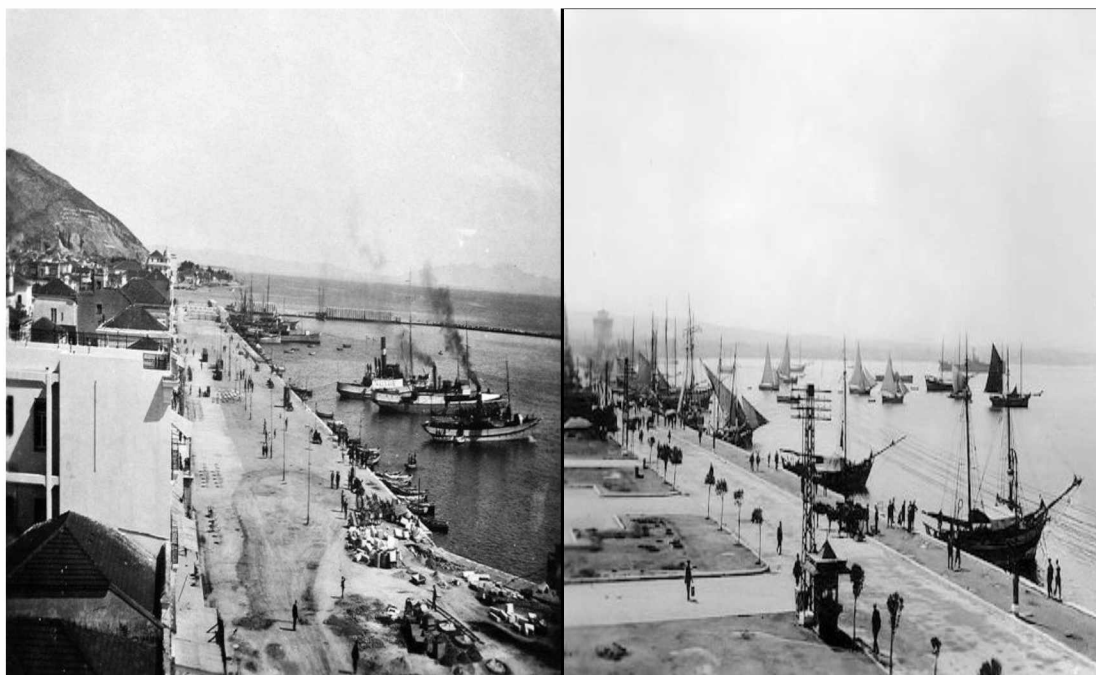
Εικόνα 3-4: Το λιμάνι του Βόλου, τη δεκαετία του 1920 και το λιμάνι της Θεσσαλονίκης, τη δεκαετία του 1930. Σε αυτά τα λιμάνια διεξαγόταν, σε μεγάλο βαθμό, το εμπόριο του καπνού κατά τον Μεσοπόλεμο