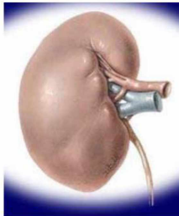
ΕΙΚΟΝΑ 1: (Ανθρώπινοι Νεφροί).

Ο όρος νεφρός, παράγεται εκ του ρήματος νεώ που σημαίνει ανανεώνω και το ρήμα φρέω-ώ που σημαίνει εισάγω, αφήνω κάτι να εισέλθει. Αυτό ακριβώς πραγματοποιούν και οι νεφροί (εικόνα 1), επεξεργάζονται το πλάσμα του αίματος από το οποίο κατακρατούν διάφορες ουσίες και σε ελάχιστες περιπτώσεις προσθέτουν σε αυτό κάποιες άλλες.