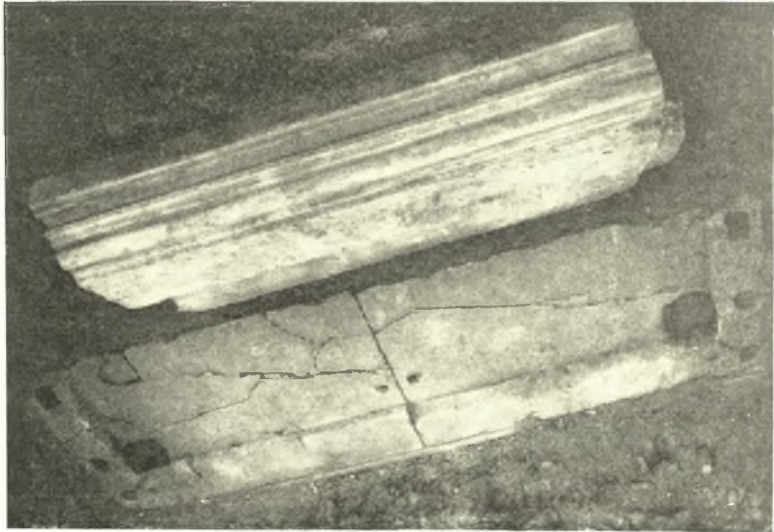
Εἰκ. 1. Γλυπτὰ μέλη τῆς κεντρικῆς πύλης τοῦ νάρθηκος.

Ἐφέτος ἀπεκάλυψα διὰ σκαφικῆς ἐρεῦνης δλόκληρον τὸν νάρθηκα καὶ τὸ αἶθριον τῆς μεγάλης βασιλικῆς τῆς Νικοπόλεως τῆς κειμένης κατὰ τὸ μέσον τῆς Ἰουστινιανείου πόλεως καὶ δεξιὰ τῆς δημοσίας ὁδοῦ Πρεβέζης-Ἰωαννίνων, τὸ κύριον σῶμα τῆς ὁποίας ἀνεσκάψαμεν πέρυσι μετὰ τοῦ κ. Ὁρλάνδου (ΠΑΕ 1937 σ. 78 ἔ). Πλὴν τοῦ νάρθηκος καὶ τοῦ αἶθριου ἀπεκάλυψα καὶ μέγα μέρος τῆς πρὸ τοῦ αἶθριου στοᾶς, ἣτις πιθανώτατα περιβάλλει τὸ ὅλον συγκρότημα τῆς βασιλικῆς μετὰ τῶν προσκτισμάτων αὐτῆς.