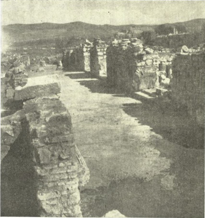
Εἰκ. 2. Γενικὴ ἄποψις τοῦ ἀποκαλυφθέντος νάρθηκος τῆς μεγάλης βασιλικῆς τῆς Νικοπόλεως.

μετὰ γλυφῶν περιθυρώματα εἰς τεμάχια, ὧν ἓν διακρίνεται παρὰ τὸ κατώφλιον εἰς τὴν (εἰκ. 1). Τὸ σχῆμα τοῦ νάρθηκος τούτου εἶναι ἱκανῶς πρωτότυπον, καθ' ὅσον ἐκτείνεται ἐκατέρωθεν τοῦ σώματος τοῦ ναοῦ, ἀνοιγομένων τριβήλων εἰσόδων, διακοσμεῖται δὲ καὶ ἡ κυρία πύλη τοῦ ναοῦ διὰ τετρακιονίου.