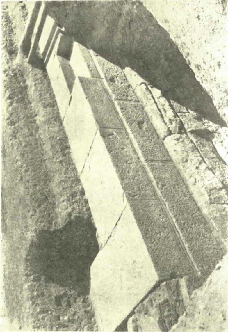
Εἰκ. 1. Βορειοδυτικὴ γωνία οἰκοδομήματος 4ου αἰῶνος Δολίχου ;.

καὶ νὰ δεχθῶμεν, ὅτι τὸ οἰκοδόμημα εἶναι ὁ περίβολος τοῦ τεμένου τοῦ Τριπτολέμου καὶ ὅτι ἐντὸς τῆς περιοχῆς τούτου θὰ εὗρισκεται καὶ ὁ ναός,